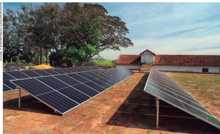
Serão realizadas reuniões técnicas em diferentes locais, com a apresentação de casos de sucesso e demonstração das vantagens dos sistemas de geração própria de energia