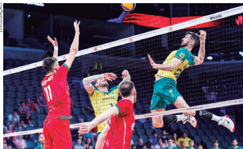
Equipe comandada por Renan Dal Zotto triunfou por 3 sets a 0