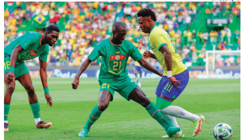
No segundo e último amistoso da Data Fifa, o Brasil até saiu na frente com Paquetá, mas acabou sofrendo a virada

Em nove minutos do segundo tempo, Senegal transformou em gols o domínio que tinha em campo. Primeiro um contra de Marquinhos, e depois um golaço de Mané, craque do time. Três minutos depois o Brasil descontou com Marquinhos, dessa vez a favor, mas mesmo com as mudanças que Ramon fez o time não teve