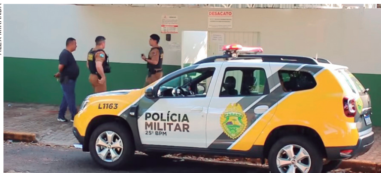
Unidades circulam dentro e fora dos colégios estaduais e municipais a fim de dar mais segurança aos alunos

de orientações às direções dos colégios e ainda novas reuniões online envolvendo também pais de alunos deverão acontecer. “A intenção destas novas reuniões e apontar aos pais e responsáveis pelos jovens, adolescentes e crianças, alguns detalhes que podem ajudar na orientação de cada aluno sobre sua conduta dentro do ambiente escolar”.