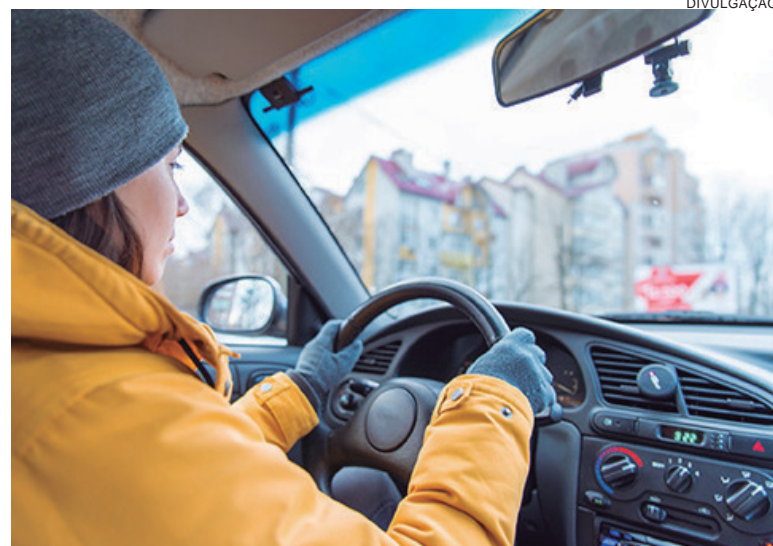
Atente-se às condições das vias: certifique-se de que as vias estejam livres de geada e neve antes de iniciar a rodagem

“Na Dunlop, nossa prioridade é garantir a segurança e o bem-estar dos nossos clientes. Sabemos que as baixas temperaturas podem representar desafios adicionais na estrada,