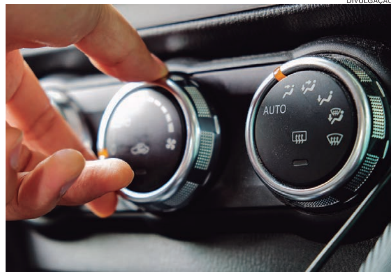
O ar-condicionado, que antes era opcional, agora é um item obrigatório nos veículos atuais e varia de acordo com a tecnologia utilizada

Antes de chegar ao destino, desligue o ar e deixe a ventilação ligada. Isso ajuda a secar os dutos e evita mau cheiro no próximo uso. Limpe o sistema por completo anualmente para evitar odores indesejados e acúmulo de sujeira. Evite usar a recirculação por muito tempo para manter o calor interno. Abra as janelas de vez em quando para renovar o ar