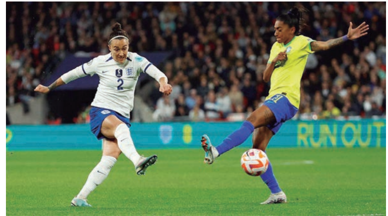
Pesquisa da Fifpro indica insatisfação de atletas de futebol