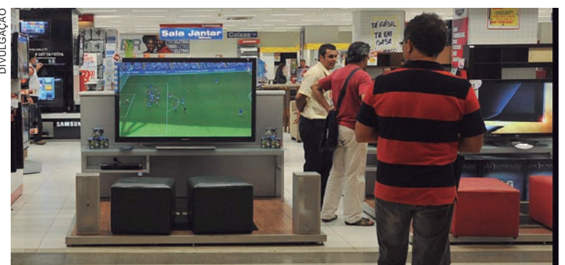
O estudo mostra que, naquele ano, os homens receberam, em média, R$ 3.484,24, enquanto as mulheres, R$ 2.995,07

Apesar da desigualdade, o levantamento também sinalizou que a participação feminina no mercado de trabalho voltou a crescer, depois de ter recuado no primeiro ano da