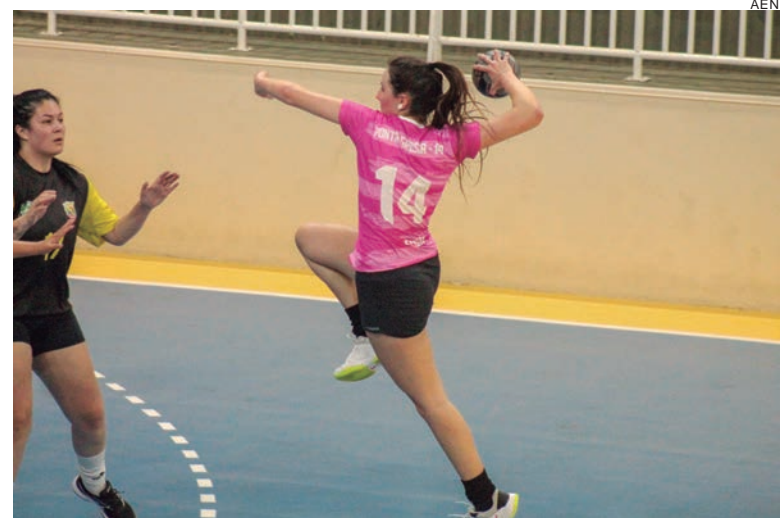
A competição é um dos eventos esportivos mais importantes entre os jogos oficiais do Estado