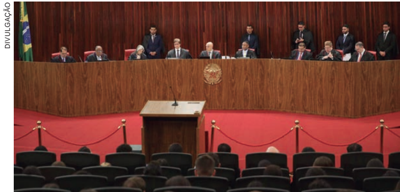
Se parecer for acolhido, ex-presidente ficará inelegível por 8 anos

O procurador disse que foram divulgadas informações falsas sobre as eleições por meio de transmissão do evento nas redes sociais e pela TV Brasil, uma emissora pública.