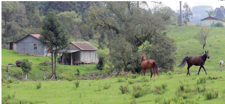
Em agosto, o IAT começa utilizar nas regionais o módulo de Análise Dinamizada do Sicar Nacional para automatizar a etapa de conferência dos cadastros

Além disso, de acordo com ele, responsável pelo departamento de emissão e controle do Cadastro Ambiental Rural (CAR), o mecanismo vai ter