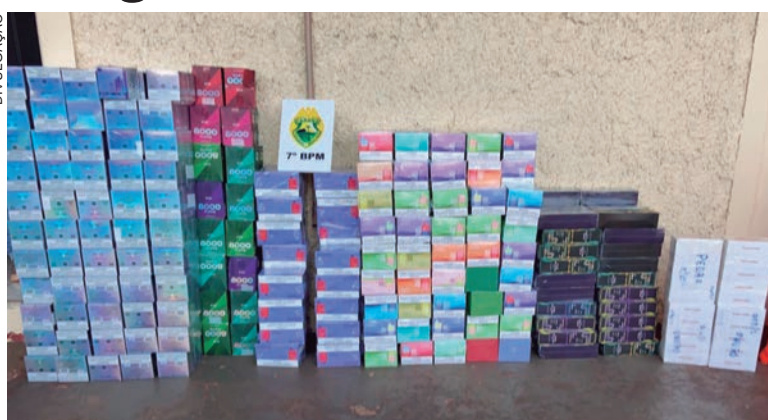
Mercadoria apreendida nas proximidades de Tapejara era transportada em um Voyage

O motorista foi identificado como um jovem de 28 anos que estava transportando 425 cigarros eletrônicos de diversas marcas, além de 20 celulares. Ele confessou para a equipe que a mercadoria – avaliada em $ 30 mil dólares ou aproximada-