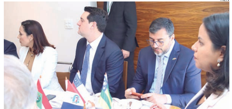
Além da discussão sobre fundos, a reforma tributária busca simplificar o sistema

“Estamos dispostos a ajudar com nossas bancadas a avançar na reforma tributária. O Comsefaz (Comitê Nacional de Secretários de Fazenda, Finanças, Receita ou Tributação dos Estados e do Distrito Federal) tem ajudado bastante nesse sentido. Mas, como coordenador do Sul e Sudeste no Cosud, quero dizer que não abrimos mão de incluir no relatório e na PEC alguns pleitos dessas duas regiões importantes para o País, e que nós ainda não temos, como a criação do Fundo de Desenvolvimento Regional do Sul e Su-