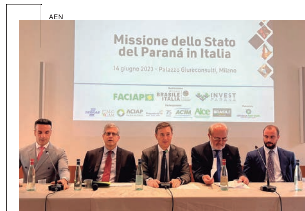
Boas oportunidades comerciais para o Estado foram captadas pela Invest Paraná na sexta missão internacional do ano, desta vez à Itália. De 13 a 17 de junho, a agência de negócios do Governo do Estado organizou com a Federação das Associações Comerciais e Empresariais do Paraná (Faciap), em Milão, uma série de encontros de empresários paranaenses de diferentes segmentos do varejo para prospectar novos fornecedores. A agência também abriu negociação para trazer ao Paraná uma empresa italiana especializada na organização de feiras comerciais internacionais, além de uma startup especializada em carregamento de carros elétricos. Em um único dia, foram 12 reuniões com fornecedores, não só para importar produtos italianos, mas também para se formar parcerias de distribuição.

A Secretaria de Estado da Fazenda lançou também ontem (quinta-feira, 22) uma cartilha sobre a reforma tributária de bens de consumo. Ao propor mudanças e simplificações em aspectos do sistema tributário brasileiro, a reforma é um tema estruturante, com repercussões para toda a sociedade e a economia do país.