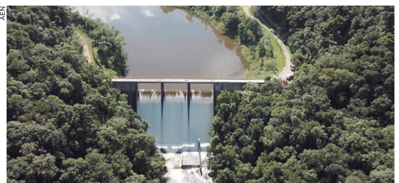
Iniciativa convoca organizações de todo o país a reconhecerem a importância da preservação

As metas da companhia reforçam a relevância da bio-