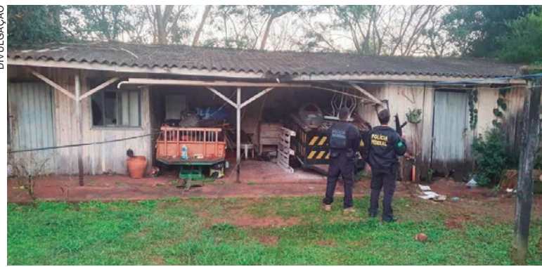
Casa aparentemente abandonada onde Polícia Federal encontrou mercadorias roubadas

A investigação denominada 'Corsário' teve início após uma denúncia anônima que levou os agentes da Polícia Federal até um determinado local da cidade de Guaíra, onde havia uma residência em aparente estado de abandono. A casa era utilizada como esconderijo para guardar produtos ilícitos, popularmente conhecida como 'mocó'.