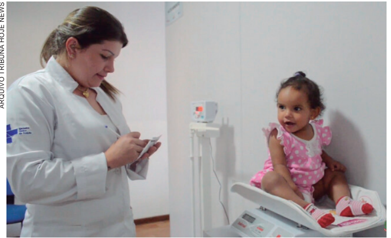
ARQUIVO TRIBUNA HOJE NEWS

As inscrições para o Mais Médicos iniciaram em 26 de maio, e durante praticamente