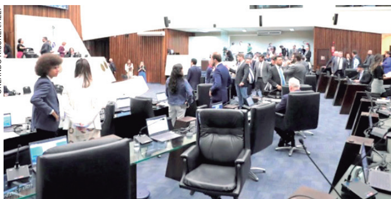
As propostas trazem o reajuste geral de 5,79% a ser concedido para cerca de 283 mil servidores ativos e inativos (aposentados e pensionistas)

Líder do Governo, o deputado Hussein Bakri (PSD)