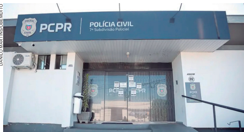
De portas fechadas, a Delegacia de Polícia de Umuarama não atende ao público até a próxima sexta-feira