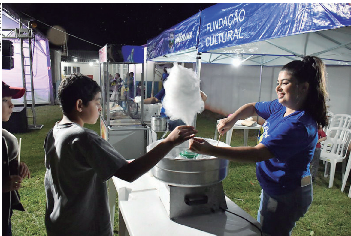
Programação em comemoração ao aniversário de Umuarama será encerrada nesta quinta-feira

Todos os cinco distritos de Umuarama foram contemplados com a ação ‘Prefeitura nos Distritos’, que leva atividades recreativas e culturais aos moradores – especialmente às crianças –, em programação que foi especialmente preparada para comemorar os 68 da cidade. Na terça-feira, (27) foi a vez de Roberto Silveira receber as atrações, que incluem brinquedos e apresentações musicais.