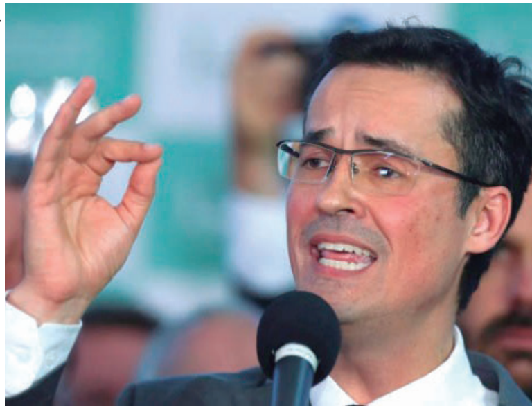
Deltan Dallagnol pediu a suspensão da decisão do TSE argumentando que a Corte eleitoral declarou sua inelegibilidade com base em “interpretação extensiva” da lei

Toffoli não viu danos aos direitos de Deltan Dallagnol nem