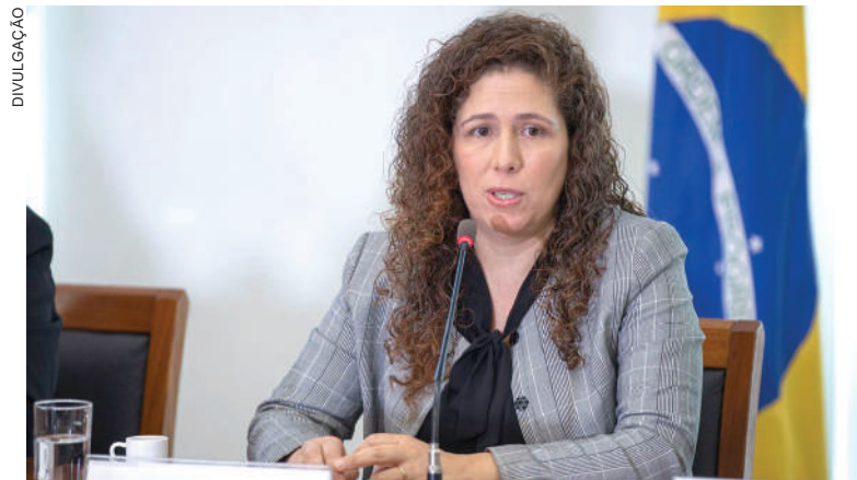
Segundo a ministra Esther Dweck, o IBGE é o órgão com maior número de cargos oferecidas

Com isso, o governo soma mais de 8.146 novas vagas abertas por concurso público neste ano. Se calculadas as nomeações autorizadas (1.799), o aumento do número de professores e técnicos de instituições de ensino (5 mil) e a ampliação de processos seletivos para servidores temporários (8.141), passa de 23 mil vagas o total autorizado