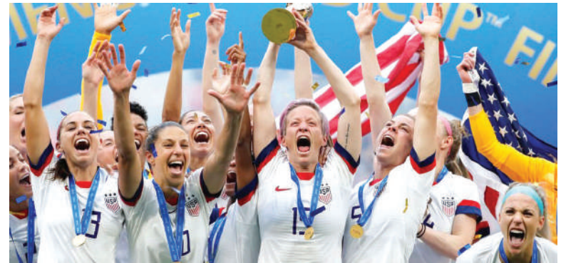
Luta pelo título deve envolver países como EUA, Inglaterra e Brasil

Se os Estados Unidos são uma realidade e a Inglaterra é uma potência emergente, a Alemanha é uma força que tenta retomar o protagonismo do passado. Com dois títulos mundiais na história (em 2003 e em 2007) e maior vencedora da Euro feminina (com o total de oito canecos, o último em