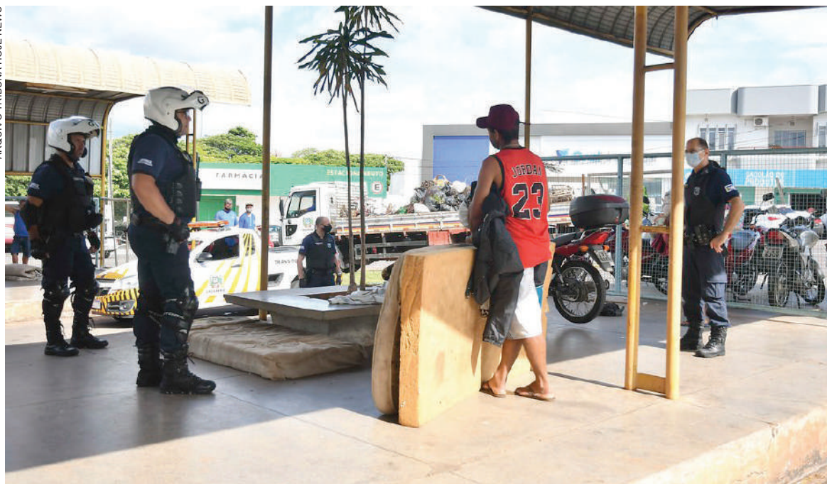
Ação será desenvolvida em toda a cidade na próxima quinta-feira

O intuito é acompanhar in loco esta realidade e contribuir com o planejamento de melhoria da oferta do serviço. “Para isso convidamos representantes de toda a sociedade civil organizada para acompanhar