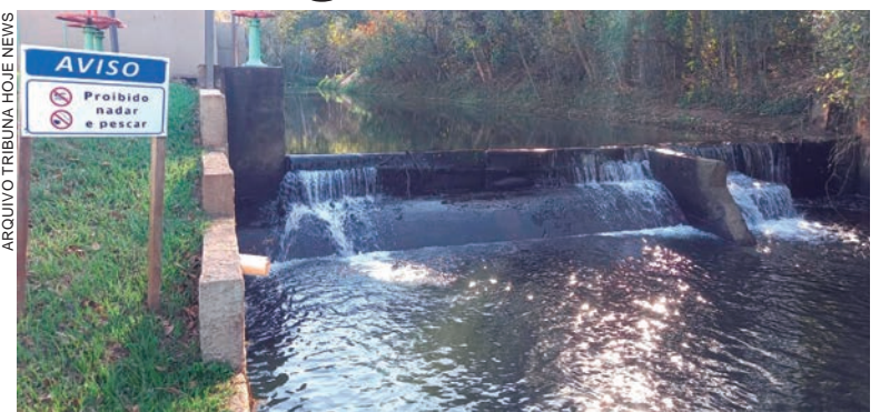
Manutenção na Estação de Captação de Água (ETA) deverá afetar o abastecimento em toda a cidade

Em situações como esta, a orientação feita pela empresa é de que a população faça o