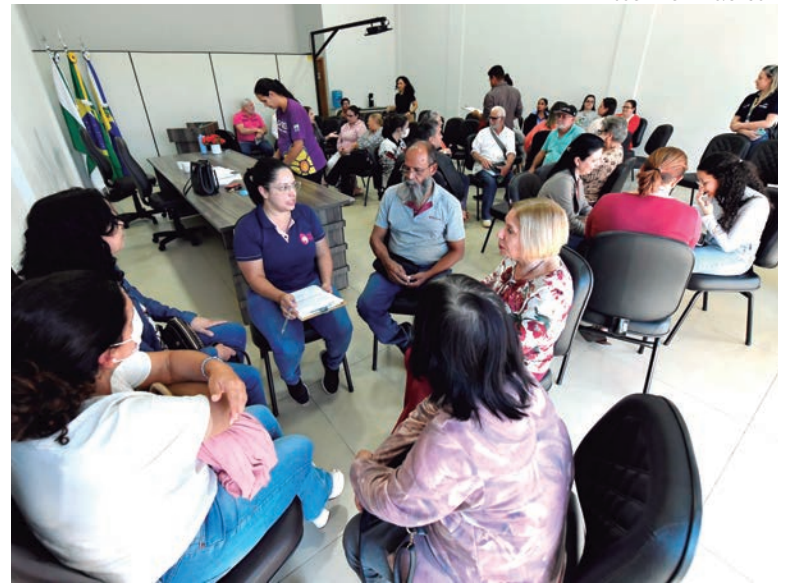
O conselho recebe denúncias e conselheiros devem tomar as medidas adequadas, alertando a Vigilância Sanitária, o MP, Procon e Secretaria de Saúde