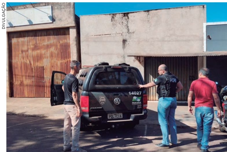
A prisão aconteceu após investigação realizada pela unidade policial que identificou uma residência que era utilizada para a venda de drogas

constitucional conferida à Polícia Civil de conduzir investigações criminais. “Novas ações desta natureza serão realizadas”, afirmou.