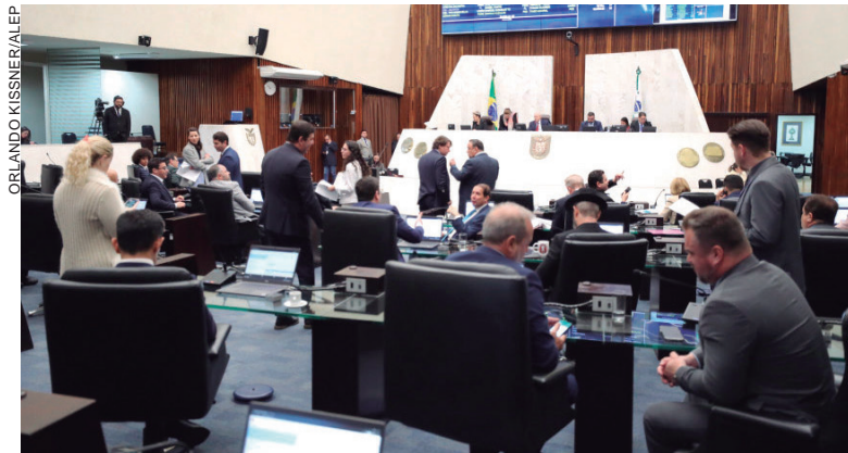
Das oito iniciativas, duas já haviam sido aprovadas na segunda-feira. Seis receberam emendas e foram votadas na CCJ e ontem, em três sessões plenárias

Apesar de emenda com indicação de índice de 12,13%, ficou mantido o reajuste previsto no projeto 532/2023, aos servidores do Poder Executivo do Estado. O valor ofertado é para 2023, com pagamento a ser realizado em parcela única no dia 1º de agosto deste ano. Entre as emendas, foi incorporada a que assegurou que todos servidores recebam o reajuste, o que, segundo a Oposição, não ocorria para