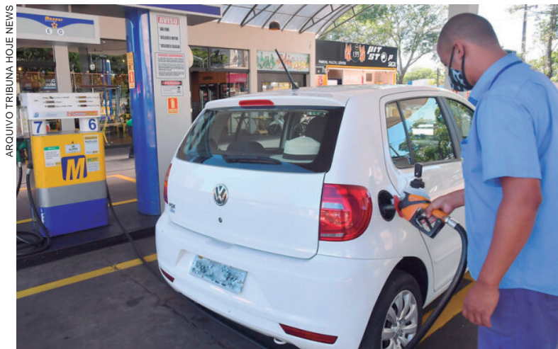
Procon de Umuarama apresenta pesquisa de preços de combustíveis e do gás de cozinha

Já quando se considera o preço com a taxa de entrega, o botijão mais barato foi encontrado a R$ 90 e o mais caro a R$ 130 – uma diferença de 44,4%. Na comparação com a