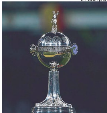
Etapa terá 6 clubes brasileiros em campo no período de 2 a 9 de agosto