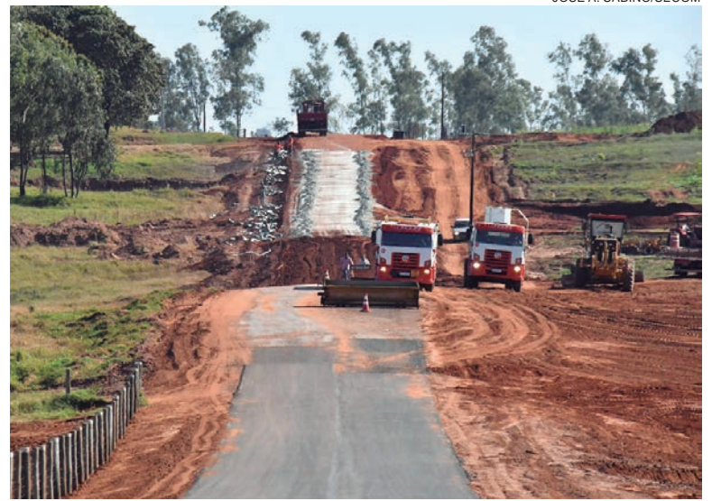
Em fevereiro deste ano a Prefeitura emitiu a ordem de serviço para o asfalto da Canelinha, dando continuidade ao projeto de Pozzobom

A pavimentação é executada pela Construtora Longuini, com prazo de obras estabelecido em seis meses a partir da ordem de serviço – podendo ser estendido em virtude de fatores externos, como intempéries climáticas. Alguns pontos já recebem o gramado que será implantado nas faixas laterais e os moradores já estão recolocando as cercas na posição, aproveitando a comodidade do acesso asfaltado às suas propriedades.