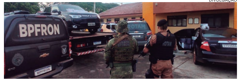
No contrabando, o crime teve um prejuízo de aproximadamente R$ 3,3 milhões com a apreensão de 697 mil maços de cigarro, além dos veículos recolhidos

cocaína, 0,3 gramas de crack e 292 comprimidos de ecstasy. Já no contrabando, o crime teve um prejuízo de aproximadamente R$ 3,3 milhões com a apreensão de 697 mil maços de cigarro. No setor de trânsito, 522 veículos foram apreendidos nas mais diversas infrações. As fiscalizações de trânsito vieram ao encontro do cuidado com a vida de toda a população, uma vez que muitos casos de embriaguez