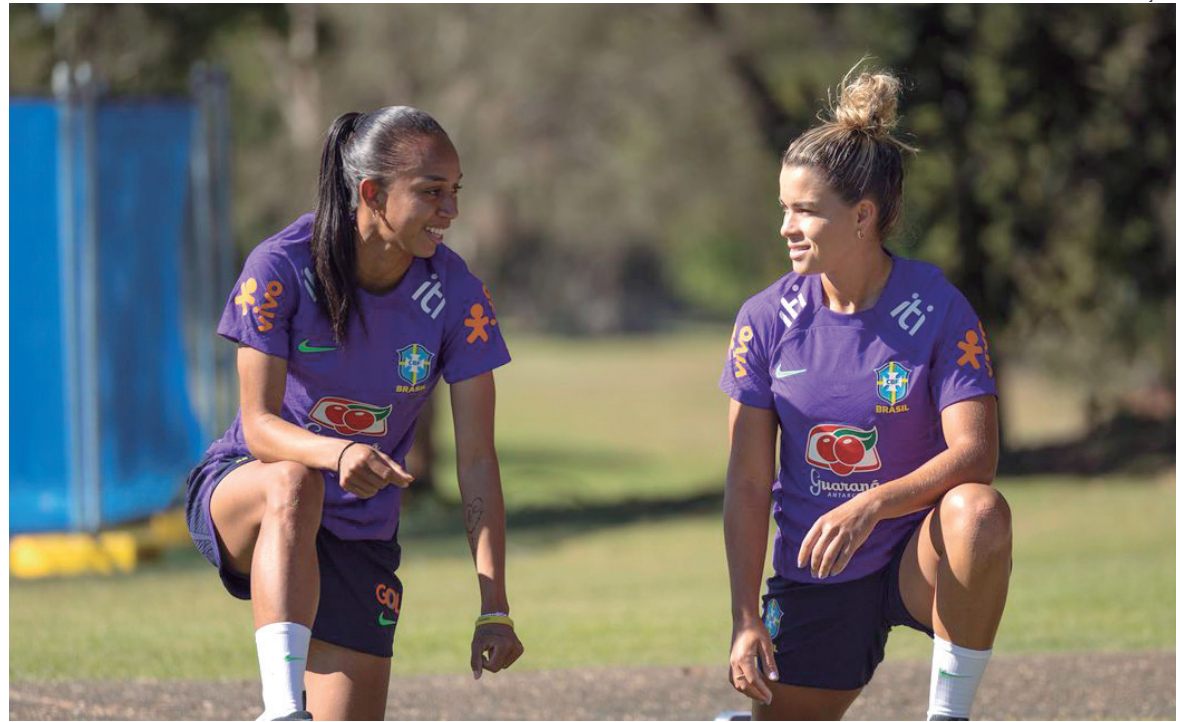
Equipe brasileira fez atividade leve para amenizar efeitos do fuso