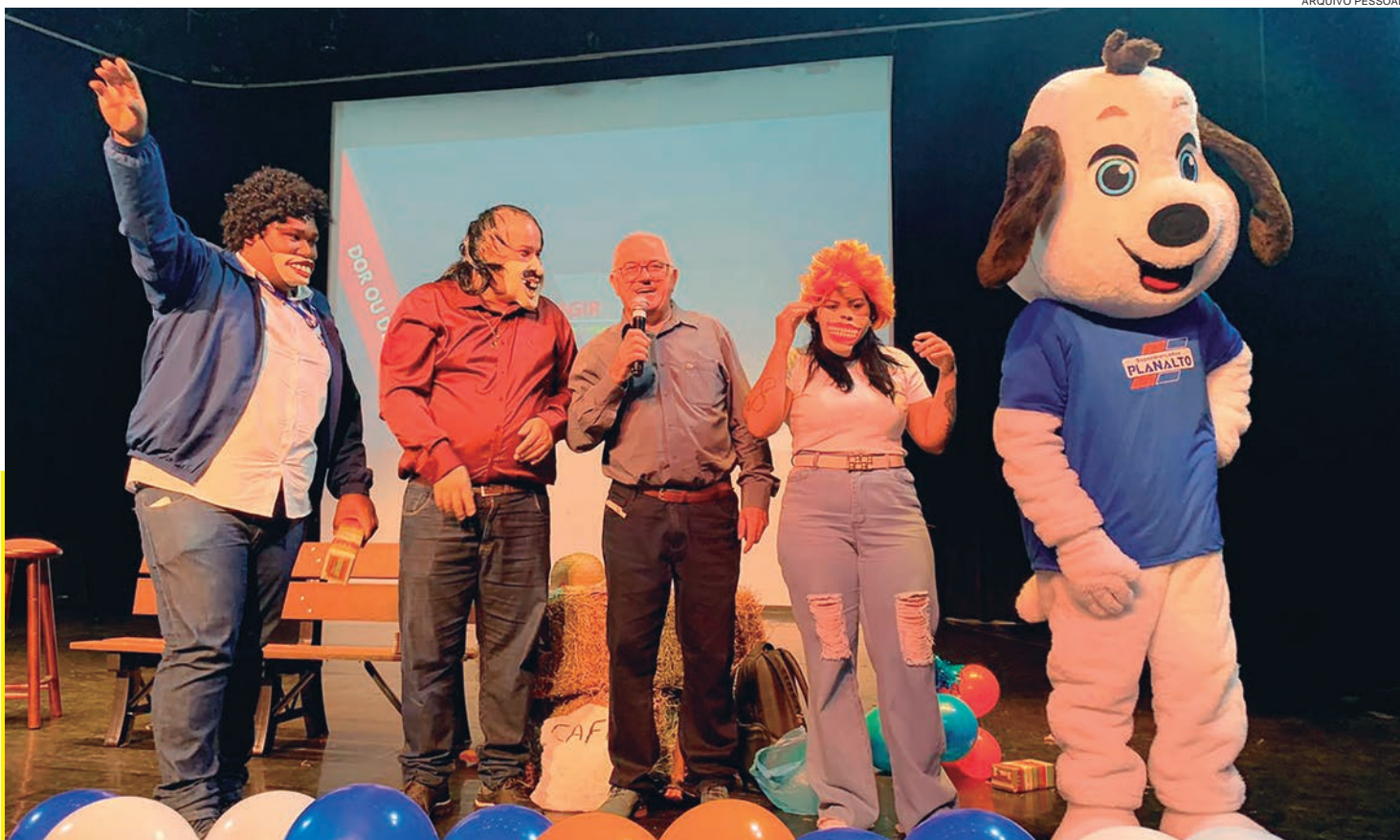
Palestra, alegria e mimos fizeram parte da festa Planalto 65 anos!

Um estudo publicado na revista Nature mostra que smartwatches foram capazes de prever quem terá doença de Parkinson anos antes de se tornar detectável. Por mais de uma década, 103.712 pessoas monitoradas por autoridades de saúde do Reino Unido receberam os relógios inteligentes para registrarem suas atividades por uma semana. De início, 273 delas foram diagnosticadas com Parkinson e, ao longo da pesquisa, outras 196 também tiveram a doença. Com a ajuda de inteligência artificial, os cientistas observaram os dados do acelerômetro dos relógios, que registra o início de cada movimento. Quase 200 pessoas foram diagnosticadas, em média, quatro anos após o primeiro registro dos smartwatches. Em alguns casos, a descoberta ocorreu com até sete anos de antecedência. (Globo)