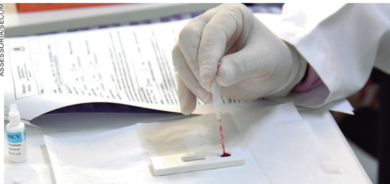
Número de pessoas em isolamento domiciliar caiu para 13 e o último óbito foi registrado há seis meses

A Divisão de Vigilância Epidemiológica da Secretaria Municipal de Saúde informou ontem (quarta-feira, 5), dois novos casos foram confirmados (duas mulheres), totalizando 12 nesses primeiros cinco dias de julho – uma média de dois casos diários. Entre 1º de janeiro e hoje, 1.344 pessoas foram diagnosticadas com Covid-19, sendo 60% mulheres, 37% homens e 3% crianças.