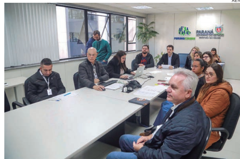
A Secretaria Geral irá normatizar a relação entre os municípios e empresas prestadoras do serviço, regulamentando os processos licitatórios, quando for necessário

Em ambas as reuniões, os prefeitos elogiaram a iniciativa do Governo do Paraná. O prefeito de Curitiba, Rafael Greca, destacou a importância do saneamento para a qualidade de vida da população. “Uma cidade com completo saneamento terá menos problemas de saúde. Atualmente, 25% da