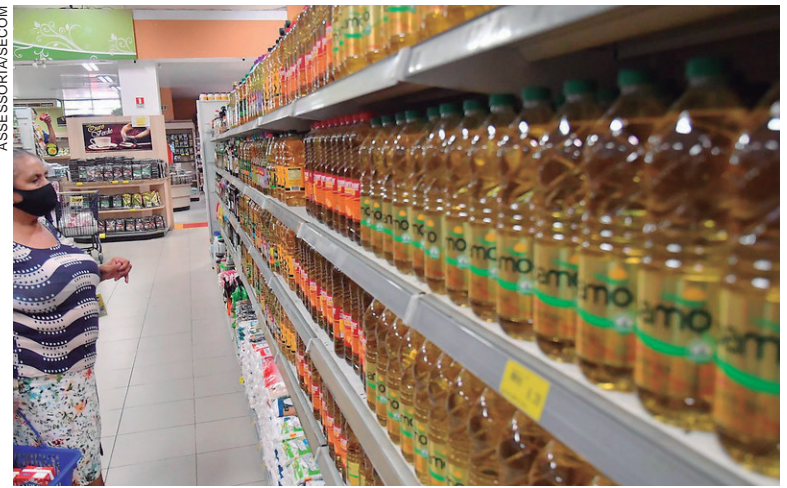
Para compor o preço final da cesta básica, são consideradas quantidades de produtos suficientes para a manutenção de uma família com quatro pessoas

De acordo com o último levantamento, os cinco produtos que ficaram mais baratos – considerando as marcas mais populares – foram o desodorante (34%), o feijão (31%), a margarina (28%), o óleo de soja (24%) e o creme dental (22%). Os produtos que tiveram maior reajuste nos preços foram a batata (21%), o pão e o alho (13%), o sabão em pó e o