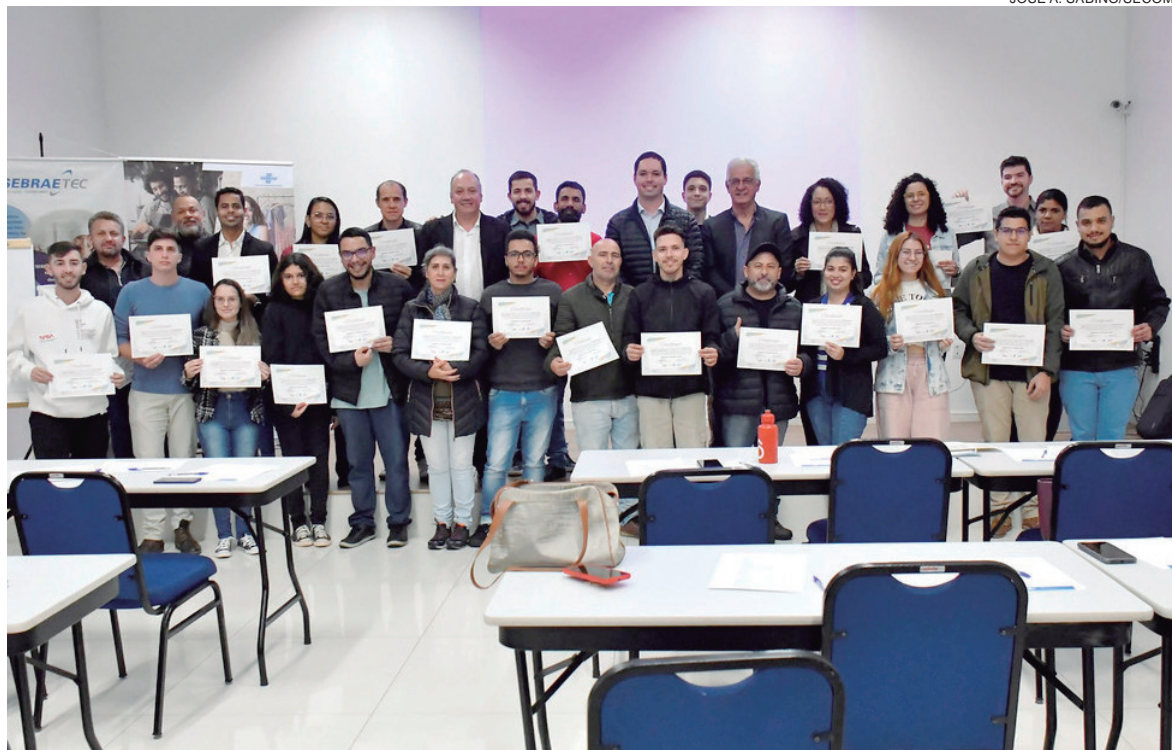
A entrega dos certificados foi realizada após a conclusão das 12h de carga horária do curso, iniciado na última segunda-feira

Com o propósito de qualificar o microempreendedor para tomar decisões acertadas e maximizar seus resultados a Casa do Empreendedor da Secretaria de Indústria e Comércio realizou um treinamento na área de gestão financeira, em parceria com o Sebrae. A entrega dos certificados foi realizada após a conclusão das 12h de carga horária do curso, iniciado na última segunda-feira, 10.