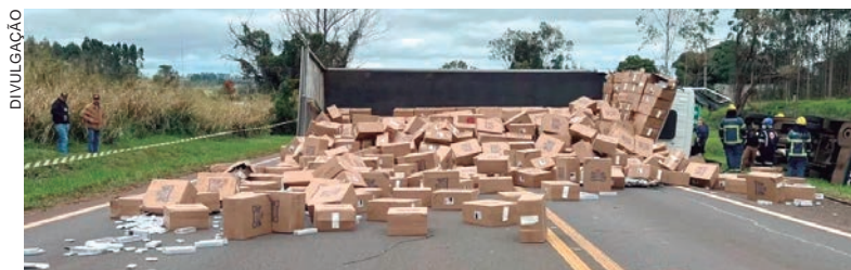
A carga com quase 800 caixas de cigarros contrabandeados do Paraguai ficou espalhada pela pista após a colisão

As vítimas do acidente relataram que um caminhão que seguia no sentido contrário da rodovia causou danos em dois automóveis.