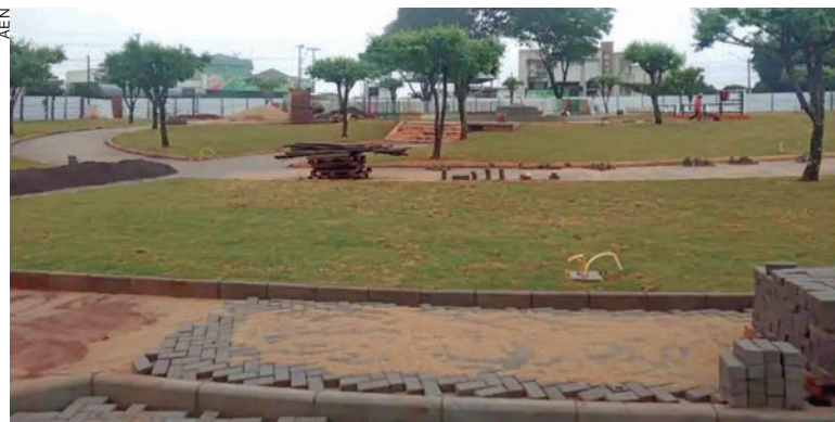
Recurso é a fundo perdido e será empregado em pavimentação de duas das principais ruas da cidade do Noroeste e tem 1.849 habitantes

Os recursos não precisam ser devolvidos ao Tesouro do Estado, uma vez que o projeto foi aprovado pelo Programa de Transferência Voluntária da Secid. Serão pavimentados 9.085,58 metros quadrados nas ruas Leovaldo Bento de Am-