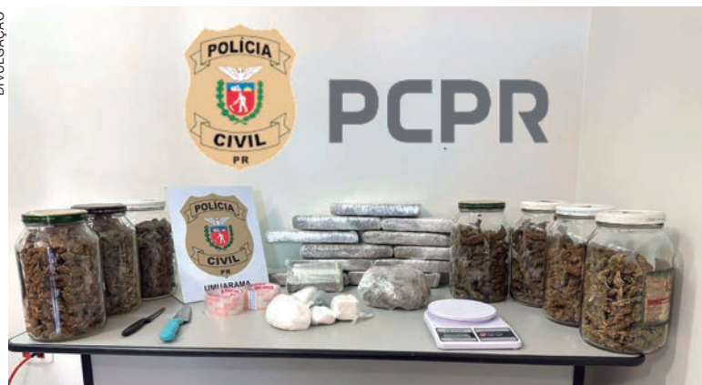
Drogas foram encontradas em uma casa aparentemente desabitada que servia apenas como ponto de armazenamento

Considerando o método usual de distribuição e venda dessas drogas ilícitas, sobretudo a cocaína, a Polícia Civil aponta que, com essa apreensão, mais de 600 porções de cocaína foram retiradas das ruas, gerando assim um prejuízo estimado em mais de R$ 30 mil ao tráfico de drogas.