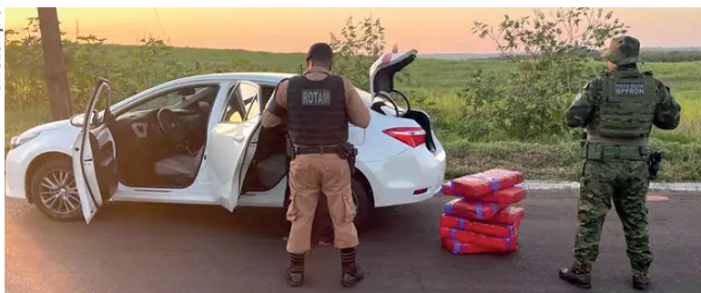
Policiais abordaram ocupantes de um Space Fox que seriam os batedores do veículo que estava logo atrás, o Toyota Corolla, que transportava a droga

Na manhã de ontem (sexta-feira, 21), por volta das 7h, no âmbito da Operação Fronteira e Divisas Integradas II/Hórus, as equipes realizam bloqueio no trevo que liga o distrito de Bernadelli ao município de Rondon. Os policiais viram dois veículos em velocidades incompatíveis com a prevista na via e realizando ultrapassagens por local proibido.