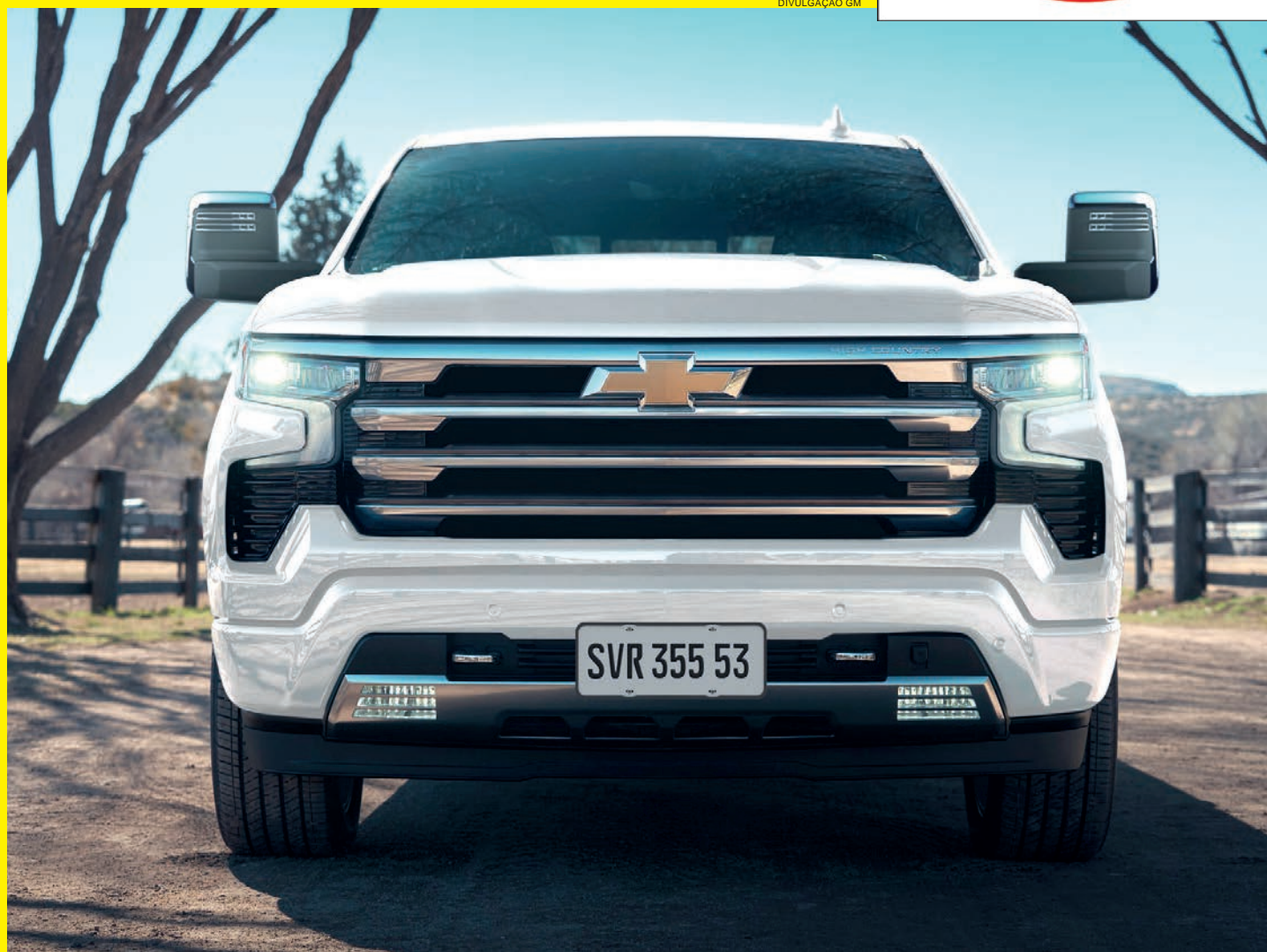
Picape grande da Chevrolet estreia até o fim do ano na versão High Country, numa configuração exclusiva para o Brasil