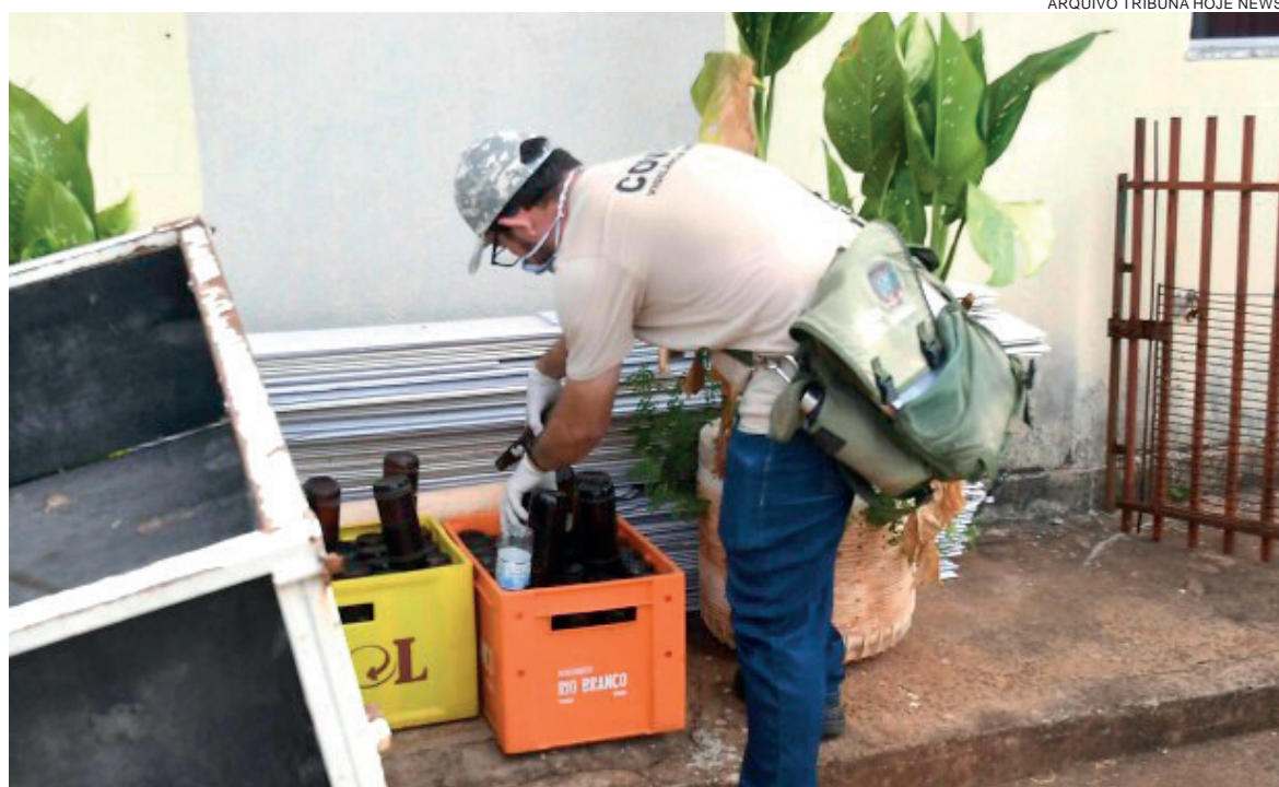
Parque das Jabuticabeiras é única região da cidade que não está classificada como ‘em surto’

As cinco regiões mais preocupantes – com o maior número de casos de dengue confirmados – são, pela ordem: 1) Bem-Estar, 2) Centro de Saúde Escola (Unipar sede), 3) Guarani-Anchieta, 4) Lisboa e Cidade Alta e 5) Vitória Régia e Central. “Com relação aos distritos, estão com bandeira vermelha