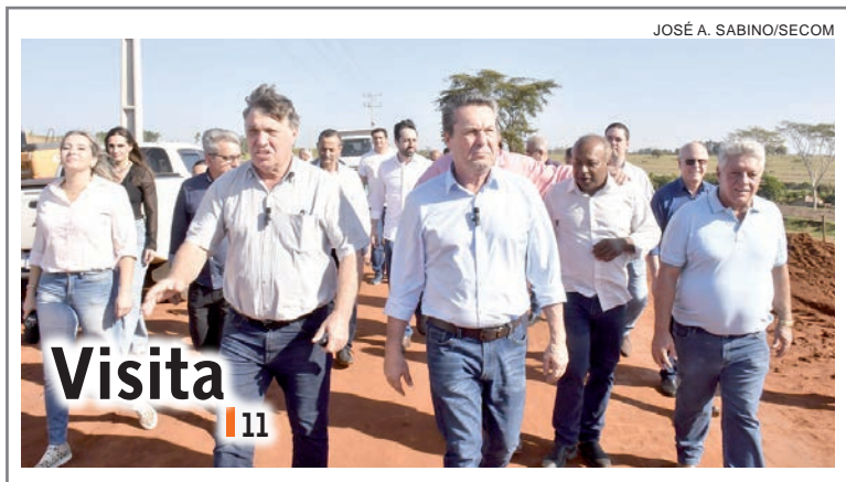
JOSÉ A. SABINO/SECOM