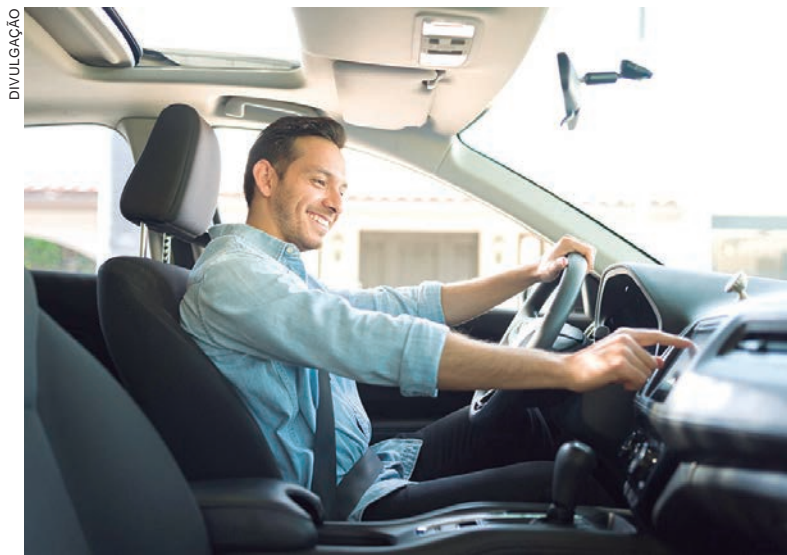
Ter paciência e cuidado com os veículos são primordiais para um trânsito mais seguro

Como os pneus são o único ponto de contato entre o veículo e o solo, desempenhando um papel crucial para a segurança e o conforto dos motoristas, a empresa se dedica fortemente em fornecer pro-