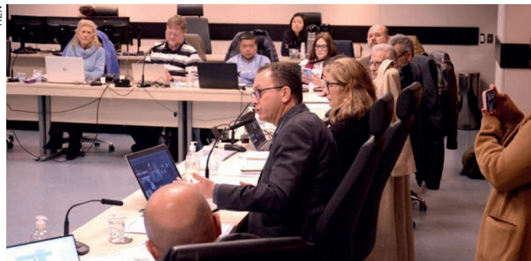
No encontro da Câmara Temática do Contran, a primeira temática foi sobre Engenharia e Sinalização de Trânsito

Nos encontros, especialistas representando órgãos e entidades do Sistema Nacional de Trânsito e de segmentos organizados da sociedade atuantes no trânsito de todo o País discutem políticas públi-