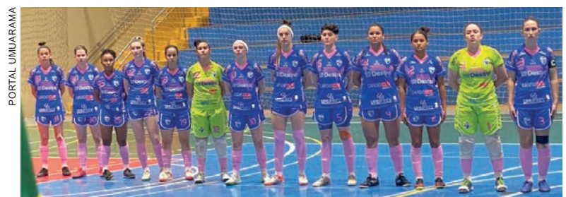
No próximo sábado (29), em jogo de seis pontos, o Umuarama recebe em casa e pode tomar o segundo lugar do Chopinzinho na tabela de classificação

O próximo jogo será importantíssimo para as pretensões do Umuarama Futsal Feminino. Às 19h de sábado (29), no Ginásio de Esportes Professor Amário Vieira da Costa, o time recebe o Chopinzinho em duelo de seis