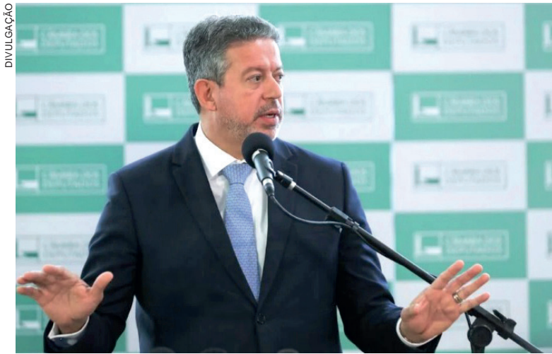
Lira disse ser necessário reduzir a quantidade de setores com alíquota diferenciadas na reforma

O deputado federal alagoano demonstrou desejo de que o Senado vote a reforma tributária no segundo semestre, para que a Câmara analise eventuais mudanças neste ano. Na visão dele, o fato de o texto aprovado na Casa ter trechos da PEC 110, apresentada pelo senador Davi Alcolumbre