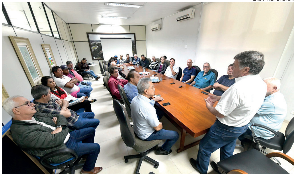
A reunião teve a presença de proprietários rurais que manifestaram interesse em uma parceria para a pavimentação, com extensão aproximada de 2,5 mil metros

Pozzobom disse que está buscando recursos por meio de emendas parlamentares e repasses do governo do Estado, além de avaliar uma participação maior com equipe e