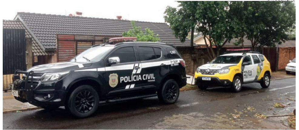
Ação conjunta identificou autores de tentativa de furto em agência bancária e levou outros dois comparsas à cadeia