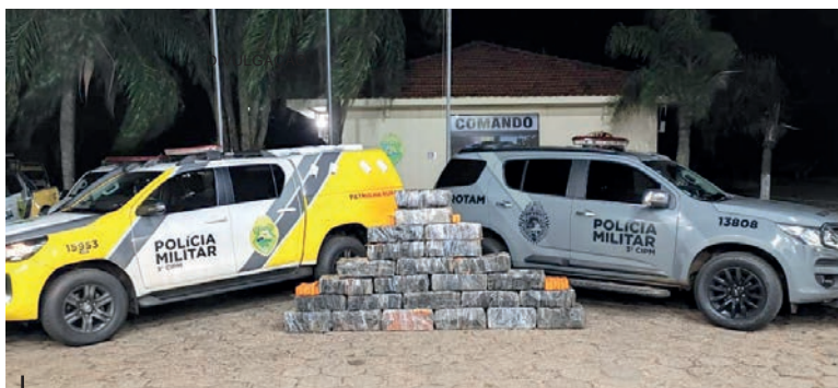
Drogas apreendidas em carro roubado foram levadas à Delegacia de Polícia de Loanda

As equipes da Rotam (Rondas Ostensivas), com o apoio da Patrulha Rural e da Rádio Patrulha entraram na ação e atuaram para recuperar o veículo, que estava em um local de difícil acesso. Foi necessário utilizar um guincho para retirá-lo.