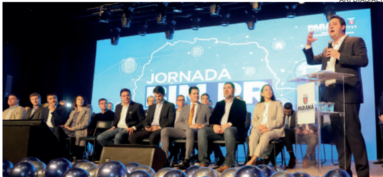
Tecnologia BIM, já aplicada nas obras do Estado, permite simulação virtual de projetos e será levado ao interior para capacitar técnicos das administrações municipais

“A ideia é poder colaborar com as prefeituras aplicando esta metodologia para fazer creches, escolas, postos de saúde, obras viárias, enfim, qualquer tipo de obra. Isso dá transparência aos projetos, porque ele reduz a chance de erros, que poderiam acabar paralisando ou encarecendo uma obra. Então é um