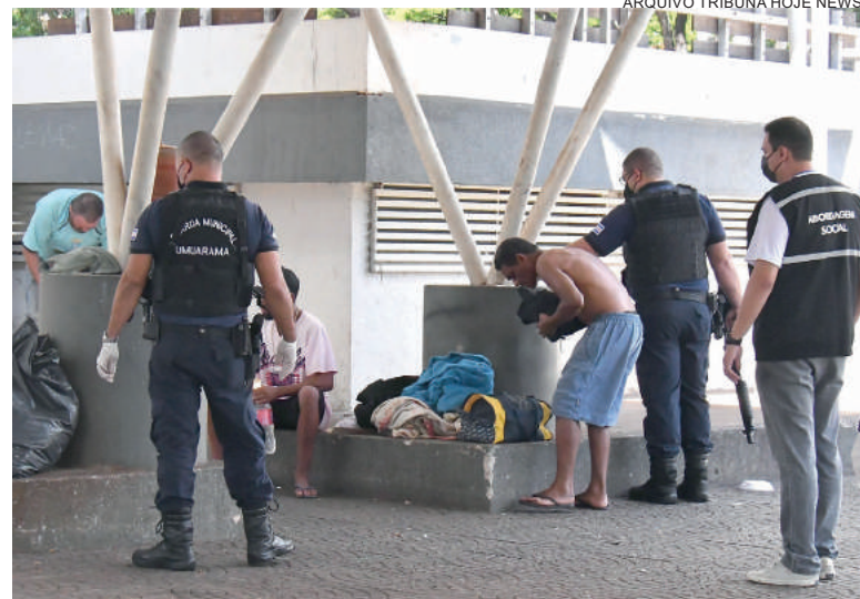
Ministros estabelecem prazo de 120 dias para que o Governo Federal prepare a implementação Política Nacional para a População em Situação de Rua

No fim de julho, o relator da ADPF, ministro Alexandre de Moraes, já havia votado pela observância da Política Nacional para a População em Situação de Rua, posição referendada pelo plenário. Contudo, de acordo com o coordenador do Núcleo dos Direitos Humanos e Cidadania