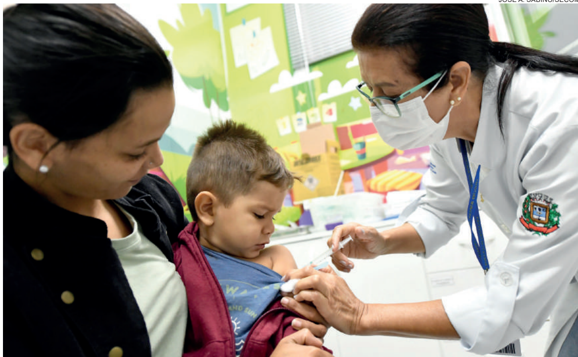
Ação da Secretaria de Saúde tem objetivo de oferecer mais tempo para que famílias levem seus filhos para serem imunizados

Desde que o Ministério da Saúde autorizou a imunização – e enviou doses especiais para o público infantil, Umuarama vacinou 12.738 crianças, sendo 580 na faixa etária de 6 meses a 2 anos, 881 com idade entre 3 e 4 anos, e 11.277 na faixa etária de 5 a 11 anos, segundo levantamento da Divisão de Vigilância Epidemiológica. “Até esta segunda-feira (21), 7.647 crianças tomaram a primeira dose