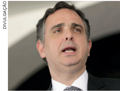
Presidente do Senado ressalta que todos tenham a mesma compreensão para alcançar a aprovação da reforma

Pacheco salienta que a disposição de ceder deve ser de todos os setores envolvidos. “Todos os municípios, os municípios grandes em relação aos pequenos, os pequenos em relação aos grandes, os estados federados, o Distrito Federal, a União, os setores de serviços, de comércio, agro, indústria. É muito importante