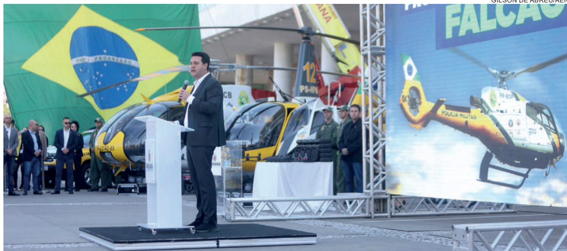
Estado fez a locação de duas novas aeronaves, que se juntam a outros dois helicópteros do BPMOA para a prevenção de crimes

Ele também citou queda recentes nos índices de criminalidade, como de 8,7% nos homicídios e 6,3% nos furtos no primeiro semestre de 2023, além da apreensão de 188 toneladas de maconha neste ano, o melhor número da história no combate ao tráfico e o crime organizado. “Estamos conseguindo atrelar força, preparo técnico, responsabilidade dos nossos profissionais, tecnologia e novos equipamentos. E quem ganha com isso é a sociedade paranaense”, afirmou Ratinho Junior.