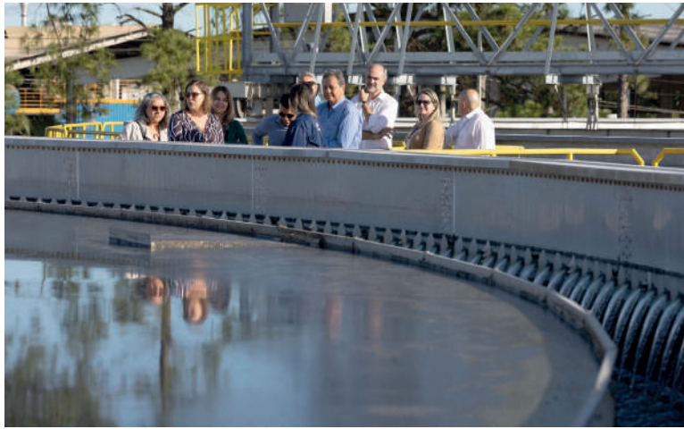
Durante a visita, a companhia apresentou projetos de biogás, lodo do esgoto e avanços tecnológicos aos diretores e técnicos da ANA