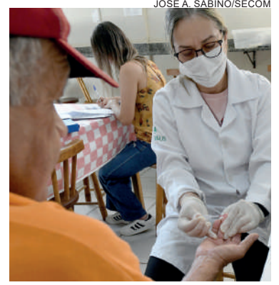
Ambulatório de Infectologia realizou testes rápidos de HIV, hepatites e sífilis em usuários do Albergue Apromo

como a pobreza extrema, os vínculos familiares interrompidos ou fragilizados e a inexistência de moradia convencional regular. "Eles utilizam os logradouros públicos como praças, calçadas e outras áreas para moradia e de sustento, de forma temporária ou permanente. O Centro Pop, assim como a Apromo, são as unidades de acolhimento para pernoite temporário ou como moradia provisória utilizadas por eles em Umuarama", observa.