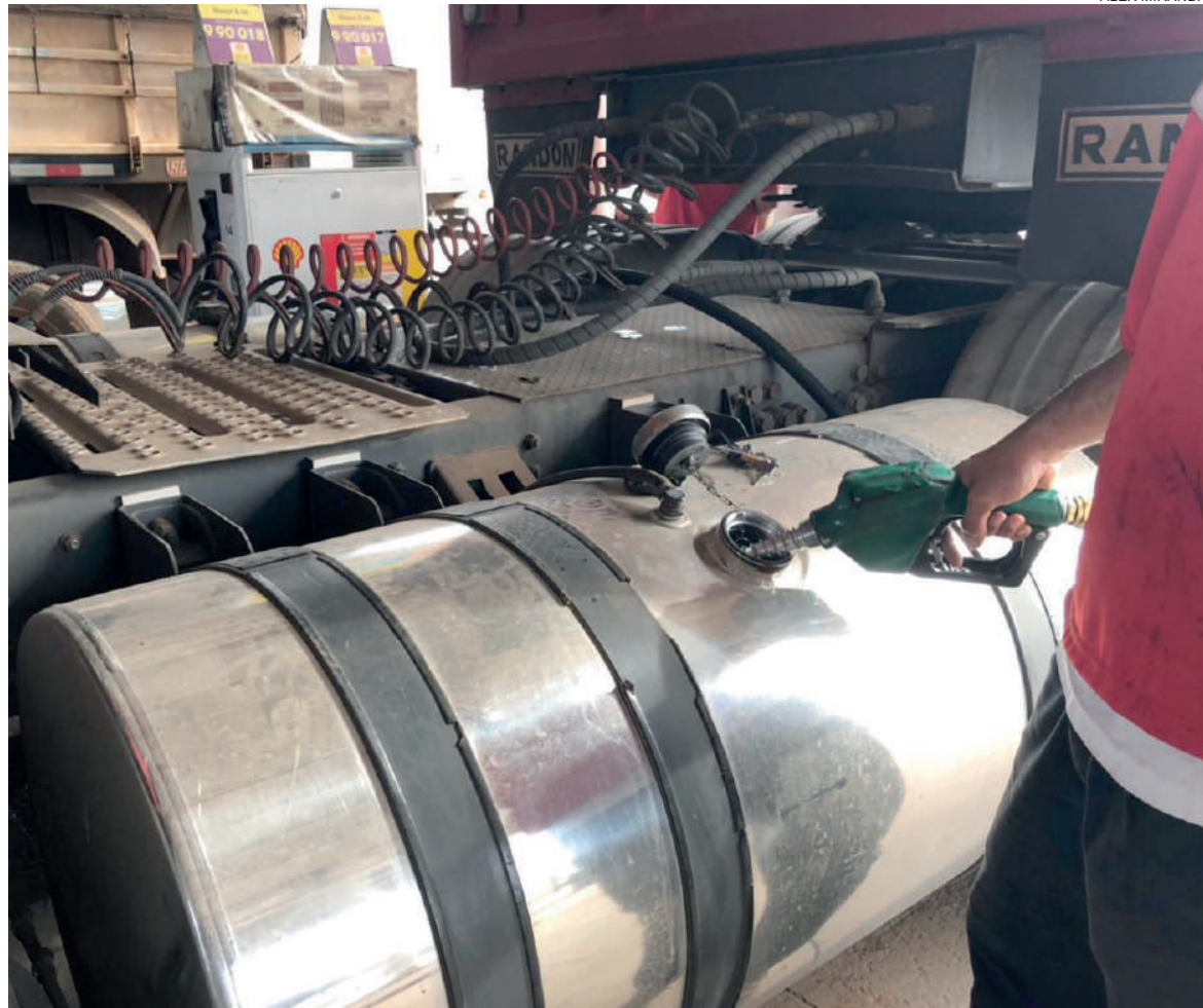
Segundo a política brasileira a respeito do tema, os preços dos combustíveis podem ser aumentados sem que a justiça determine ser algo ilegal

Comparsi acrescenta ainda que na fiscalização do setor de combustíveis, o Procon trabalha em conjunto com a ANP (Agência Nacional do Petróleo, Gás Natural e Biocombustíveis), com a Coordenação de Repressão aos Crimes Contra o Consumidor, a Propriedade Imaterial e a Fraudes (Corf), da Polícia Civil. “Temos, como órgão de defesa e proteção do consumidor, toda uma estrutura para atuação. E é por isso