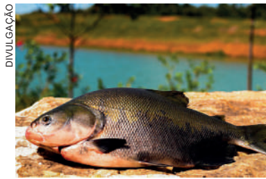
Semana especial visa ampliar ainda mais o consumo do produto no país

A perspectiva de descentralização vem sendo trabalhada nos últimos três anos. Gregolin observou que na semana deste ano, o objetivo é maior. “Além das capitais, a meta é o interior. Em todos os estados há coordenadores, e as superintendências do Ministério da Pesca estão trabalhando nos estados, bem como as entidades do setor. A ideia é fazer chegar o pescado