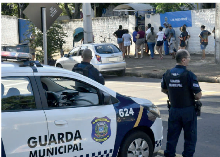
Cidade deixou de receber aproximadamente R$ 700 mil. Prazo foi perdido ainda na gestão Hermes Pimentel

Foram 13 municípios paranaenses que receberam recursos na semana passada: Londrina (R$ 988 mil); Araongas (R$ 399 mil); Toledo (R$ 988,8 mil); Curitiba (R$ 982,6 mil); Campo Largo (R$ 980 mil); Maringá (R$ 972 mil); Foz do Iguaçu (R$ 891,1 mil); Matinhos (R$ 759,2 mil); Sarandi (R$ 731,8 mil); Campina Grande