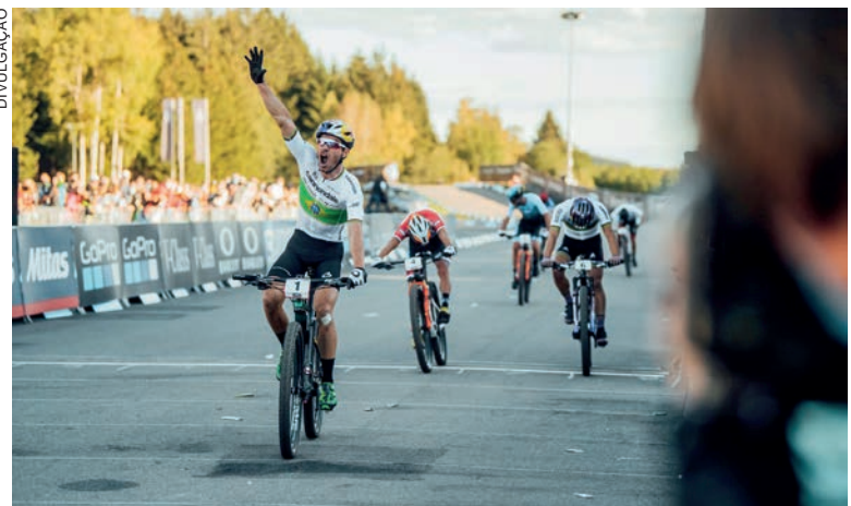
Ciclista conquistou dois títulos mundiais na maratona cross-country

“Três semanas antes do Mundial tive certeza de que voltaria de lá campeão e comecei a refletir sobre o que viria depois. Então tomei a decisão, sem falar para ninguém, que, se ganhasse, seria o suficiente. Porque se buscasse algo além disso, seria pelo meu ego. Então, se fosse campeão, seria o fim. Ainda é o que mais amo fazer na minha vida. É uma decisão difícil, não fico nem feliz nem triste, mas