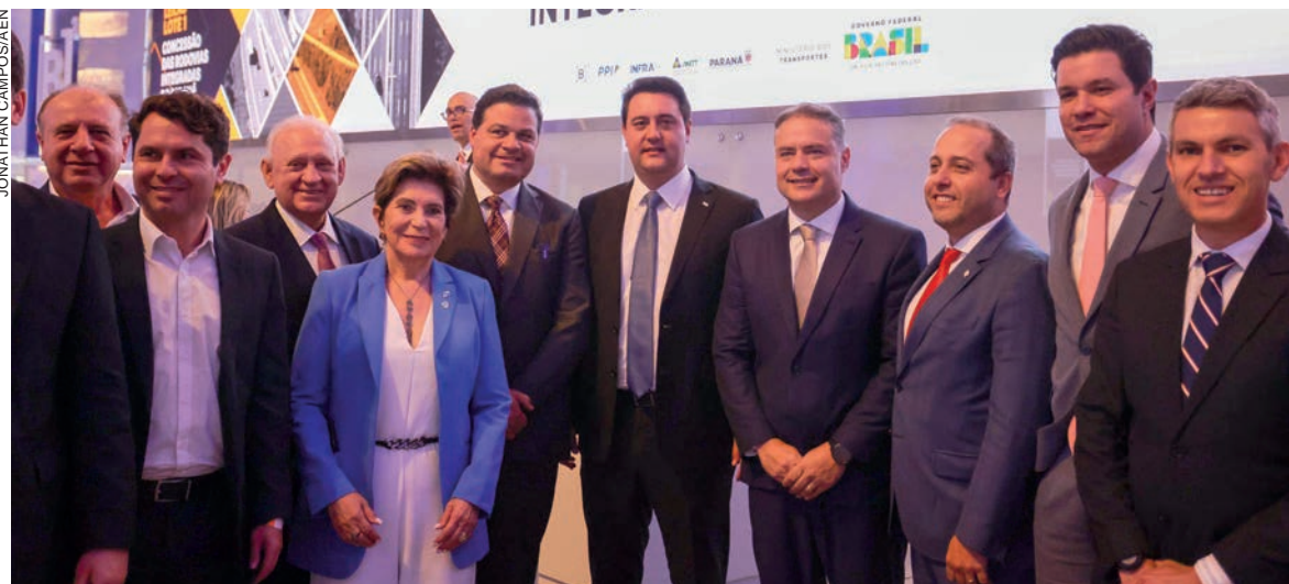
Todas as praças terão descontos de mais de 21,74% nas tarifas. Ao longo do período, a concessionária deverá investir cerca de R$ 7,9 bi em obras e R$ 5,2 bi em manutenção

O grupo vai administrar 473 quilômetros de rodovias fede-