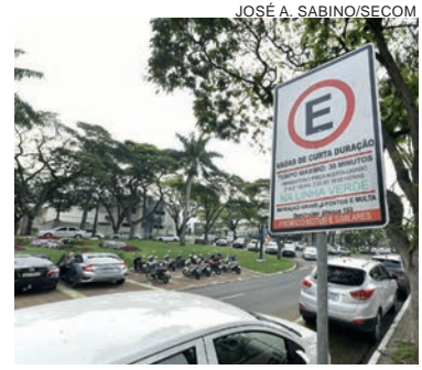
A regulamentação põe fim a uma dúvida de muitos motoristas, que era sobre a obrigatoriedade ou não do ‘pista alerta’ após as 18h e à noite

As vagas de curta duração foram uma opção adotada pelo município após o fim do estacionamento pago (antiga ‘zona azul’), até que um novo procedimento licitatório regulamentasse novamente a cobrança pelo uso das vagas em horário comercial, a fim de assegurar a rotatividade na utilização por parte dos motoristas.