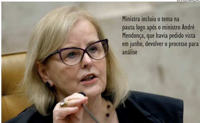
Ministra incluiu o tema na pauta logo após o ministro André Mendonça, que havia pedido vista em junho, devolver o processo para análise

Além disso, o ministro havia se comprometido a