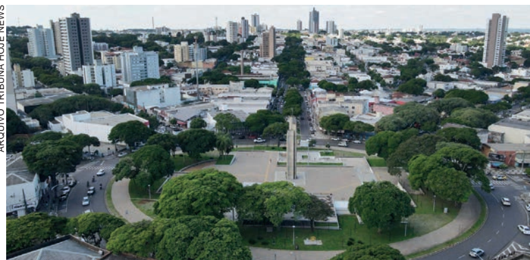
Umuarama entrou no ranking no 97º lugar, junto a outras 12 cidades listadas entre as 100 mais competitivas do Brasil

O Centro de Liderança Pública divulgou também o Ranking de Competitividade dos Estados, que colocou o Paraná como o terceiro mais compe-