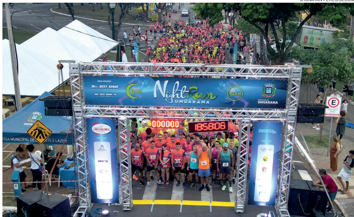
Secretário de Esportes do Município avaliou a corrida com um sucesso total, desde abertura das inscrições

“Gostaria de agradecer a todos os parceiros, pois sem eles não conseguiríamos fazer um evento tão grande”, afirmou Gaspar, destacando o apoio do Sest/Senat, Sorvetes Guri, Colégio Adventista, Sanepar, Bekus, Polícia Militar, Guarda Municipal