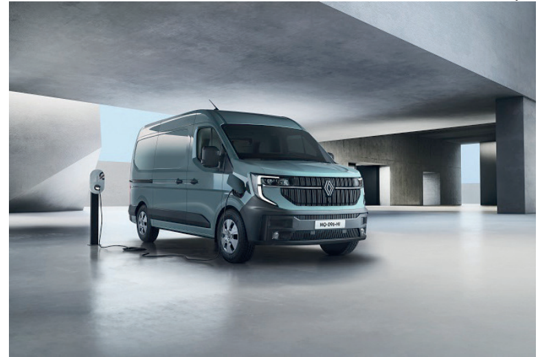
Comercializado a partir do segundo trimestre de 2024, o Novo Renault Master foi pensado para ir mais longe, carregar mais e gastar menos

Com um total de 135 litros, o volume de porta-objetos teve um aumento de 25%, o que faz desta geração a melhor neste quesito no mercado. Cada coisa tem seu lugar na cabine de Novo Renault Master, como os múltiplos espaços para guardar objetos no painel de bordo, porta-copos laterais, porta-luvas em formato gaveta, console de teto e dois níveis de porta-objetos