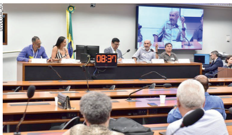
O texto analisado permite que as prefeituras implantem regras mais rigorosas se isso for necessário para solucionar seus déficits orçamentários

Os autores da PEC afirmam que até hoje apenas 31% dos municípios brasileiros implementaram seus próprios regimes previdenciários. Isso comprovaria o insucesso da