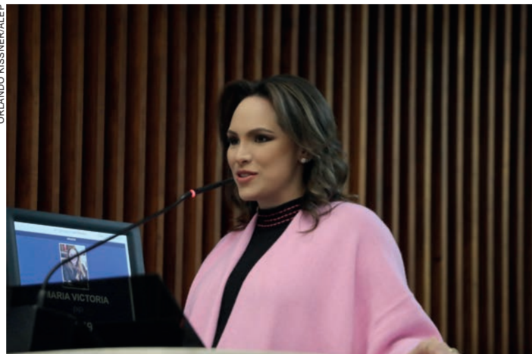
Segundo a deputada, a isenção do imposto estadual é uma estratégia para estimular o financiamento e a modernização das unidades que formam mão de obra

O Paraná possui o segundo e mais moderno pólo automotivo do Brasil, abriga montadoras e empresas multinacionais e nacionais que produzem carros, caminhões, vans, tratores e colheitadeiras.