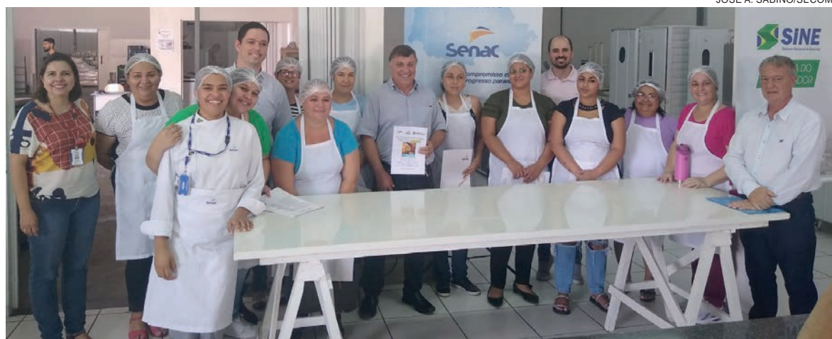
Os participantes conhecerão receitas de panetones, formas de apresentação e decoração dos produtos, embalagens, comercialização e cuidados com a conservação e o prazo de validade

“Os participantes conhecerão receitas de panetones