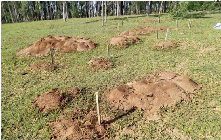
A ação envolve instruções sobre a identificação das espécies e práticas que podem ser adotadas para o enfrentamento do problema

A capacitação dos produtores foi feita com a realização de dias de campo, reuniões técnicas e oficinas. O extensionista detalha que nos treinamentos