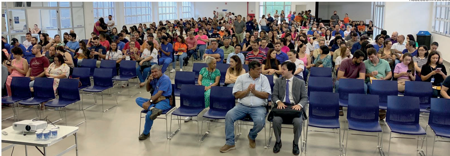
Evento, coordenado pela Diretoria de Recursos Humanos, trouxe alertas sobre chefes abusivos