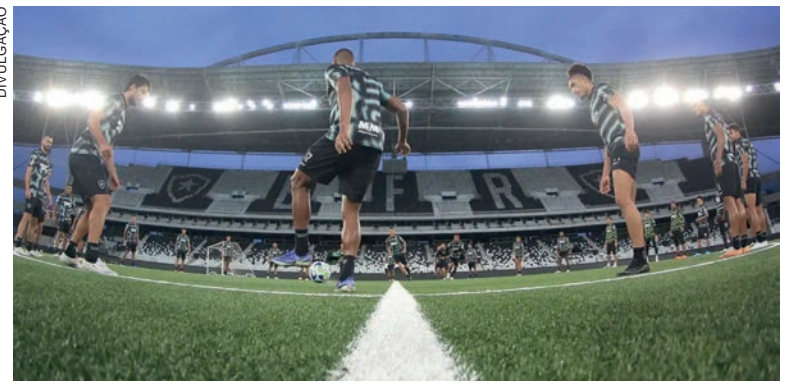
Durante onda de calor, campos sintéticos chegaram a 70º Celsius no Rio de Janeiro

O Maracanã adota a grama híbrida. Em tese, o campo possui 90% de gramado natural e 10% de fibras sintéticas, mas esse percentual varia de