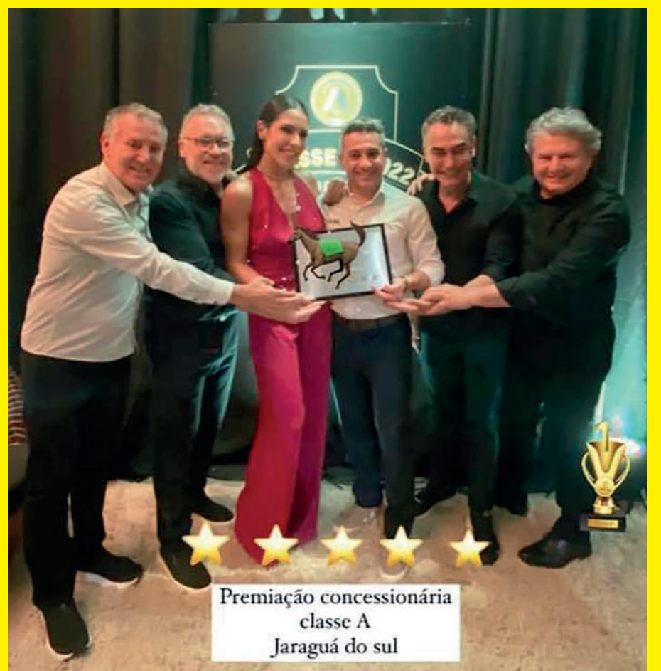
Premiação concessionária classe A Jaraguá do sul