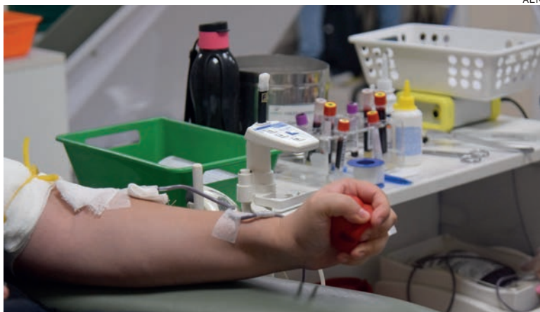
Diariamente, cerca de 700 bolsas de sangue são encaminhadas para hospitais para os mais diversos tipos de tratamento no Paraná. São mais de 21 mil bolsas por mês

“O Paraná é formado por pessoas solidárias. Este ano são mais de 156 mil doadores até agora e ao mesmo tempo já encaminhamos 253 mil bolsas de sangue para os hospitais, isso demonstra que o paranaense é solidário e gosta-