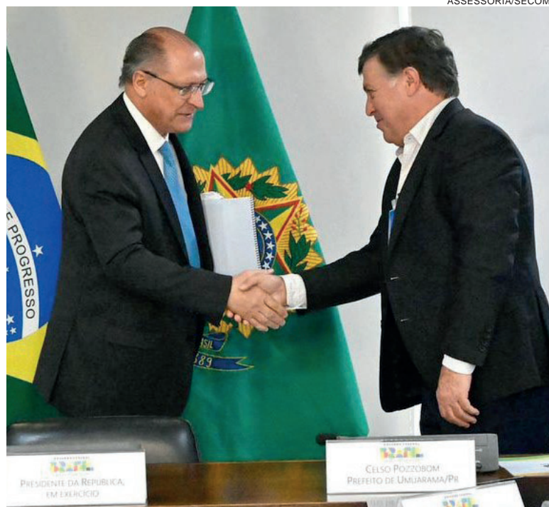
Pozzobom apresentou a Geraldo Alckmin o impacto no desenvolvimento da economia regional com a criação da ZPE de Umuarama

Pozzobom lembrou que, com o advento da ZPE, Umuarama ganhará um grande parque industrial para