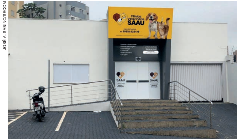
Animais de famílias cadastradas em programas sociais do governo federal terão prioridade

Ela acrescenta que toda a população de Umuarama também poderá levar seus animais para serem tratados pela equipe de profissionais da clínica. “Ofereceremos atendimento de segunda a sexta, das 8h30 às 17h30. Horários noturnos, finais de semana e feriados. atenderemos no sistema de plantão”, detalha a diretora.