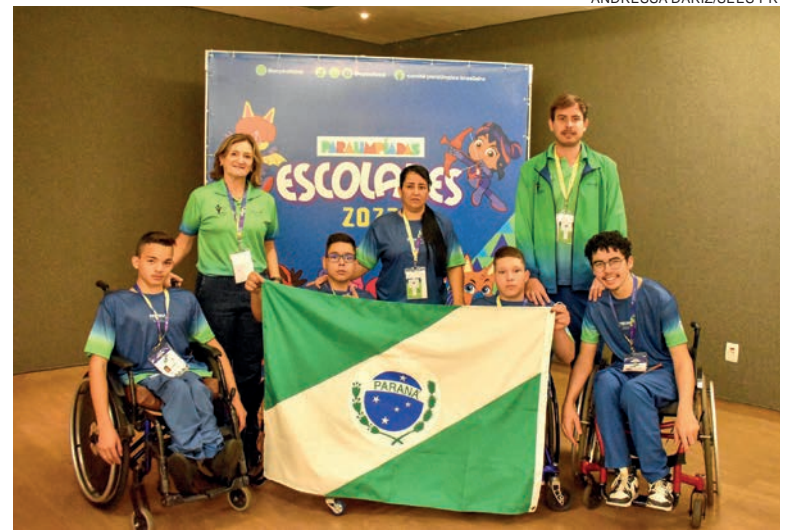
A delegação paranaense é integrada por cerca de 100 pessoas, entre atletas, comissão técnica e staff