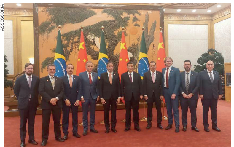
Comitiva chinesa visitará o Paraná, para avaliar frigoríficos aptos a venderem carnes de frango e de bovinos

Neste ano de 2023, já sob a nova Presidência da República,