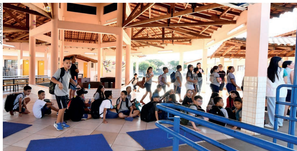
Os professores candidatos à direção das unidades educacionais passaram pelo processo de seleção com várias fases, que terminaram na terça-feira, 28

As etapas da escolha dos gestores tiveram inscrições (com solicitação formal) em setembro deste ano, avaliação de mérito e desempenho de caráter eliminatório – com formação de gestão escolar e aprovação em avaliação escrita de questões objetivas, subjetivas e análise de