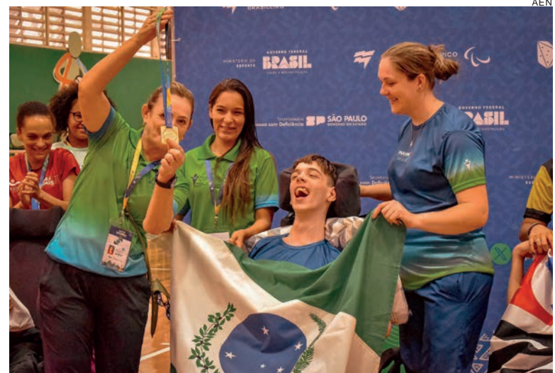
Foram 44 medalhas no total: além do ouro, a delegação trouxe outras 16 medalhas de prata e 13 medalhas de bronze

As Paralimpíadas Escolares tiveram a sua primeira edição em 2009. Talentos do paradesporto brasileiro já passaram pela competição, como os velocistas Alan Fonteles, ouro em Londres 2012, Verônica Hipólito, prata no Rio 2016, Petrúcio Ferreira, recordista mundial nos 100m (classe T47), o nadador Talisson Glock, prata no Rio 2016, o jogador de goalball Leomon Moreno, prata no Jogos de Londres e bronze no Rio 2016, a mesatecnista Bruna Alexandre, bronze no Rio 2016, entre outros.