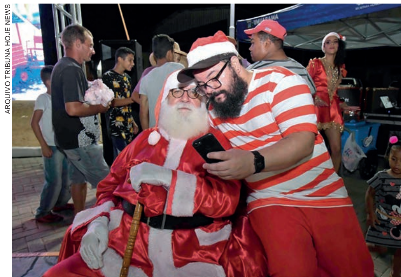
Festividades começam pelos distritos e chegada do Papai Noel será na quarta-feira da próxima semana

A partir desta data, a Casinha do Papai Noel da Praça Miguel Rossafa abre as portas para que as famílias possam visitar. Já na Praça Santos Dumont tem início a Praça de Alimentação, a Feira de Artesanato e o funcionamento do parque infantil, com brinquedos pagos. "Entre os dias 14 e