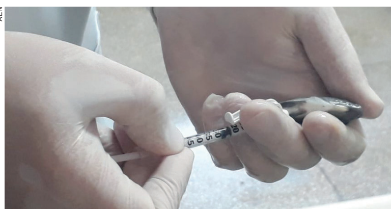
Do investimento de R$ 500 mil, metade é do Fundo Paraná, em dotação de fomento científico e tecnológico

A iniciativa acadêmica envolve recursos da ordem de R$ 500 mil, sendo R$ 250 mil do Fundo Paraná, dotação de fomento científico e tecnológico administrado pela Secretaria da Ciência, Tecnologia e Ensino Superior (Seti). Os recursos serão destinados para