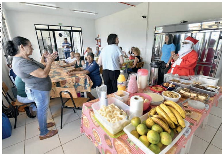
As atividades devem retornar em meados de fevereiro de 2024. Ontem (4), dois grupos se reuniram com o Papai Noel

Os grupos do Serviço de Convivência e Fortalecimento de Vínculos para Idosos (SCFVI), da Secretaria de Assistência Social da Prefeitura, estão encerrando as atividades do ano com encontros e confraternização. São momentos de lazer com café da manhã e brincadeiras, como o tradicional ‘amigo-secreto’, além da avaliação das ações realizadas ao longo do ano e da coleta de sugestões para o planejamento do próximo período.