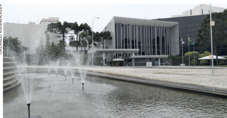
Os cargos do processo seletivo serão definidos pela Comissão Especial formada por servidores para estudar os detalhes do concurso

pertise em planejamento e execução de concursos em todas as fases e etapas. Segundo Traiano, o concurso visa recompor os quadros do legislativo com a aposentadoria de funcionários