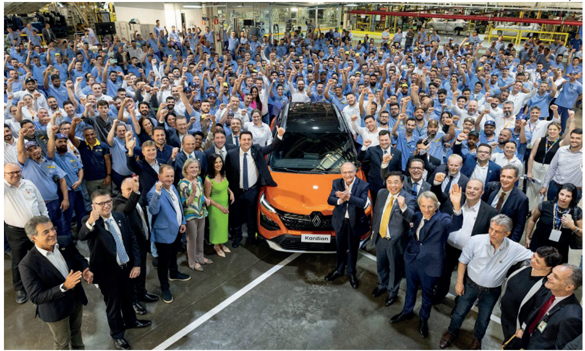
Com a presença do presidente em exercício Geraldo Alckimin, a Renault anuncia investimentos de R$ 2 bi para produzir um novo C-SUV no Paraná

Para este ciclo de investimento, foram muito importan-