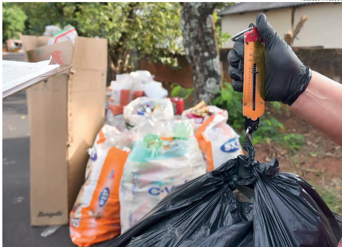
Serão entregues novas carteirinhas para quem renovou o cadastro para 2024