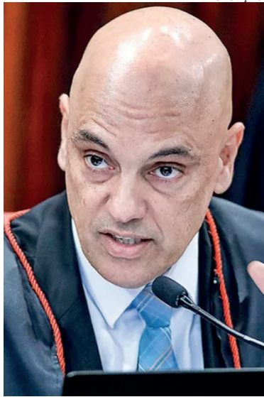
Para Alexandre de Moraes, a “utilização maléfica” das plataformas é feita por regimes autoritários de extrema-direita

Moraes avalia que, em 2022, houve “um sucesso maior”, mas considera que é necessário “se preparar para uma nova etapa no combate a