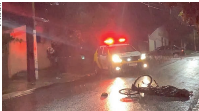
Homem executado estava de bicicleta. É morador no Parque das Jaboticabeiras e é suspeito de ter praticado vários furtos em Umuarama

A chuva forte no momento do ocorrido também pode ter prejudicado os trabalhos da perícia. Ainda segundo os policiais militares, a vítima é suspeita de ter praticado vários furtos em Umuarama, fator que foi repassado à Polícia Civil.