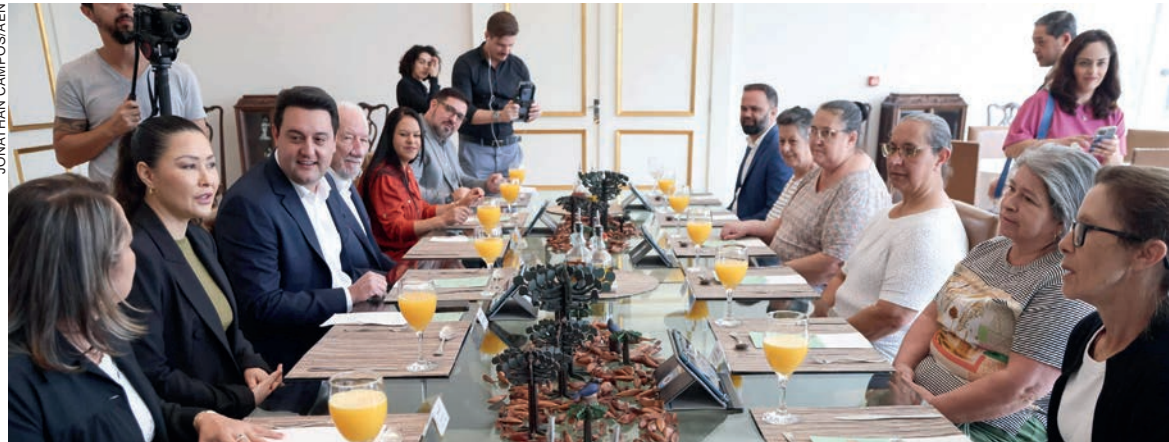
Projeto encaminhado à Alep prevê aumento dos salários de até 139% e simplificação do quadro. Medida impacta cerca de 15 mil merendeiros e zeladores

O governador Ratinho Junior anunciou ontem (11) que o Estado vai encaminhar para a Assembleia Legislativa um projeto de lei que reestrutura as carreiras e os vencimentos dos agentes educacionais que compõem o Quadro de Funcionários da Educação Básica (QFEB).