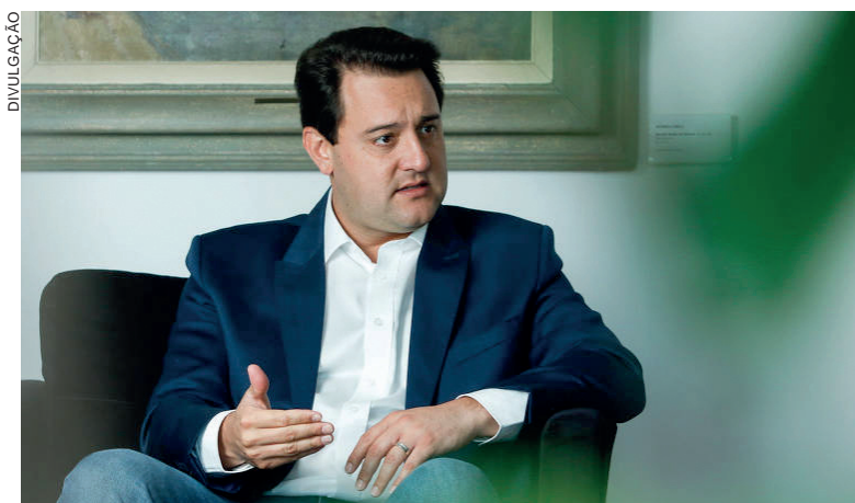
Ao se referir ao governador do Paraná, a quem pretendia lançar para concorrer à Presidência em 2026, Kassab disse que “ele chegará forte em 2030”

Ao se referir ao governador do Paraná, Ratinho Jr., a quem pretendia lançar para concorrer à Presidência em 2026, Kassab disse que “ele chegará