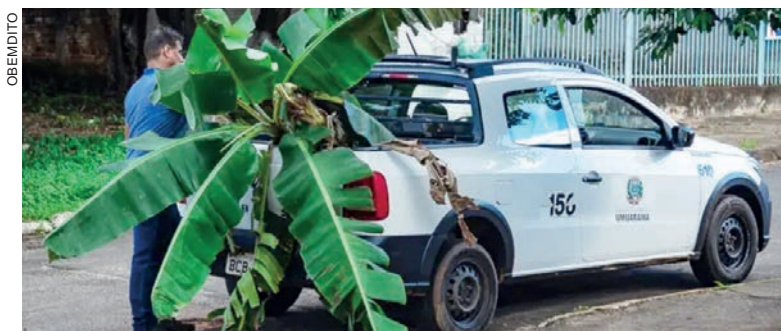
A Prefeitura afirma que já foi determinada a execução do serviço de tapa-buraco e que o conserto deverá ser feito hoje

terça-feira (11). “Vai ser manutenção normal (tapa-buraco) como está sendo feita em toda a cidade, por conta do excesso de chuvas. Acredito que até amanhã estará regularizado”. (Colaboração – OBemdito)