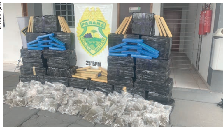
Droga apreendida estava dentro de um Duster abandonado nas proximidades do distrito de Lovat

o veículo quanto a substância ilícita, foram encaminhados para a Delegacia de Polícia de Umuarama a fim de dar continuidade aos procedimentos pertinentes à polícia judiciária.