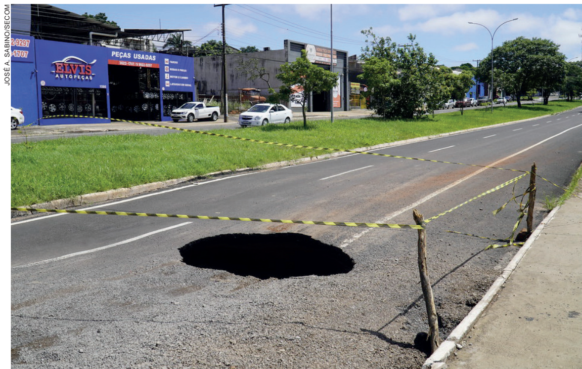
Cratera aberta no meio da pista assustou motoristas que passaram pelo local. Nenhum acidente foi registrado

No caso da Parigot de Souza foi necessária a interdição total do trecho, entre a