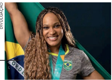
Evento premiou quem se destacou nos Jogos Pan e Parapan-americanos

artística, ganhou na categoria Participação de Destaque, para atletas que tiveram grande desempenho dentro e fora do esporte