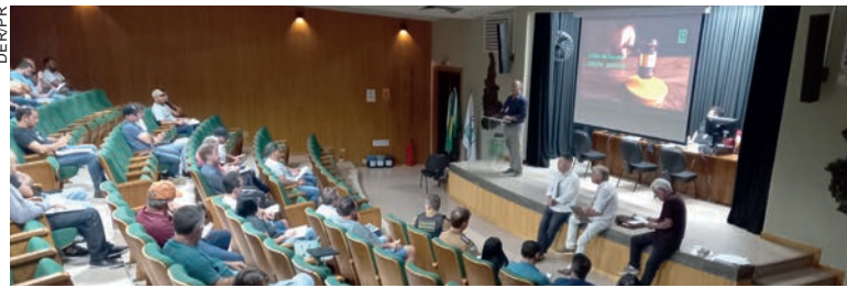
Ao todo participaram 39 empresas do ramo de desmontagem de veículos, com o valor final de venda atingindo a marca de R$ 1.020.200,00

São automóveis, motocicletas, caminhões e rebocues, abandonados na faixa de domínio de rodovias estaduais geralmente devido a acidentes ou panes, recolhidos a pátios do próprio departamento ou do Batalhão de Polícia Rodoviária (BPRv) e não retirados