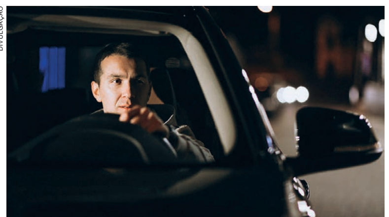
Muitas pessoas desconhecem que, em algumas situações, é possível substituir uma multa de trânsito por uma advertência por escrito

Caso aconteça a infração, é possível recorrer e isso pode ficar mais fácil com a contratação de um serviço especializado. “Um profissional garante soluções ágeis para recorrer, já que possui eficácia em elaborar uma defesa administrativa, com os documentos necessários a serem apresentados aos Órgãos de Trânsito. Esse auxí-