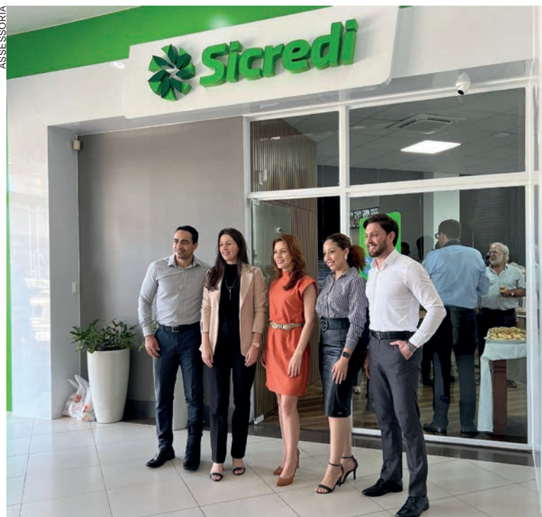
Espaço anexo ao Supermercado Big Planalto vai oferecer todos os produtos e serviços da instituição financeira cooperativa

“O Sicredi está sempre junto aos municípios, com a presença das agências e com as ações que realizamos para fomentar a economia local. Para nós é uma alegria inaugurar mais esse empreendimento em Umuarama, com um atendimento humanizado e transparente. A satisfação dos associados movimenta o nosso propósito de construir juntos uma sociedade mais próspera”, reforça o diretor executivo da Sicredi Vale do Piquiri