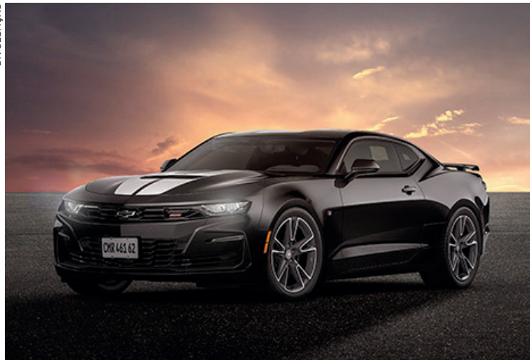
Série é limitada a 125 unidades numeradas que serão entregues a partir da virada do ano

Apesar de a Chevrolet não ter anunciado um sucessor imediato, este não é o fim da