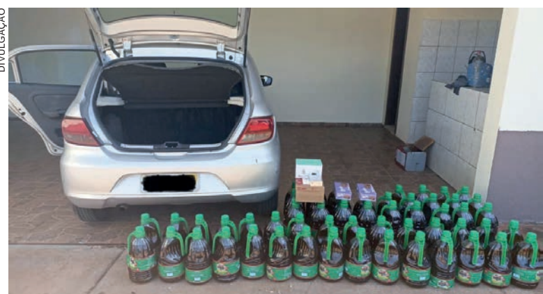
Mercadoria foi apreendida e levada junto com o carro à Receita Federal em Guaíra. Motorista foi ouvido e liberado

Diante, do fato, o Gol com as mercadorias ilícitas, foi apreendido e encaminhado à Receita Federal de Guaíra, já o condutor, de 37 anos de idade, foi devidamente qualificado e liberado.