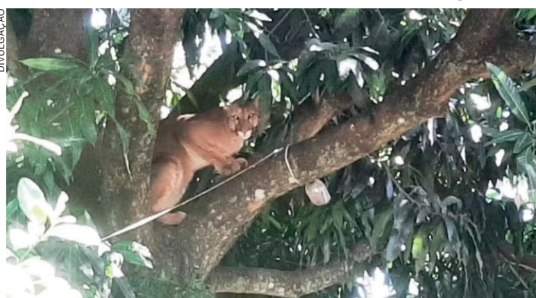
Onça parda de 45 quilos foi capturada no início da tarde de ontem e depois levada para uma reserva para tratamento a adaptação

Vídeos feitos por vizinhos que acompanharam o resgate do bicho mostram o animal adormecido sendo transportado por um médico veterinário especializado até a viatura da Polícia Ambiental – Força Verde. Além da Polícia Ambiental, a operação de resgate também contou com a partici-