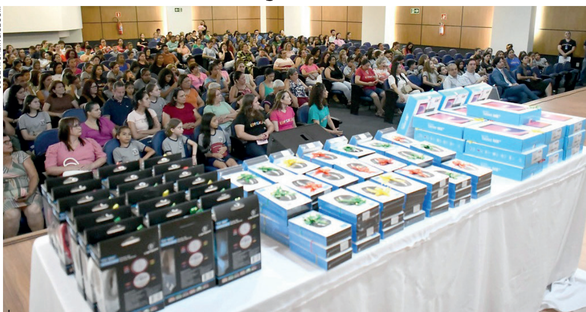
Cerca de 1070 alunos produziram redações para conscientização sobre a erradicação do trabalho infantil. Os três melhores trabalhos de cada turma foram premiados