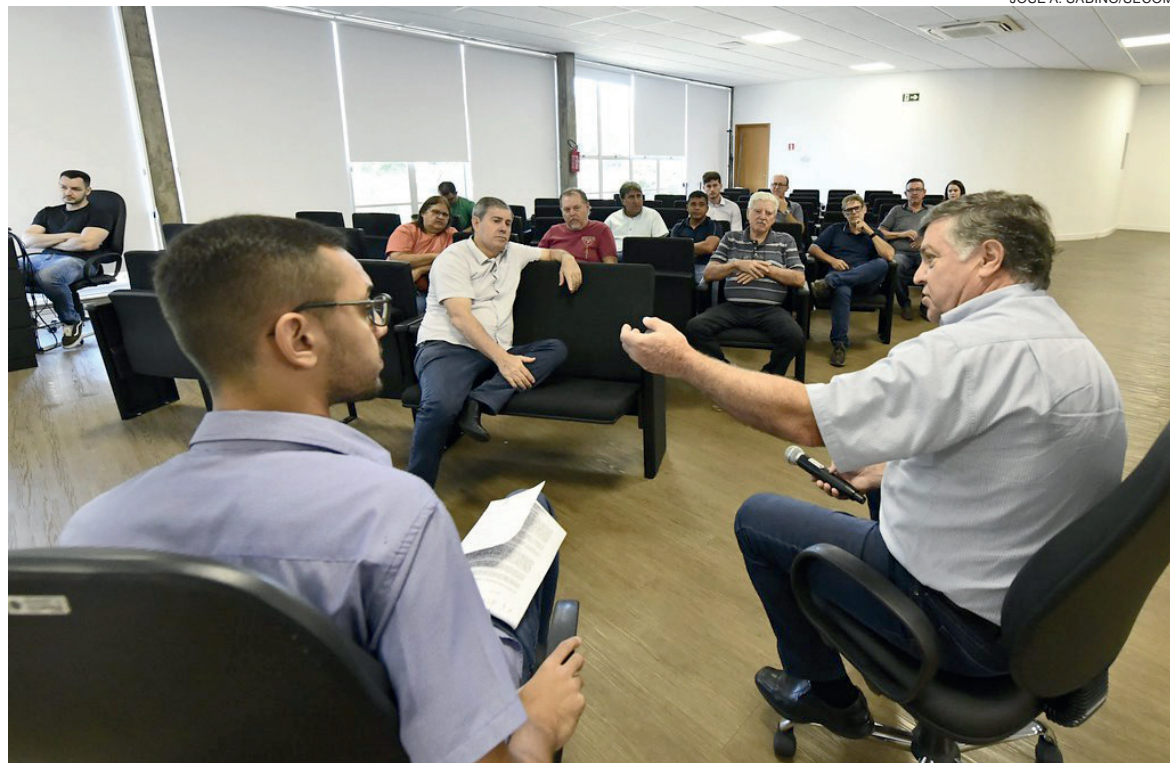
Boa parte dos recursos depende da liberação de emendas ao Orçamento da União, aprovadas por deputados federais, o que não ocorreu ainda por parte do governo federal

O prefeito esteve pessoalmente em Brasília, consultando ministérios e assessorias dos deputados que destinaram recursos a Umuarama, neste ano, e pediu apoio para que o dinheiro seja destravado junto ao governo. “Acredito que, pelo menos, uma das emendas tem a chance de sair nas próximas semanas, mas não é certeza. Por isso precisamos