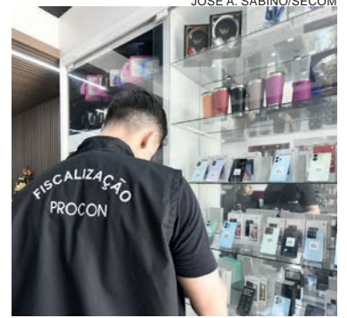
Os empresários estão recebendo uma Recomendação Administrativa e têm prazo de cinco dias para corrigir as irregularidades, sob a pena de instauração de processo

O advogado frisa que o cliente não pode ter dúvidas. "Além de cumprir a legislação, o comerciante garante um direito do consumidor. A orientação dos fiscais é que a lei seja respeitada de imediato".