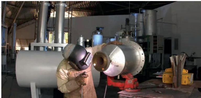
Consumo das famílias terá crescimento de 2,6%, prevê a Confederação Nacional

Em 2023, a entidade aponta que o consumo das famílias terá um crescimento de 2,6% e que