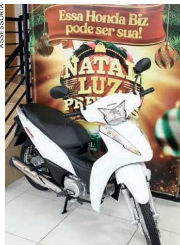
Esta será a primeira de oito motos Honda Biz que serão sorteadas dentro da campanha de Natal da Aciu

A Campanha, considerada uma das maiores do Estado, tem apoio do Sicoob Arenito, como patrocinador master, Fuji-Moto Honda e Conselho da Mulher Empresária e Executiva. São mais de 200 empresas de Umuarama e região participantes e que todos podem conferir no site da associação. Dia 22 será sorteada mais uma Honda Biz e dia 29, outras seis motocicletas.