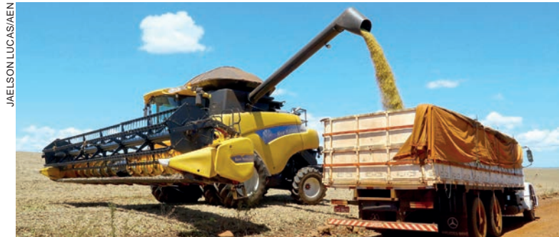
Em 2022 foram exportadas 8,9 milhões de toneladas de soja. Este ano, 14,7 milhões. Em recursos, saltou de US$ 5,5 bilhões para US$ 7,9 bilhões

“O ano de 2023 foi de recuperação do grande desastre de 2022, em razão da estiagem, quando o Paraná perdeu mais de R$ 31 bilhões na produção agrícola”, ponderou o secretário de Estado da Agricultura e do Abastecimento, Norberto Ortigara. “Somente em grãos, a safra 22/23 chegou a mais de 45 milhões de toneladas.