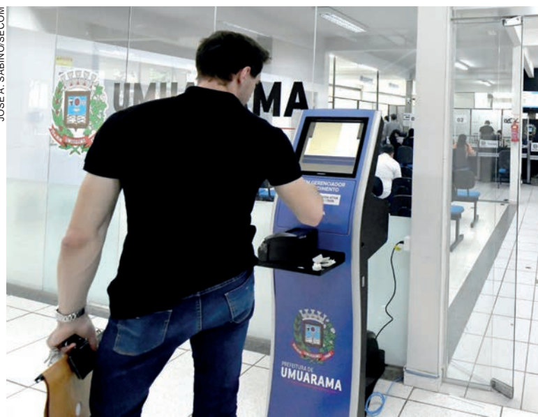
Adesão ao programa de anistia trouxe bons resultados à administração municipal

Para adesão ao programa, o contribuinte deverá apresentar comprovante de endereço, CPF e RG do titular do cadastro (se pessoa física), ou documentos pessoais do sócio-administrador e contrato social/estatuto (se pessoa jurídica). “A adesão ao Refis deve ser feita na Divisão de Dívida Ativa e pode ser que, dependendo do caso, outros documentos poderão ser exigidos pela Secretaria da