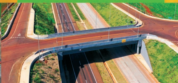
Duplicação Contorno Oeste de Cascavel