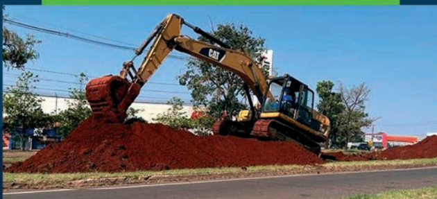
Trevo Catuaí, em Maringá