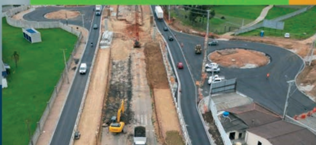
Viaduto Bradesco, em São José dos Pinhais