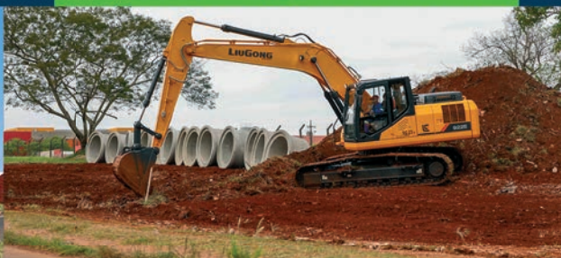
Viaduto PUC, em Londrina