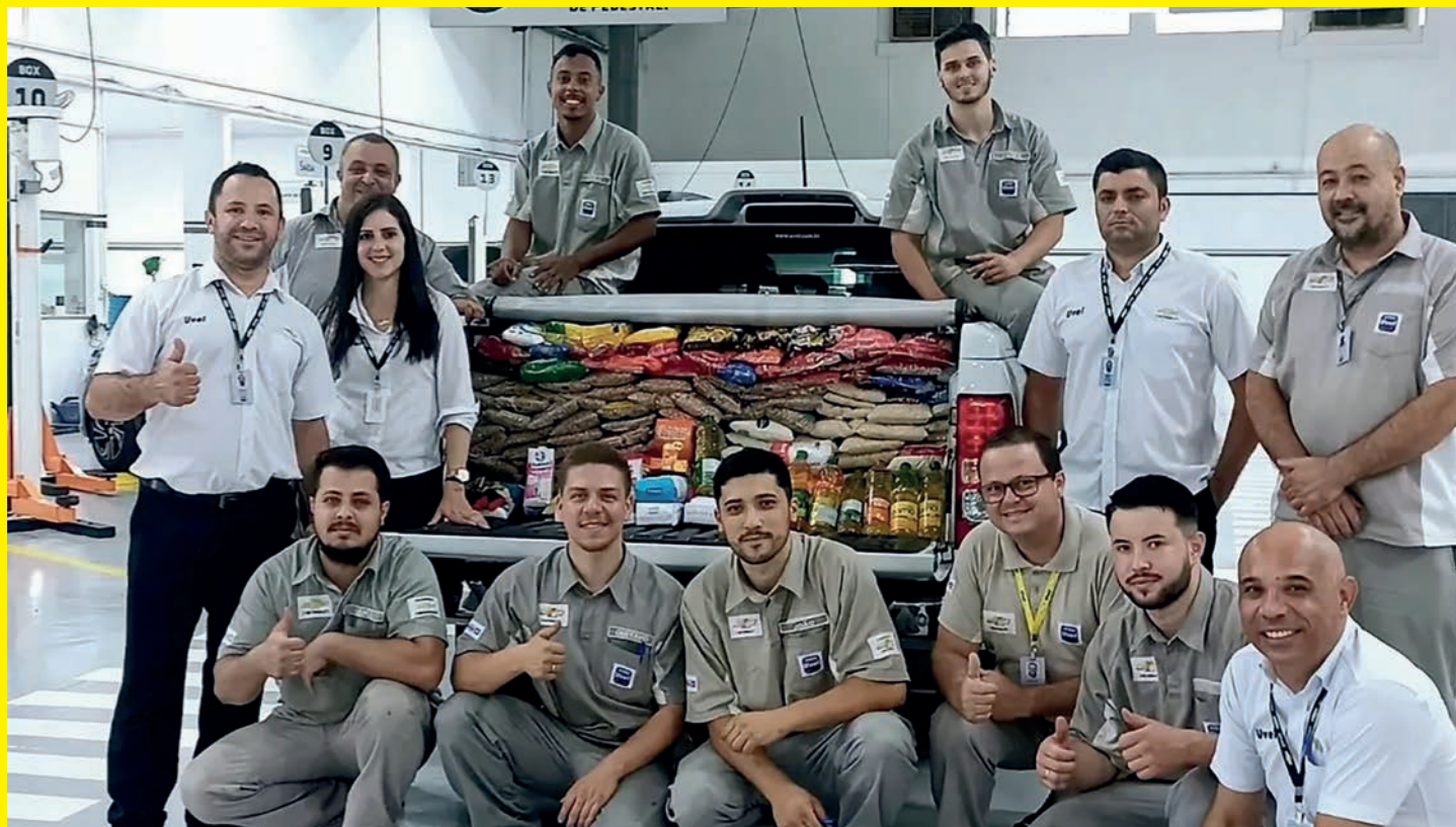
Comemorando a Campanha de Arrecadação de Alimentos, em Umuarama / PR

A Aciu faz nesta sexta, 15, às 9h, o primeiro sorteio de uma das oito motos Honda Biz da campanha ‘Natal de Luz e Prêmios’. Milhares de cupons já distribuídos e preenchidos pelas lojas participantes estão nas urnas para o grande momento. O próximo sorteio será no dia 22. Entre os prêmios, a campanha também está oferecendo vales-compra [de 100, 200 e 500 reais], sorteadas pelas famosas ‘seladinhos’.