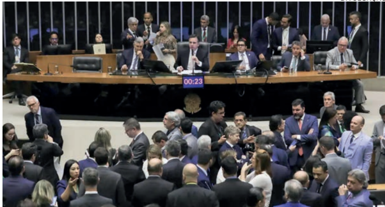
Medida havia sido vetada por Lula por ser considerada inconstitucional. Petistas apontaram que derrubada é uma afronta ao governo

A derrubada do veto foi defendida pelo presidente do Congresso Nacional, o senador Rodrigo Pacheco (PSD-MG), que afirmou que a medida pode evitar a demissão dentro dos setores beneficiados.