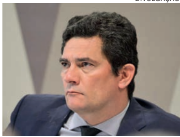
A argumentação do PT e do PL, é de que Moro teria cometido abuso de poder econômico durante sua pré-campanha para as eleições gerais de 2022

“Diante de todo o expedito neste parecer, somente baseado no que consta dos autos, a Procuradoria Regional Eleitoral no Paraná manifesta-se pelo julgamento de procedência parcial dos pedidos formulados nas Ações de Investigação Judicial Eleitoral, a fim de que se reconheça a prática de abuso do poder econômico, com a consequente cassação da chapa eleita para