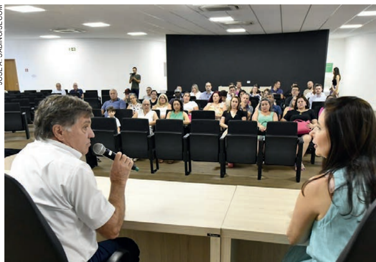
Cerimônia é organizada pelo Fundo de Previdência Municipal de Umuarama todos os anos

Também participaram do evento em homenagem aos