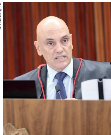
O magistrado defendeu que os acusados pela Procuradoria-Geral da República peguem penas de 14 a 17 anos de prisão

Apesar de a Corte ter decidido que as ações penais em trâmite no STF voltarão a ser julgadas pelas Turmas do Tribunal, a análise dos 30 processos já pautados se dará no