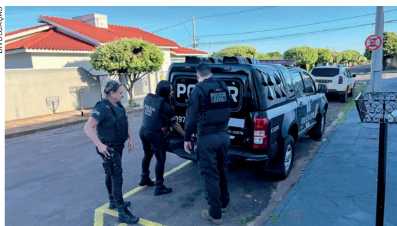
Dois homens suspeitos de participarem de um homicídio na cidade foram detidos. Uma arma foi encontrada e apreendida

Ainda conforme Janaína, assim que foram finalizados os procedimentos no final da tarde de ontem na Delegacia de Goioerê, os suspeitos foram conduzidos colocados na Cadeia Pública da cidade, onde permanecem agora à disposição da Justiça.