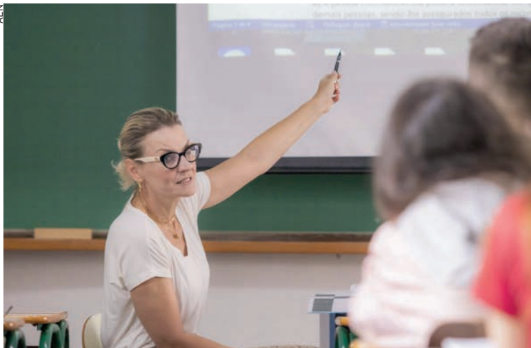
Os docentes com doutorado e mestrado passam a receber 105% e 60%, respectivamente, como adicional por titulação