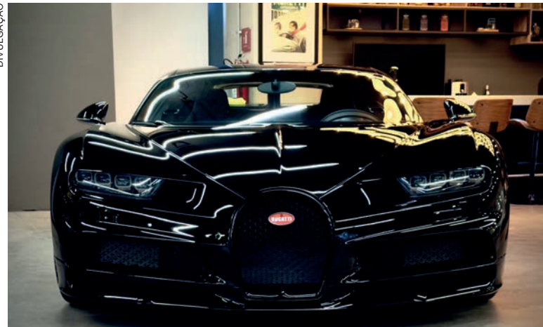
Bugatti busca expandir sua rede de distribuidores, agora na América Latina, iniciando sua colaboração com a Grand Chelem no México

No mercado automotivo de alto desempenho na América Latina, o México tem se destacado como líder na região, devido à sua notável quantidade de supercarros e à paixão que os envolve.