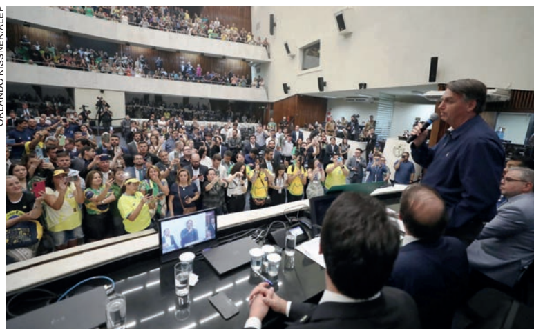
De autoria parlamentar, proposta reconhece o trabalho desenvolvido pelo homenageado e sua contribuição com o Estado.

Durante o discurso, Bolsonaro pontuou uma série de conquistas de seu governo. Além disso, fez uma análise do presente momento político do País. Ele também destacou a honra de receber a homenagem. “Aprendemos a amar novamente a nossa bandeira, a cantar o Hino Nacional, a voltar a ter orgulho da família, da pátria e de Deus. Entendemos que a liberdade não é uma cláusula pétrea. Ela é algo que precisa