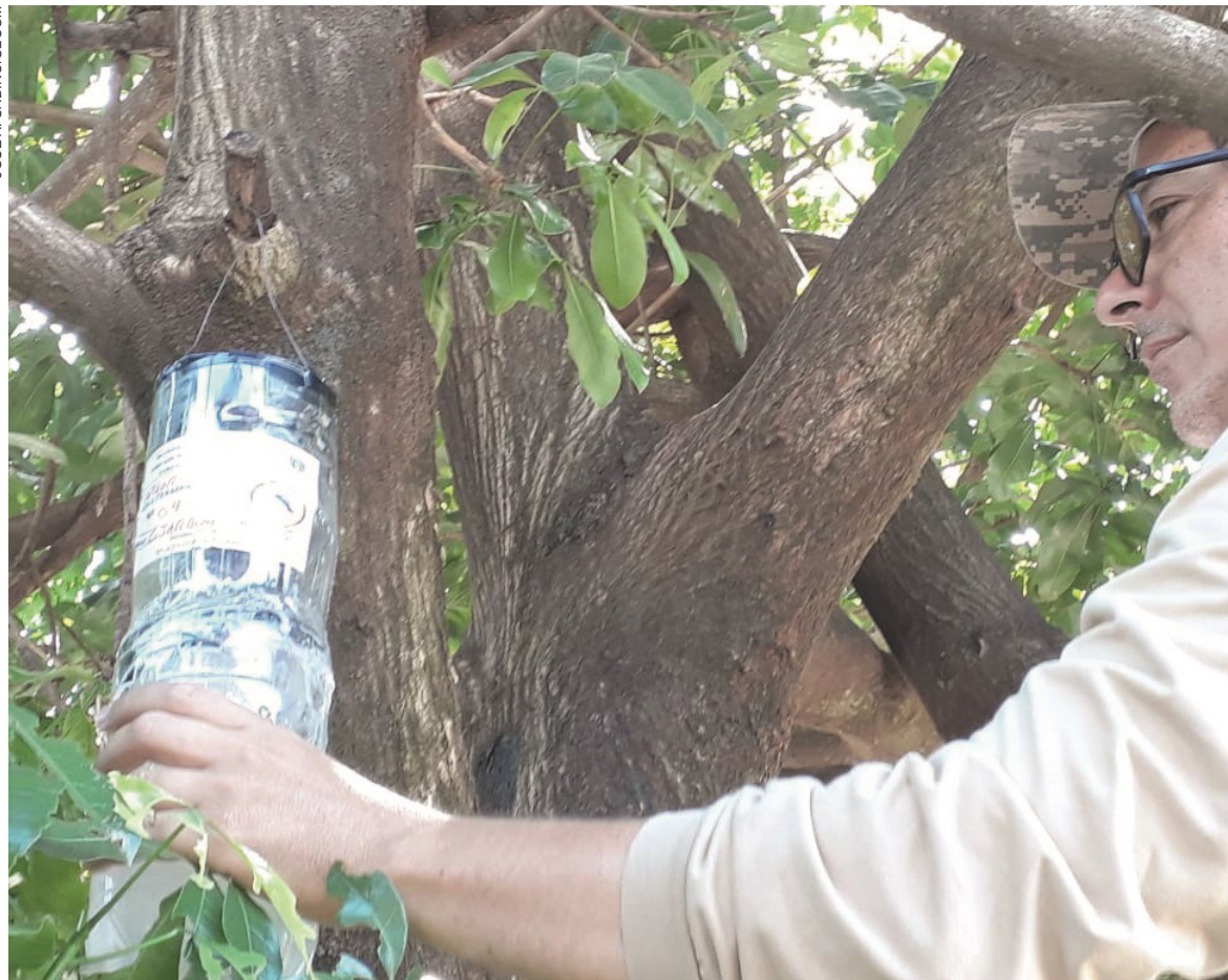
As armadilhas para captura do mosquito em sua fase adulta, chamadas de ‘adultrampas’, estão sendo espalhadas em diversos pontos da cidade

No atual período de acompanhamento, iniciado em 30 de julho, Umuarama já registrou 500 notificações, das quais 436 suspeitas foram descartadas, e há ainda 40 em investigação – que podem