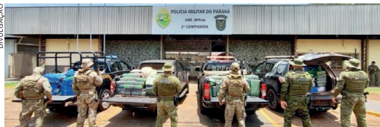
Os fardos de maconha estavam escondidos embaixo de galhos e cobertos por lonas

A ação integrada aconteceu durante um patrulhamento pelas áreas rurais do município, onde as equipes encontraram,