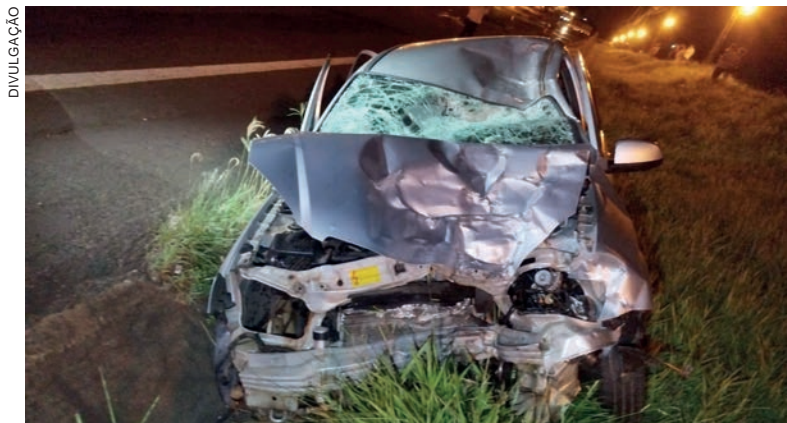
Celta teve a parte frontal completamente destruída devido à violência do impacto contra a motocicleta que invadiu sua pista

O acidente aconteceu pouco depois das 22h. O tráfego no trecho teve que ser impedido até que os corpos e os veículos fossem removidos. Antes disso, peritos do Instituto de Criminalística de Umuarama foram acionados e fizeram um levantamento da cena. Em seguida, os corpos foram trasladados ao Instituto Médico Legal (IML) de Umuarama. Foram liberados ontem (20) pela manhã aos familiares.