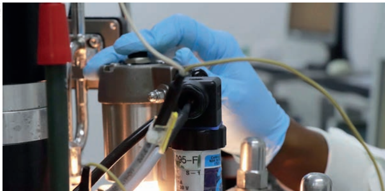
Tecpar é o único laboratório público produtor do imunológico. Vacinas serão usadas pelo Ministério da Saúde nas campanhas de vacinação de cães e gatos em todo o País