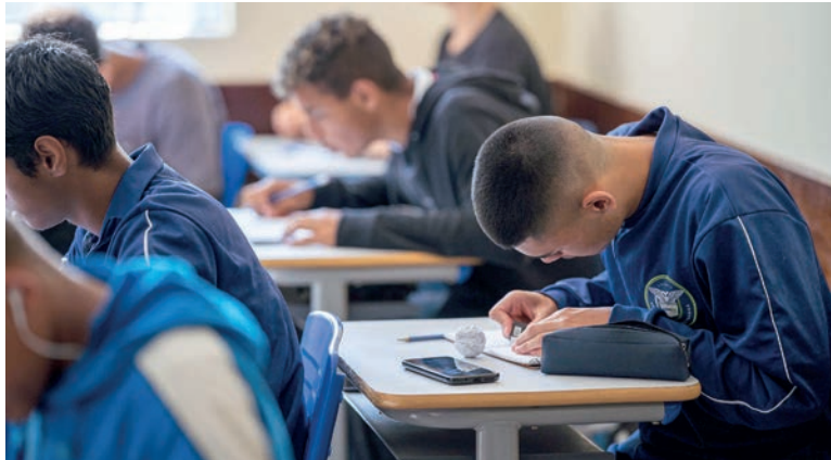
A educação cívico-militar combina elementos da gestão civil com a presença de profissionais militares da reserva na administração e na rotina escolar

Com esse novo resultado de dezembro e as votações ocorridas em novembro, com 83 adesões, além dos 194 colégios que já funcionavam nesta modalidade e os 12 do modelo do programa nacional que serão incorporados, serão 312