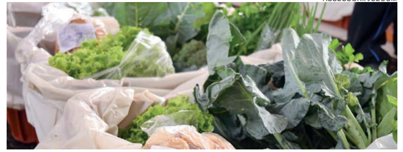
Órgão, ligado à Secretaria Municipal de Agricultura, atende também a 20 entidades socioassistenciais

das mil famílias mensais, o Banco de Alimentos entrega produtos para 20 entidades socioassistenciais. “Este é seguramente um dos mais importantes programas em atividade andamento no município, pois além de garantir