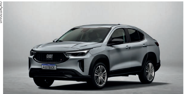
A Turbo 200 Automático é a versão de entrada do Fastback traz um novo patamar no segmento de SUVs

O Fastback Turbo 200 também tem uma lista de itens de série recheada com central multimídia de 8,4”, Apple CarPlay e Android Auto wireless, freio de estacionamento eletrônico, ar-condicionado