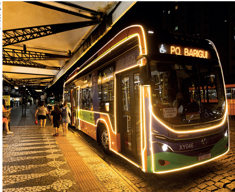
O Volvo BZL Elétrico que está na operação de Natal, realizou demonstração recente em Curitiba, transportando diariamente mais de 135 mil passageiros

O Volvo BZL Elétrico que está na operação de Natal, realizou demonstração recente