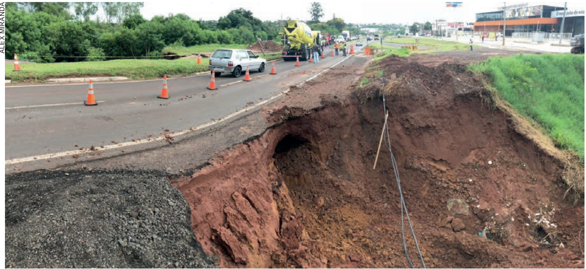
Segunda cratera que se abriu na entrada da nascente aumentou ainda mais na madrugada e gerou mais preocupação às autoridades, que começaram ontem os reparos no local

Segundo levantamento inicial feito pela Defesa Civil do Município, a cratera maior chegou aos cerca de 15 metros de profundidade com um raio de 15 metros de diâmetro. A cratera menor, onde fica a entrada