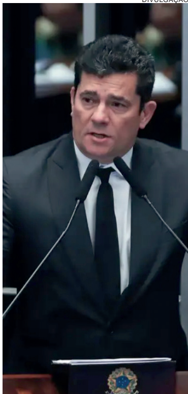
Investigação vai apurar conduta do ex-juiz em delação premiada

Em depoimento à PF, autorizado por Toffoli no ano passado, Garcia contou que as supostas chantagens teriam