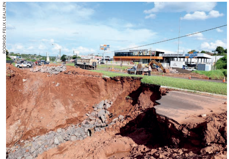
Nesta primeira semana de contrato, o foco está em reforçar o talude das outras pistas. O investimento é de mais de R$ 1 milhão, com previsão de conclusão em 90 dias

Na véspera da assinatura do contrato, na sexta-feira (12), foi feito um serviço de reforço por meio de equipe de administração direta do Escritório Regional Entre Rios, da Superintendência