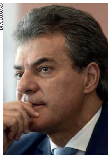
A defesa de Richa diz acreditar que o recurso não mudará o panorama, considerando que, em casos semelhantes, o STF não admite impugnações de promotorias estaduais

Ao recorrer da decisão do magistrado, o MPPR salienta que, entre as quatro operações, duas tramitam na esfera estadual e não têm relação