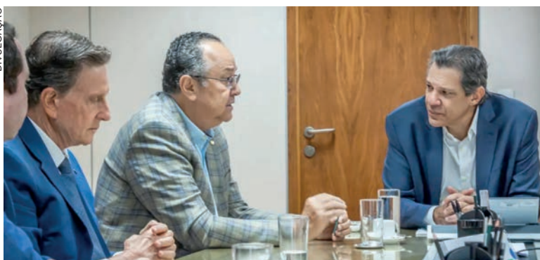
Ministro da Fazenda Fernando Haddad teve que se reunir com integrantes da bancada evangélica para amenizar o problema

O ministro acrescentou que o ato declaratório editado em julho de 2022 trazia insegurança jurídica e criava uma "margem para interpretação" de que a medida seria casuística. "Não foi uma revogação, nem uma convalidação, foi uma suspensão. Vamos entender o que a lei diz e vamos cumprir a lei", comentou. O benefício gera perda de arrecadação de R$ 300 milhões por ano à União.