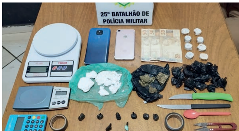
Drogas foram apreendidas no carro e na casa do casal que acabou preso sob a acusação de tráfico de drogas

Em seguida as diligências continuaram na residência do casal. No imóvel foram encontradas outras 3 porções de cocaína, um invólucro verde contendo 35,2 gramas de cocaína, 13,5 gramas de maconha em um pote de vidro, R$ 150 em uma cômoda; 2 fitas isolantes (usada para lacrar as porções com a droga); 2 facas de serra; 1 colher de plástico pequena, 1 tesoura pequena,