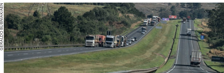
Proprietários que optam pelo pagamento integral com o desconto e os que escolhem parcelar em cinco vezes devem efetuar o pagamento na data

Os contribuintes do Paraná devem gerar as guias de recolhimento (GR-PR) por meio dos canais oficiais como o Portal IPVA, os aplicativos Serviços Rápidos da Receita Estadual e Detran Inteligente, além do Portal de Pagamentos de Tributos.