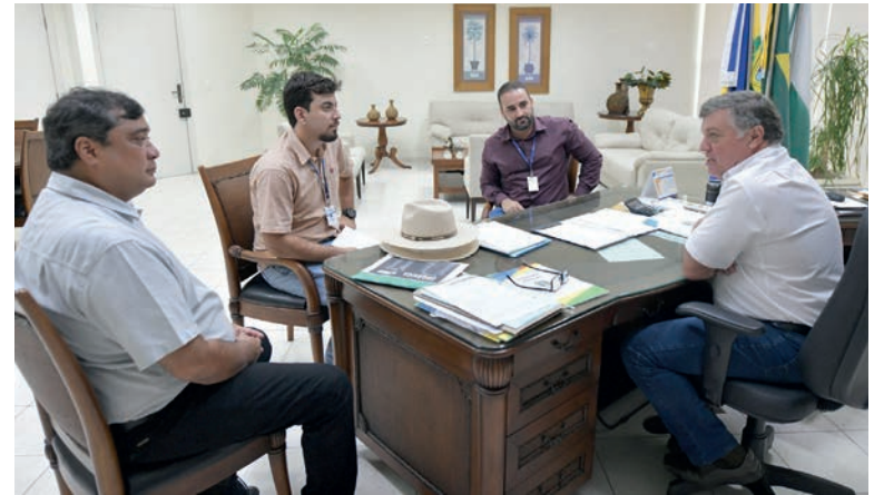
Prefeito e secretário de Meio Ambiente de Umuarama devem prestigiar o evento que começa hoje em Palotina

biológicos, 51 parcelas programas nutricionais, 16 parcelas com tratamento sementes, 11 parcelas tecnologia aplicação, 28 espécies forrageiras, três instituições pesquisa e uma de ensino. "A edição 2024 do Dia de Campo também serão realizadas dinâmicas de máquinas e apresentação gastronômica com produtos C.Vale. Será uma satisfação receber produtores rurais de Umuarama e de toda a região", registrou Cezar.