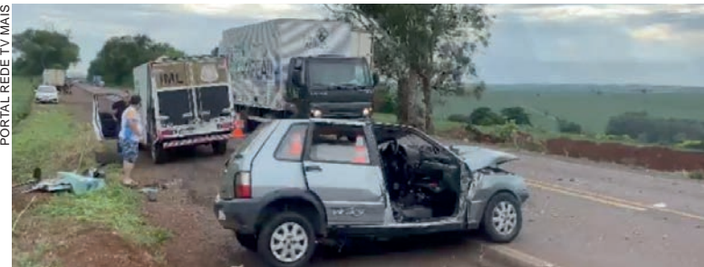
Fiat Uno ficou completamente destruído após a colisão frontal que envolveu também um caminhão na rodovia PR-323

e uma passageira, de 58 anos, não sofreram ferimentos e foram liberados após os serviços de apuração do acidente.