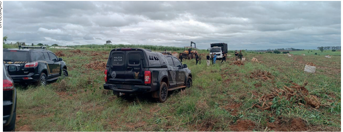
Trabalhadores atuavam na colheita de mandioca quando foram descobertos pela polícia e resgatados

As imagens capturadas também revelaram a falta de manutenção na residência dos trabalhadores, com camas em estado deteriorado, ausência de espaço adequado para armazenar roupas e alimentos