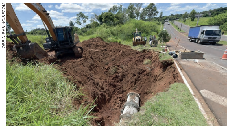
Secretaria de Obras fez a substituição de oito tubos após chuvas causarem grande estrago na altura do Parque Cidade Jardim

segurar que não haja outros incidentes parecidos por décadas. "A Prefeitura tem uma empresa contratada justamente para realizar esse tipo de socorro, fato que garantiu agilidade na resolução, que aconteceu em menos de três dias", comentou Caobianco, indicando que, caso os moradores identifiquem rompimentos de galerias, que entrem em contato com a prefeitura tanto pelo telefone da Ouvidoria, no 156, quanto pelo telefone direto (44) 3621-4141.