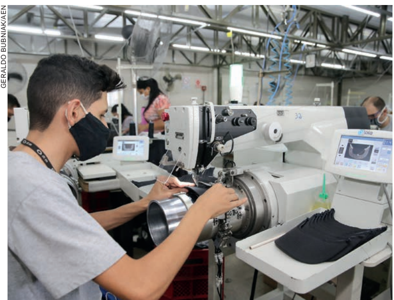
O Paraná foi responsável por 80% das 91.897 intermediações de contrato de trabalho de jovens realizadas pelas Agências do Trabalhador na região Sul em 2023