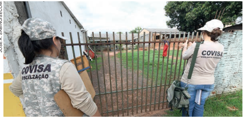
Foram duas pessoas no Jardim Lisboa, uma no Vitória Régia e outra no Posto Central