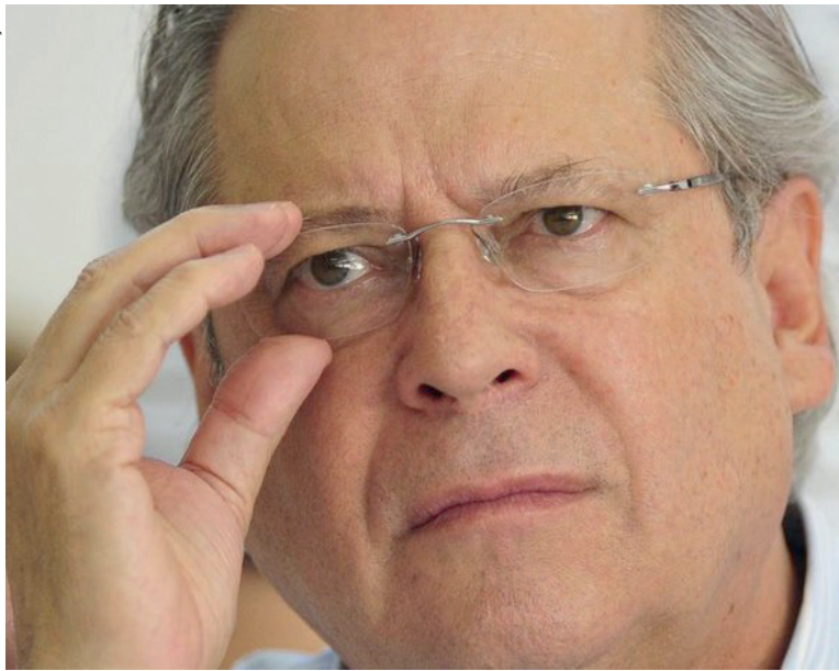
Apesar de reconhecer a competitividade de um candidato bolsonarista na próxima eleição presidencial, o petista reitera o favoritismo do atual presidente

O quarto mandato de Lula, em sua análise, é parte de um projeto de poder de longo prazo. Na entrevista, ele afirmou que um ciclo de governo de 12 anos à esquerda “é viável, é possível”. “Quando nós chegamos ao governo, eu disse que tínhamos que ter uma perspectiva de 20 anos, e nós tivemos. Se a Dilma não tivesse sofrido golpe, nós teríamos governado o Brasil por 20 anos”, disse.