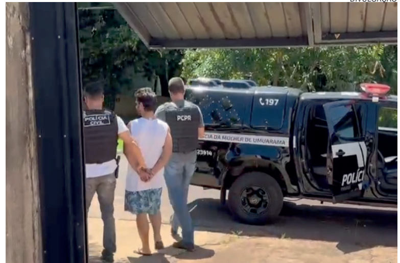
Acusado de manter a mãe em cárcere e agredi-la foi detido e conduzido à Delegacia da Mulher

Os policiais salientam que a Polícia Civil representou pela manutenção da prisão do acusado, que possui diversos antecedentes criminais por violência doméstica contra sua mãe e também contra sua própria avó materna.