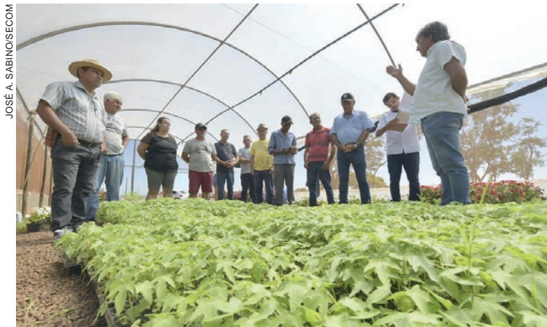
Ação faz parte do Programa de Fruticultura mantido pela prefeitura de Umuarama

o número do Incra, ou seja, só podem ter esse número [do Incra] aquelas com mais de 20 mil metros quadrados. Nos casos em que sítios foram desmembrados em propriedades com metragens inferiores, o município fica impossibilitado de realizar o cadastro dessa família. Há documentos que também são indispensáveis, como o Cad-Pro (municipal), matrícula do imóvel e DAP (Declaração de Aptidão ao Programa Nacional de Fortalecimento da Agricultura Familiar)”, pontua.