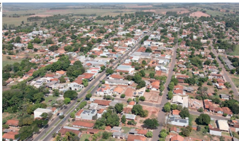
As vistorias analisam se a ligação do imóvel à rede coletora de esgoto foi feita de forma adequada a fim de evitar transtornos

As ligações feitas de forma inadequada podem trazer transtornos para o morador e para a cidade. Se as calhas de chuva estiverem interligadas ao sistema de esgoto, por exemplo, em dias