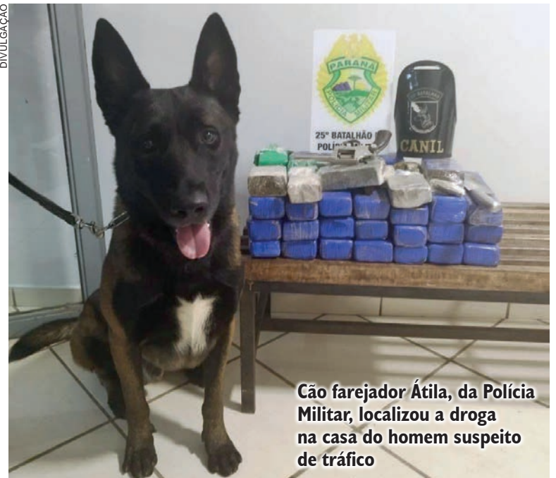
Cão farejador Átila, da Polícia Militar, localizou a droga na casa do homem suspeito de tráfico

Já o morador da casa foi abordado e, em revista pessoal, a equipe encontrou o revólver em sua cintura, muniado com 3 cartuchos intactos. Já na residência, com apoio do cão de faro Átila, a equipe encontrou 16,4 quilos de maconha divididos em 22 tabletes, uma faca cromada, rolo de papel transparente e outras porções menores em alguns cômodos. Também foi encontrado R$ 530 em notas diversas.