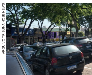
Análise terá que ser concluída em 3 meses e dará sustentabilidade jurídica para abertura de licitação visando contratação de empresa que irá atuar no novo sistema

o município poderá abrir um edital para a contratação de empresa que irá gerenciar o sistema”, salienta, concluindo que o preço para que o estudo esteja concluído é de três meses. “Neste período vamos acompanhar o serviço, passando as informações necessárias e explicando o modelo que pretendemos seguir no município”, conclui Capelli.