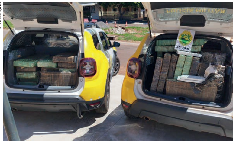
Droga foi encontrada em uma residência no centro da cidade. Proprietário do imóvel e responsável pelo entorpecente foi preso em flagrante

Em conversa com as equipes, ele confessou que mantinha o depósito de drogas e apontou o local exato onde o material estaria guardado. Ao vistoriar o imóvel, foram encontrados 405,8 quilos de maconha dividido em 42 unidades de pesos distintos.