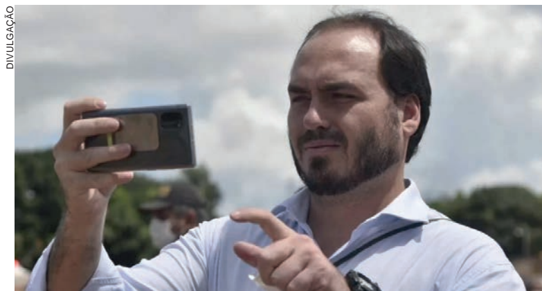
Um dos alvos da apuração é o vereador Carlos Bolsonaro (Republicanos-RJ). O filho "02" do ex-presidente teria recebido informações da suposta "Abin paralela"

A PF foi às ruas na manhã para vasculhar endereços no Rio de Janeiro (5), Angra dos Reis (1), Brasília (1), Formosa (GO-1) e Salvador (1). A nova etapa do inquérito mira o "grupo político" vinculado aos servidores da Abin sob