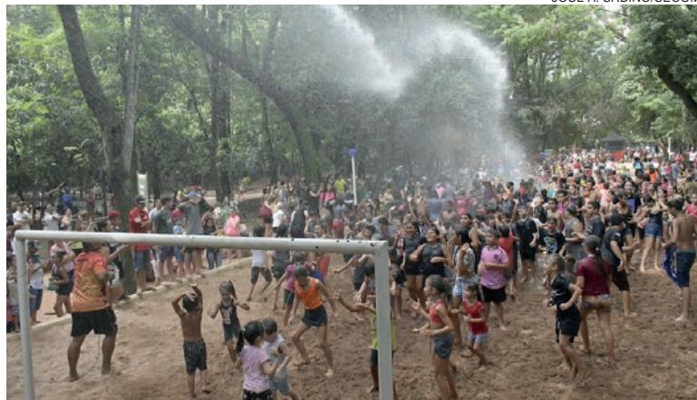
Atividades diversas para reunir pais e filhos, distribuição de pipoca, tirolesa e jogos coletivos foram algumas das atrações

ouro, a criançada foi à loucura com uma atividade surpresa: o banho de lama, que também teve apoio do Corpo de Bombeiros. “É realmente muito importante a realização de eventos como esse, onde a união da família é colocada em primeiro lugar. Parabéns a todos os profissionais da Smel, muito obrigado a todas as pessoas que apoiaram para que esse evento fosse um sucesso. As crianças de Umuarama merecem promoções como esta”, resumiu Pozzobom.