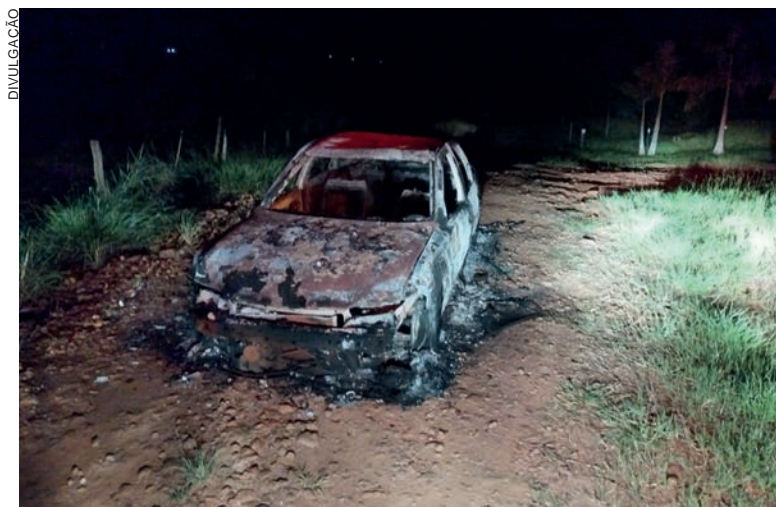
Veículo do caseiro da propriedade foi levado e depois a incendiado pelos autores do roubo

ximidades da propriedade onde aconteceu o crime. Os autores não foram encontrados.