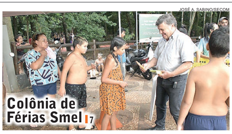
Colônia de Férias Smel 17