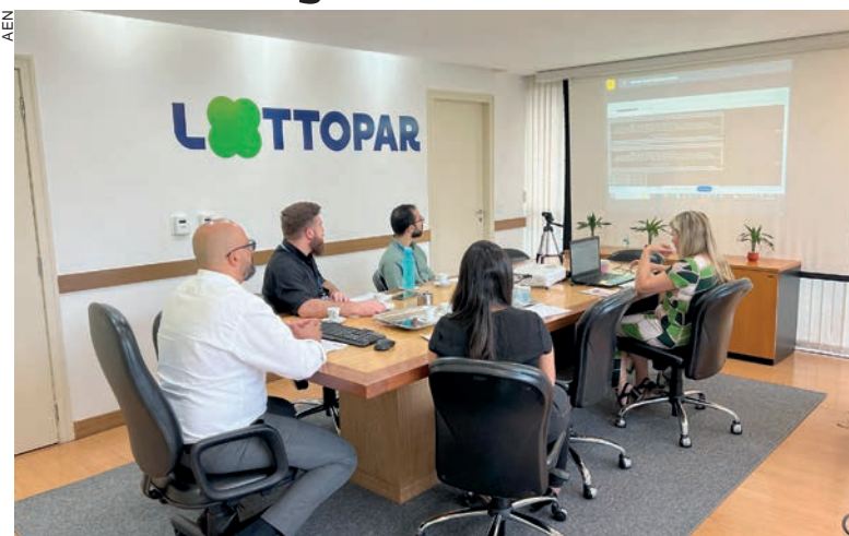
Os apostadores podem consultar a lista dos operadores no site da Lottopar. O paranaense só deve utilizar os sites de apostas devidamente autorizados pelo Governo do Estado

"A partir de hoje o apostador paranaense ganha mais uma opção para fazer as apostas esportivas. A empresa escolheu investir no Estado do