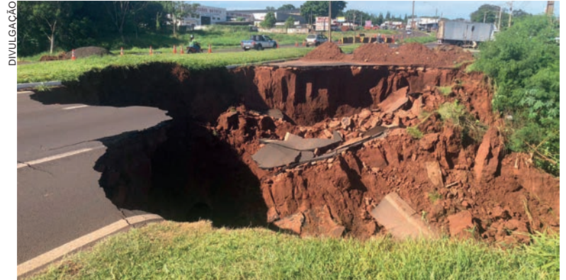
O trâmite referente à execução da manutenção no trecho danificado na rodovia PR-323 em Umuarama, não está entre os procedimentos suspensos pelo Tribunal

Ambas as decisões atenderam aos pedidos feitos pela