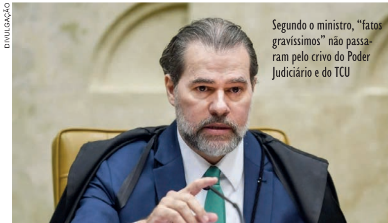
Segundo o ministro, “fatos gravíssimos” não passaram pelo crivo do Poder Judiciário e do TCU

Segundo o ministro, “fatos gravíssimos” não passaram pelo crivo do Poder Judiciário e do TCU. Isso porque o MPF, desde 2014, firmou parceria com a Transparência Internacional, organização não governamental (ONG) sediada em Berlim (Alemanha), para desenvolver ações genericamente apontadas como