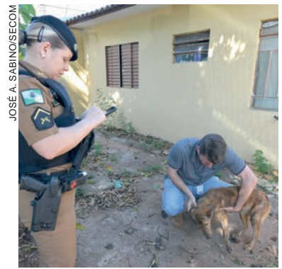
Jovem mantinha animal em condições deploráveis e acabou preso por soma de infrações

O prefeito Celso Pozzobom fez um pedido à população para que denuncie casos semelhantes. "É preciso que as denúncias sejam feitas oficialmente, seja pela Ouvidoria da Prefeitura, no telefone 156, ou na Polícia Ambiental, no telefone (44) 3624-7630. Sem uma denúncia formal, as forças de segurança ou responsá-