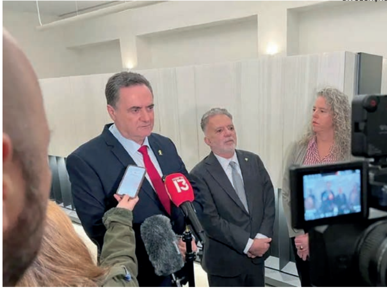
O ministro das Relações Exteriores de Israel, Israel Katz, voltou a criticar Lula. “Nós não perdoaremos e não esqueceremos – em meu nome e em nome dos cidadãos de Israel”

“A comparação do presidente brasileiro Lula entre a guerra justa de Israel contra o Hamas e as ações de Hitler e dos nazistas, que destruíram 6 milhões de judeus, é um grave ataque antissemita que profana a memória daqueles que morreram no Holocausto”.