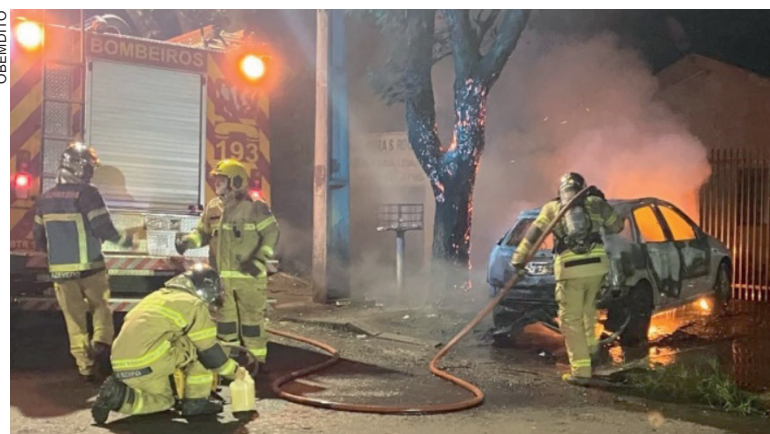
Bombeiros tiveram que agir rápido para apagar o incêndio que destruiu o carro e poderia se alastrar para a casa dos proprietários

mesmo homem que destruiu os vidros traseiros do carro seja quem ateou fogo no veículo. O Focus pegou fogo em frente à residência do casal e mobilizou equipes do Corpo de Bombeiros de Umuarama, que fizeram