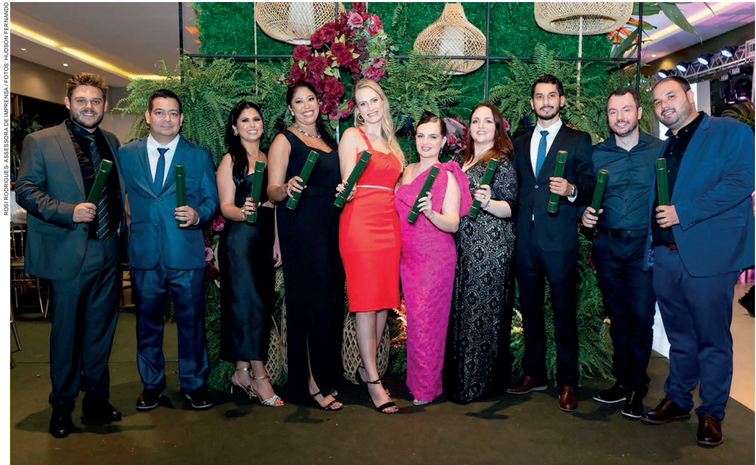
ROSI RODRIGUES-ASSESSORA DE IMPRENSA / FOTOS: HUDSON FERNANDO

A abertura do Rotary Day está marcada para às 9h de domingo, na avenida Dr. Ângelo Moreira da Fonseca no espaço da feira do produtor de quarta-feira, até as 16h. A Banda 26 de Junho fará uma apresentação musical para marcar o início do evento.