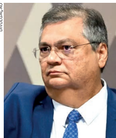
Entre os processos de Dino, está a ação da CPI da Covid-19 que apura se Bolsonaro e outros agentes públicos incitaram a população contra o combate da pandemia

Dino também será relator de casos de grande repercussão envolvendo figuras políticas com quem conviveu, como