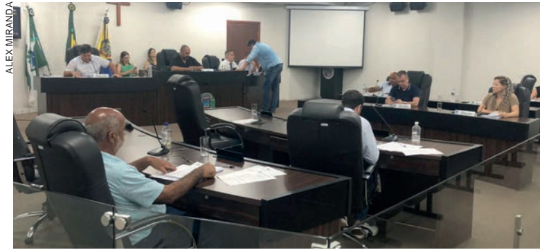
Parlamentares aprovaram oito projetos de lei enviados pela Mesa Diretora da Casa e pelo Poder Executivo Municipal

Outro texto, de autoria do Poder Executivo, autoriza a criação do Parque Tecnológico Technopark, que visa transformar Umuarama em um polo de ciência, inovação e tecnologia, estimulando o desenvolvimento econômico através da colaboração entre instituições de ensino superior, o setor de agronegócio, a indústria moveleira e outros. Além de fomentar o empreendedorismo e atrair investimentos, o parque tecnológico pretende melhorar os serviços públicos com tecnologia e projetos