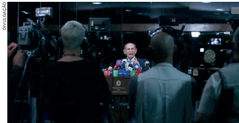
De acordo com o senador, a mudança será por três emendas à Constituição Federal

A primeira PEC não prevê a coincidência na mesma data para as eleições gerais para governadores, deputados estaduais e federais, senadores e presidente da República, e as municipais, para prefeitos e vereadores. Pela proposta,