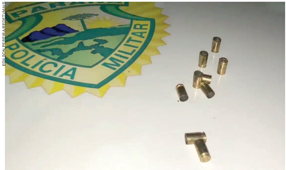
Cartuchos deflagrados de calibre 380 foram recolhidos pela Polícia Militar no local. Tudo será analisado pela perícia e a investigação será feita pela Polícia Civil

A Polícia Civil foi acionada para investigar o caso e a cena do crime foi isolada. Ao fim, os estojos e um boletim de ocorrência foram encaminhados para a 7ª Subdivisão Policial (SDP), que deve apurar o ocorrido. O autor do atentado não foi localizado.