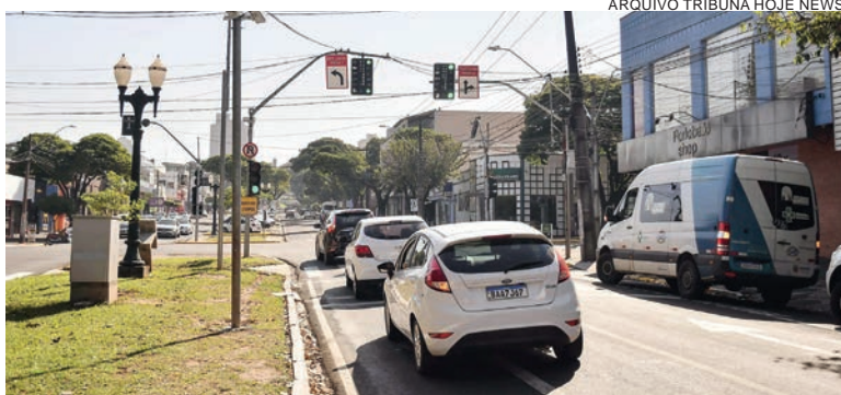
A recomendação aos condutores é para que evitem o trânsito pelos pontos onde estão sendo instalados os novos equipamentos para minimizar os transtornos

Nesta etapa, a troca dos conjuntos de semáforos será realizada no entrocamento da avenida Dr. Ângelo Moreira da Fonseca com a avenida Zaeli (substituição de cinco porta focos), no cruzamento da avenida Presidente Castelo Branco com a rua Governador Ney Braga – imediações do supermercado Planalto da Castelo (três porta focos) e no baixadão da avenida Paraná,