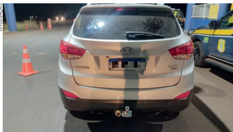
Veículo utilizado pelo acusado foi abordado e ele foi preso quando seguia em direção ao Paraguai

A Polícia Militar foi acionada imediatamente e passou a procurar pelo acusado, descobrindo que ele teria seguido em direção ao Paraguai e