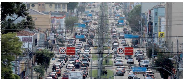
A frota do Estado é composta principalmente por automóveis, motocicletas, caminhonetes, motonetas e caminhões. São, ainda, 42.223 ônibus, 25.706 micro-ônibus e 2.827 triciclos

com mais veículos registrados são Curitiba, com 1.566.008, Londrina (419.119), Maringá (344.136), Cascavel (270.288), Ponta Grossa (238.905), São José dos Pinhais (236.193), Foz do Iguaçu (206.512), Colombo (154.421), Guarapuava (130.038) e Toledo (121.870). As com menos veículos registrados são Nova Aliança do Ivaí (853), Santa Inês (977), Mirador (978), Guaraqueçaba (987), Jundiá do Sul (1.237), Miraselva (1.310), Iguatu (1.349) e São Manoel do Paraná (1.381).