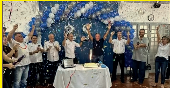
Equipe Uvel e o Parabéns à você