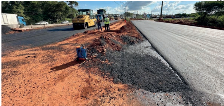
Km 299 da rodovia teve segmento demolido pelas fortes chuvas do fim do ano, e está com os últimos serviços de obra emergencial em andamento

Mais alguns serviços ainda serão executados no local, mas sem interditar a rodovia, como a colocação de meio-fio, plantio de grama nos taludes dos novos aterros, instalação de defesa metálica, demolição do desvio provisório no