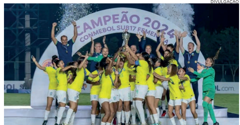
Invictas, brasileiras carimbaram vaga no Mundial da categoria este ano

“Estou muito feliz pela vitória, pelos gols, pelo campeonato e por tudo. Representar o Brasil e marcar em uma final é uma sensação única. Evoluí-