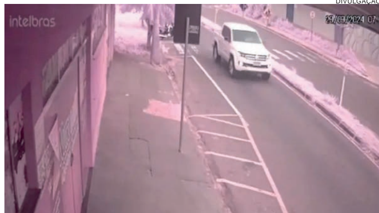
Em um dos casos, uma adolescente foi abordada e pediu ajuda, via telefone para a mãe, que registrou uma queixa na delegacia de Umuarama

O homem deve responder pelo crime de "stalking", previsto no artigo 147-A, do Código Penal, que trata sobre "Perseguir alguém, reiteradamente e por qualquer meio, ameaçando-lhe a integridade física ou psicológica, restringindo-lhe a