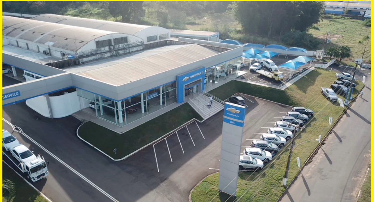
Concessionária Uvel Umarama