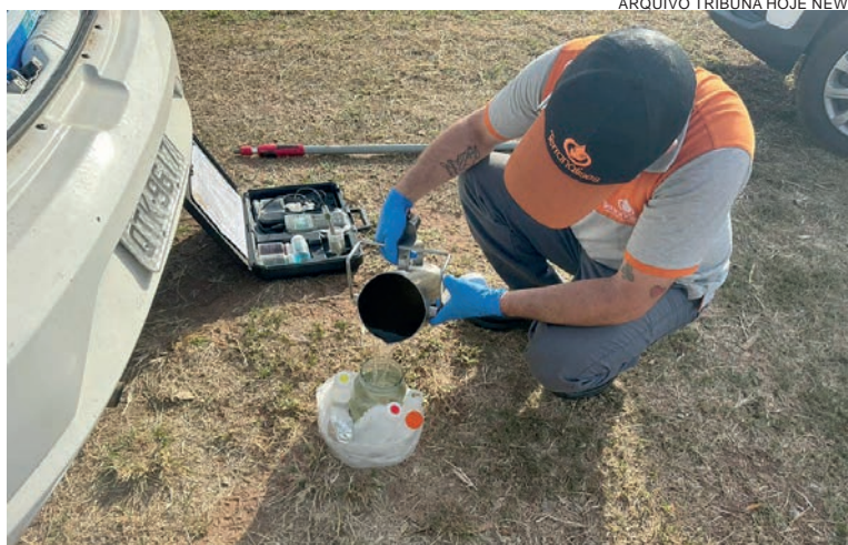
Após estudo, Secretaria de Meio Ambiente vai realizar a soltura de 16 mil peixes nativos

Ele esclarece ainda que há a possibilidade de certos metais pesados serem levados ao lago pelo vento. “Mas o pior, sem dúvida, continua sendo a falta de cuidados de pessoas que insistem em jogar lixo na rua. Quando vêm as chuvas, tudo é levado pelas galerias e vai parar no lago. É inacreditável a quantidade e os tipos de materiais retirados de lá: desde garrafas pet, fraldas e muito plástico, até equipamentos eletrônicos. Por sorte o lago resiste”, avalia.