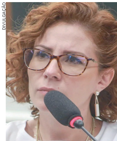
A defesa de Zambelli diz que vai demonstrar que a deputada não praticou as infrações penais pelas quais foi acusada

A decisão sobre o eventual recebimento da denúncia caberá ao Plenário do STF, julgamento que ainda não tem data para ocorrer. O ministro Alexandre de Moraes, relator, ainda deverá liberar os autos para que o presidente da Corte, ministro Luís Roberto Barroso, agende uma