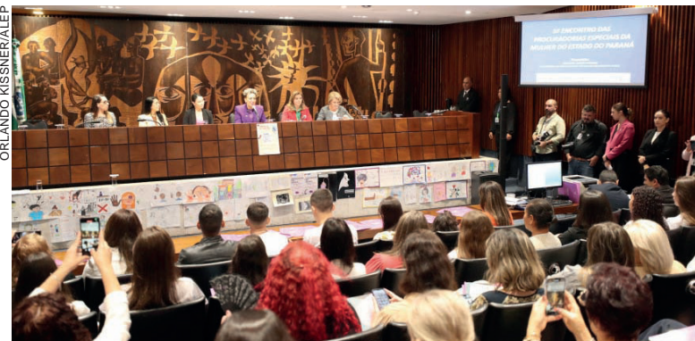
Evento ouviu experiências e demandas das participantes e de representantes das 153 procuradorias especiais espalhadas por todas as regiões do estado

“Os editais de incentivo à cultura são fundamentais para termos políticas públicas