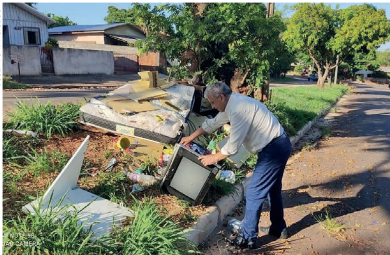
Morador identificado será notificado e, se não retirar os entulhos, pode receber multa que varia de R$ 425,55 a R$ 1.276,65