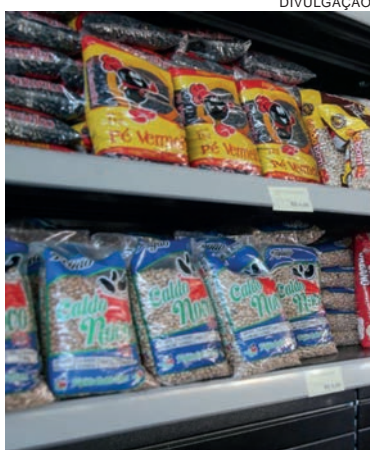
Reforma tributária propõe 14 alimentos com alíquota reduzida em 60%

Estão neste grupo arroz; feijão; leites e fórmulas infantis definidas por previsão legal específica; manteiga; margarina; raízes e tubérculos; cocos; café; óleo de soja; farinha de mandioca; farinha de milho, grumos e sêmolos de milho, grãos de milho esmagados ou em flocos; farinha de trigo; açúcar; massas e pães