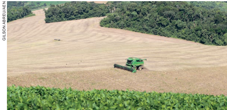
O Paraná é o principal produtor de feijão do País, com previsão de 946 mil toneladas este ano, respondendo por 29% da produção brasileira

Segundo ele, as cooperativas estão altamente interes-