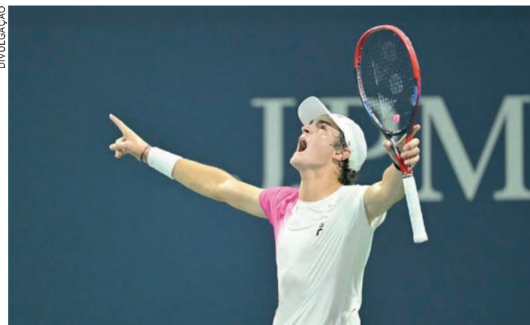
Triunfo do brasileiro sobre norte-americano teve pneu (6/0) no 2º set

A brasileira volta à quadra no sábado (7), às 6h (horário de Brasília), contra a norte-