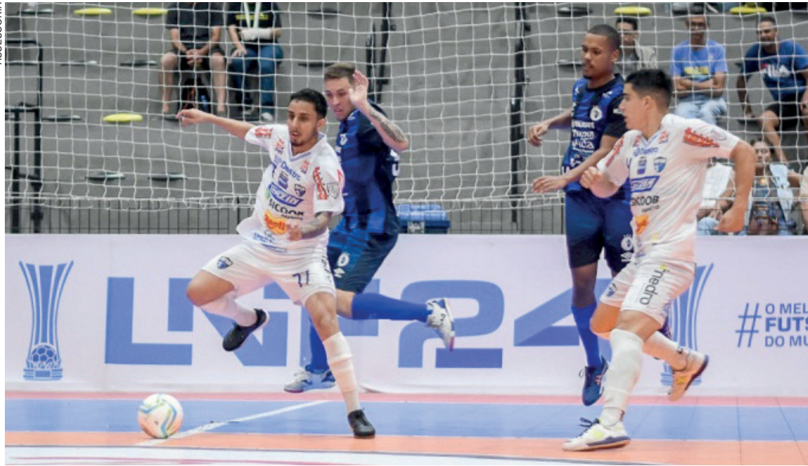
O time viajou até Mogi das Cruzes, em São Paulo e saiu vitorioso por 1 x 0

Com esse triunfo, a equipe da Capital da Amizade pulou da 9ª para a 4ª posição na tabela, somando 10 pontos até o momento, após disputar 5 jogos e conquistar 3 vitórias. Esses pontos conquistados diante da equipe paulista são cruciais na classificação. O próximo desafio será pela Série Ouro do Paranaense. No sábado (27), o Umuarama enfrentará o Galo de