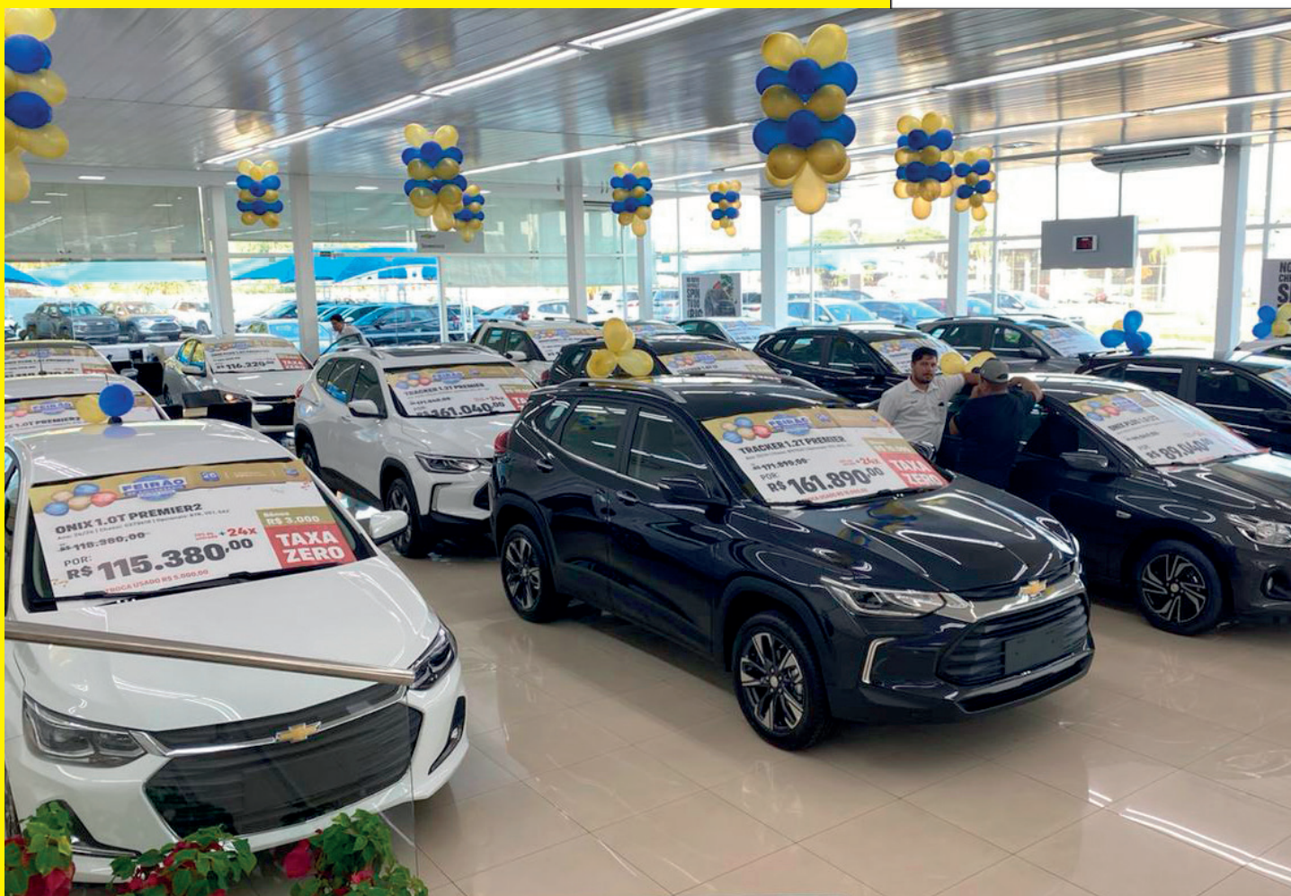
Showroom da Concessionária Uvel Umuarama

O Grupo UVEL comemora 25 anos e quem ganha o presente são os moradores de Umuarama e região. Um lote especial de Fábrica aterrissa na Concessionária neste final de semana com descontos de veículos que chegam até R$ 50.000,00 -, isto é ou não um PRESENATÃO! Mas é só nesta sexta-feira e sábado e com plantão até às 17 horas.