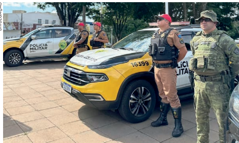
Além da PM, ação terá a participação de integrantes do Batalhão de Policiamento de Fronteira e da Polícia Rodoviária Estadual