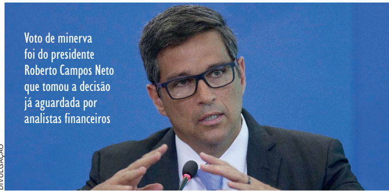
Voto de minerva foi do presidente Roberto Campos Neto que tomou a decisão já aguardada por analistas financeiros