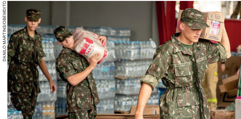
A triagem e organização das doações está contando com a ajuda da comunidade e de integrantes do Tiro de Guerra

“Na quarta-feira tivemos uma grande rede de voluntários nos ajudando com o envio das cargas. Queremos agradecer a toda a população, tanto pelas doações, como pelo voluntariado na organização e envio das cargas”, disse.