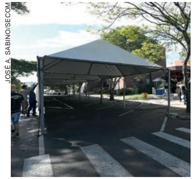
Evento terá atrações artísticas, comércio de presentes, artesanatos e Praça de Alimentação