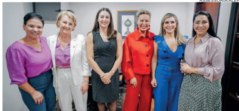
Desde a implantação, a representatividade feminina no legislativo paranaense vem ganhando força

Além dos estádios de futebol, o projeto prevê ações de prevenção e educativas em praças esportivas, ginásios e outros espaços destinados à prática de esportes, públicos