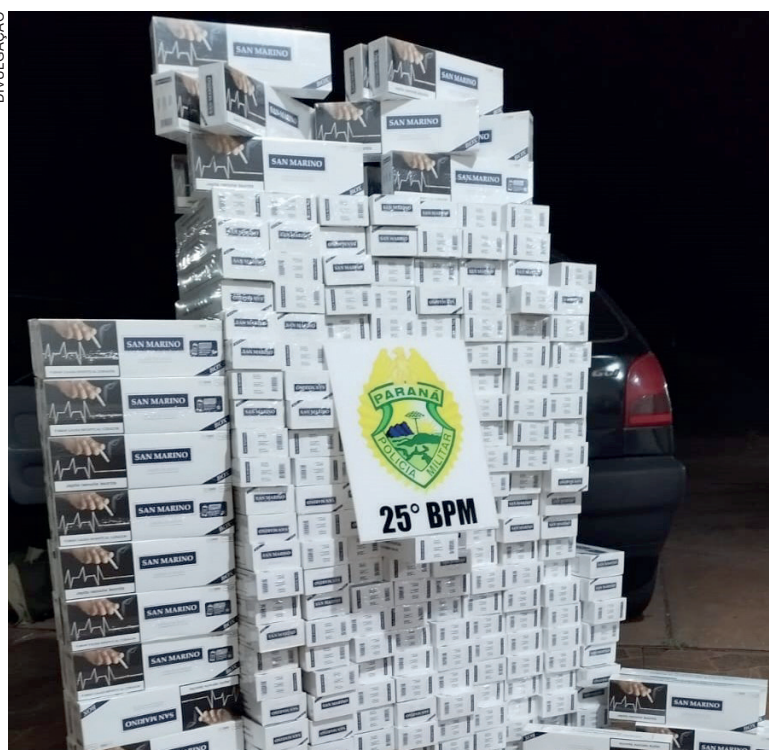
Cigarros contrabandeados do Paraguai foram recolhidos e entregues na Receita Federal de Guaíra