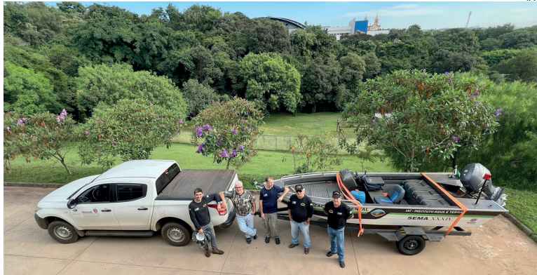
Comboio sai segunda-feira com 22 técnicos do IAT, 10 caminhões-pipa, 7 caminhonetes e 6 embarcações