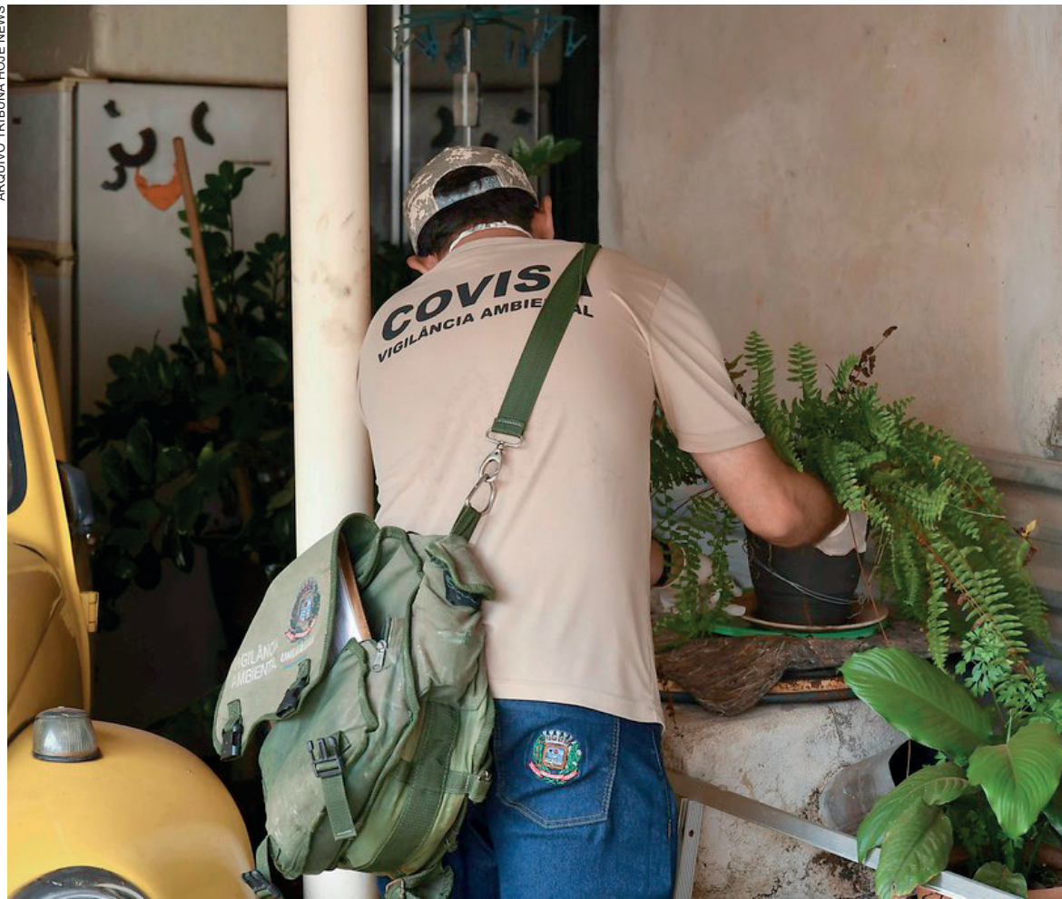
Ações de combate à proliferação do mosquito transmissor da doença seguem intensificadas em todas as áreas do município

No ambulatório de dengue, que atende de segunda a segunda até as 21h ao lado do Pronto Atendimento 24h, cerca de 20 mil pacientes já passaram pela triagem, 8.421 passaram pela primeira consulta, 10.975 exames foram realizados, 28 mil unidades de soro oral foram distribuídas, bem como 265 mil doses de medicamentos. Isso tudo entre o dia 28 de fevereiro e a última segunda-feira, 6.