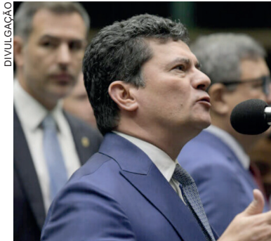
Recursos no TSE que pedem a cassação do mandato do senador Sergio Moro (União-PR), ex-juiz da Operação Lava Jato

No final de 2021, Moro estava no Podemos e realizou atos de pré-candidatura à Presidência