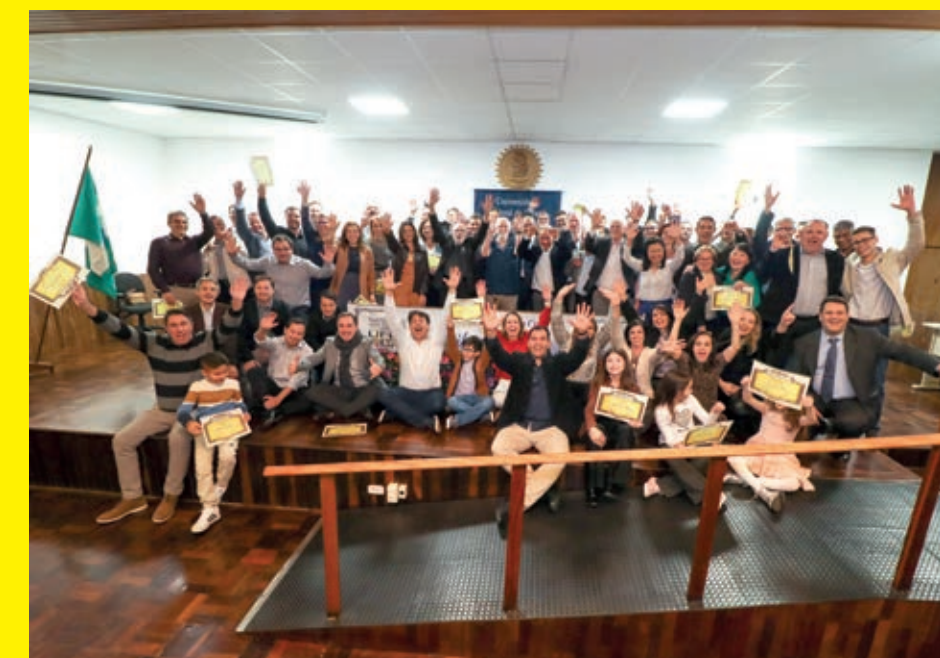
A alegria dos homenageados / turma 1998