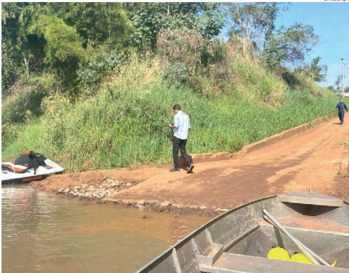
DEPOIS de localizado, o corpo do rapaz foi trasladado ao IML de Umuarama

Na segunda-feira pela manhã, o trabalho era desenvolvido por dois bombeiros. o efetivo foi aumentando dia após dia e contou com a ajuda