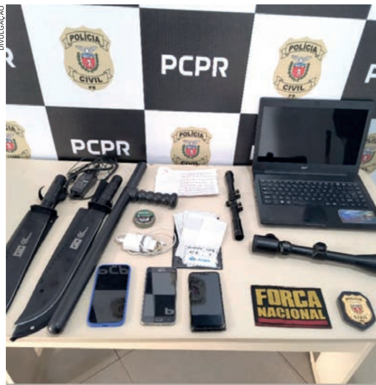
DURANTE a ação foram apreendidos celulares, notebook, lunetas, uma tonfa, uma lata com chumbinhos, facões e anotações dos criminosos

A delegada divulgou ainda que, entre as apreensões feitas em Alto Paraíso, estão três aparelhos celulares, um notebook, duas lunetas (dispositivos óticos, destinados à facilitar e melhorar a precisão dos impactos de projéteis disparados por armas de fogo), uma tonfa (instrumento militar de defesa pessoal), uma lata com chumbinhos, dois facões, anotações, uma nota promissória e onze folhas de cheques cuja origem não foi esclarecida.