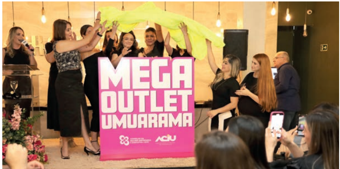
O NOME que a Feira passa a receber foi mantido em segredo e foi revelado para os empresários somente durante o lançamento