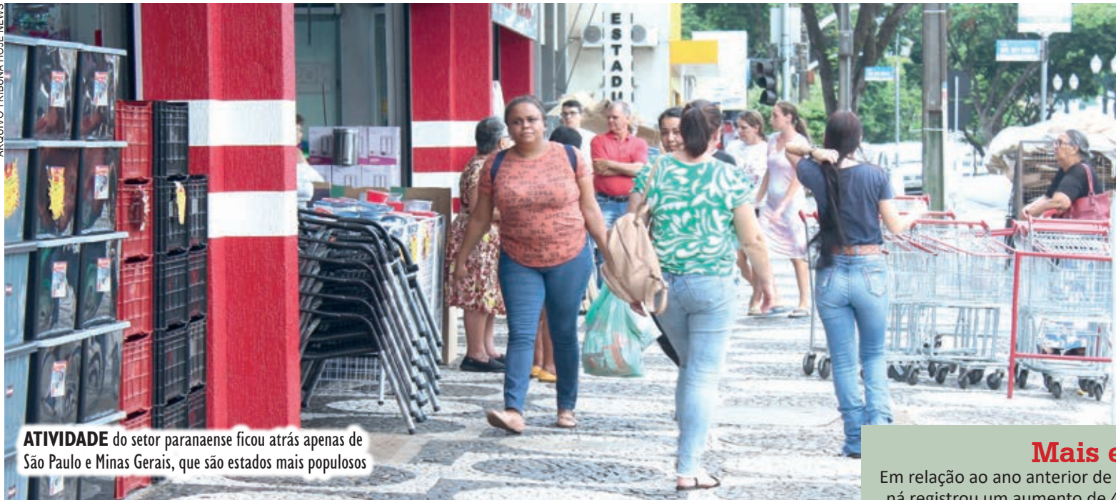
ATIVIDADE do setor paranaense ficou atrás apenas de São Paulo e Minas Gerais, que são estados mais populosos

As empresas do setor de comércio do Paraná tiveram a terceira maior receita bruta do Brasil, com R$ 591 bilhões movimentados em 2022. Os dados são da Pesquisa Anual de Comércio, divulgada ontem (25) pelo Instituto Brasileiro de Geografia e Estatística (IBGE).