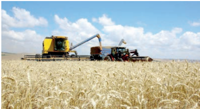
COLHEITADEIRAS devem entrar em campo a partir de agosto, iniciando pelas áreas que enfrentaram maior período de estiagem

A colheita do milho segunda safra 2023/24 avança rapidamente, atingindo 76% da área de 2,5 milhões de hectares. A média das últimas dez safras era de 30% colhido em julho. “Um percentual tão expressivo como esse em julho nunca foi observado, mas nesta safra pode ser considerado normal, visto ter sido possível o plantio já no início do zoneamento agrícola, especialmente no Oeste do Estado, que tem pouco mais de um terço da área total de milho”, afirmou o analista da cultura