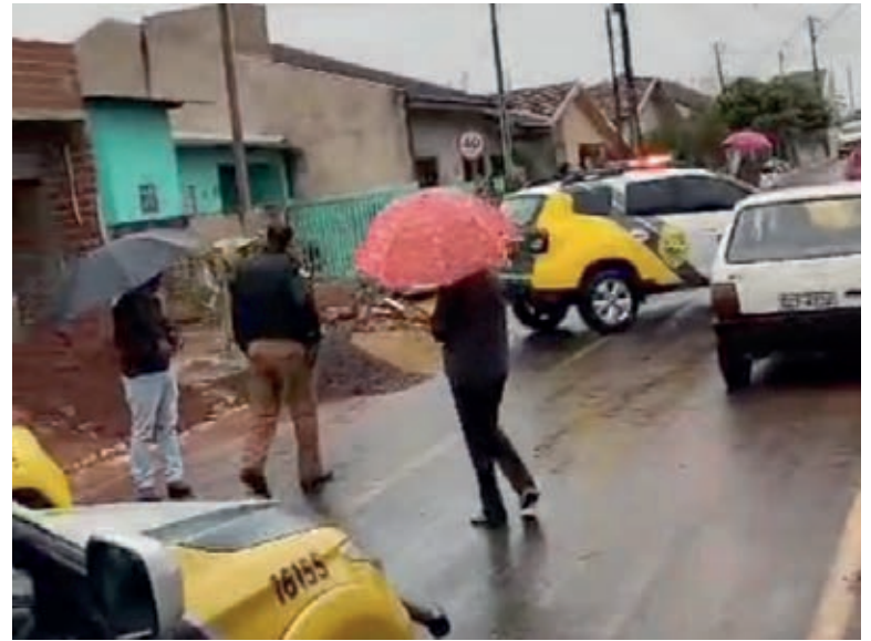
HOMENS foram executados a tiros dentro da casa em que estavam por dois criminosos, que fugiram do local

Depois que os procedimentos foram encerrados, os corpos dos homens foram recolhidos para exames no IML de Cianorte.