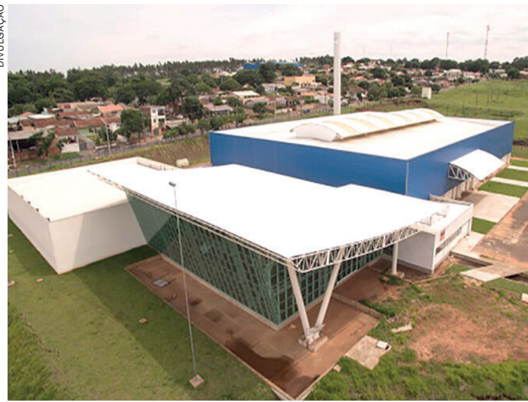
OS CURSOS serão no Centro de Eventos, com temas fundamentais para os administradores como obras públicas, vedações em período eleitoral e encerramento de mandato

Os encontros integram o Plano Anual de Capacitação dos Jurisdicionados do TCE-PR, elaborado pela EGP a partir de demandas identificadas na exe-