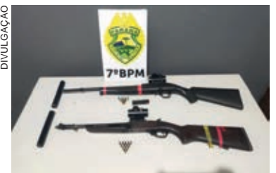
ARMAS muniçadas e com silenciadores foram encontradas com a dupla que foi presa em flagrante

tocicleta devido à falta de licenciamento e encaminhou os suspeitos com as armas para a 21ª Subdivisão Policial (SDP) de Cianorte.