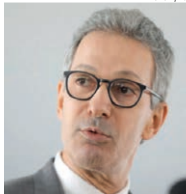
GOVERNADOR de Minas Gerais afirma que situação política pode mudar até 2026 e menciona casos de “descondenados” no Brasil

“Posso ser um apoiador, posso ser um candidato, o que eu quero é contribuir para um país melhor”, declarou Zema. Ele mencionou que outros governadores de centro-direita