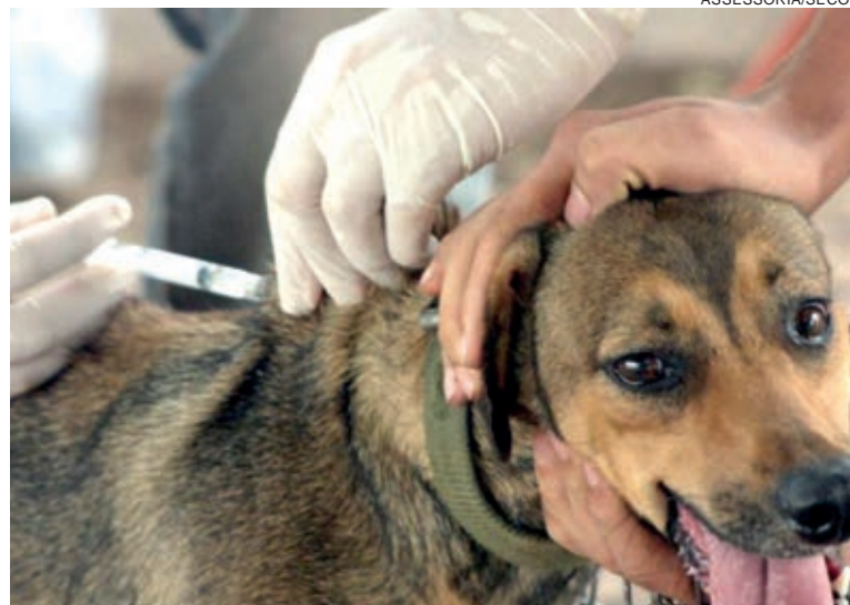
SECRETARIA de Meio Ambiente comunica que restam pouco mais de 100 vagas e interessados devem possuir o CadÚnico