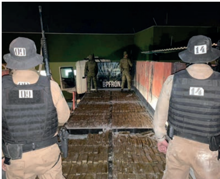
DROGA estava escondida em um fundo falso no assoalho da carreta