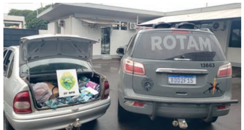
BANDIDOS fizeram o transbordo da carga ao Corsa Classic que foi usado no apoio e foi abordado no Parque das Jabuticabeiras

Policiais iniciaram patrulhamentos na tentativa de localizar os veículos, até receberem informações dando conta de que o furgão roubado havia sido visto na Estrada Jurupoca.