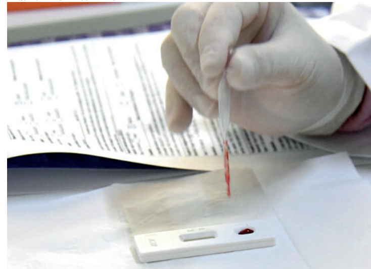
ATÉ DIA 28 de julho já são seis casos da doença, sendo três mulheres, dois homens e uma criança