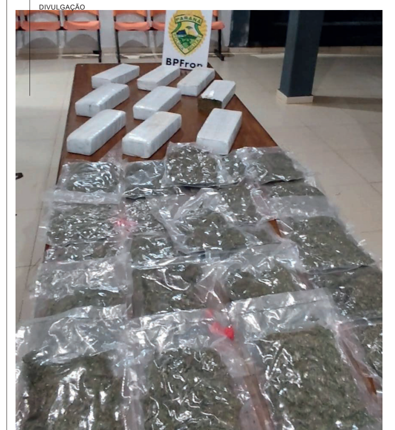
Durante abordagens rotineiras na noite do sábado (14), policiais militares que integram o BPFron (Batalhão de Polícia de Fronteira) averiguaram um ônibus de transporte interestadual com destino a Londrina. Durante a revista foram localizadas duas malas contendo 10,200 quilos de maconha prensada e 1,600 quilos de maconha tipo Skunk. O passageiro de 46 anos responsável pela bagagem foi preso e encaminhado com a droga para a Delegacia da Polícia Civil de Iporá, onde foi preso e autuado em flagrante por tráfico de drogas.

O veículo roubado foi encontrado abandonado. O outro envolvido ainda não foi localizado, mas já foi identificado pela polícia.