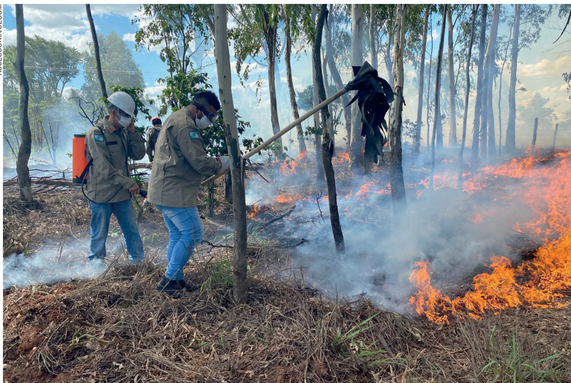
Novos brigadistas participaram do treinamento, ministrado pela Coordenadoria Municipal de Proteção e Defesa Civil (Compdec) de Umuarama

O núcleo busca inspirar uma mudança cultural e levar treinamento para o engajamento de comunidades participativas, informadas, preparadas e conscientes dos seus direitos e deveres relativos à segurança comunitária. “Vila Nova União será o primeiro distrito, mas a intenção é levar o