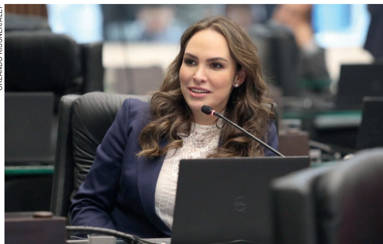
Ao todo são 314 emendas à LOA. Temas foram elaborados pela equipe técnica com apoio de lideranças de todas as regiões

A deputada explica que as emendas foram elaboradas pela equipe técnica com o auxílio de prefeitos, vice-prefeitos, vereadores e lideranças de todas as regiões. Também houve a indicação de entidades de classe, hospitais e organizações não governamentais. “Apresentamos emendas