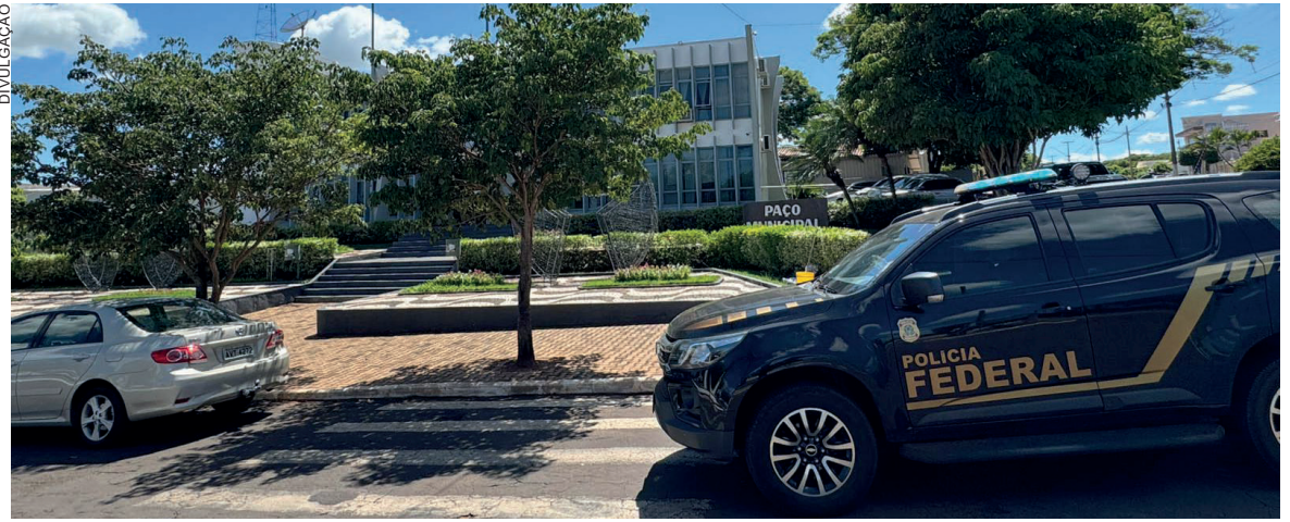
Durante a ação desenvolvida na cidade, foram cumpridos cinco mandados de busca e apreensão expedidos pelo Tribunal Regional Eleitoral do Paraná

A PF ainda afirma que, além dos possíveis crimes citados acima, também foi verificada a presença dos orçamentos realizados em loja de materiais de construção em nome do município, mas tendo como destinatários particulares. Tudo isso foi considerado elemento documental que corrobora a tese de cometimento de corrupção eleitoral, demonstrando indícios da suposta compra de materiais de construção pela prefeitura de São