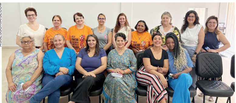
Com o resultado final da votação, as organizações da sociedade civil eleitas deverão indicar seus respectivos representantes até 10 de janeiro