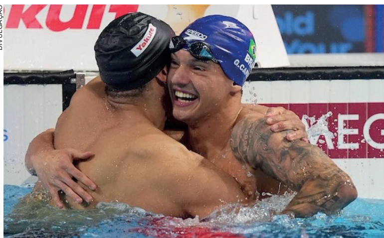
Baiano brilhou nos 50m livre, 3 dias após ser vice-campeão nos 100m

para a natação brasileira. Saímos daqui com três medalhas e com o ânimo renovado. Podemos dizer que começamos o ciclo para Los Angeles com o pé direito. Sabemos que temos muito tra-