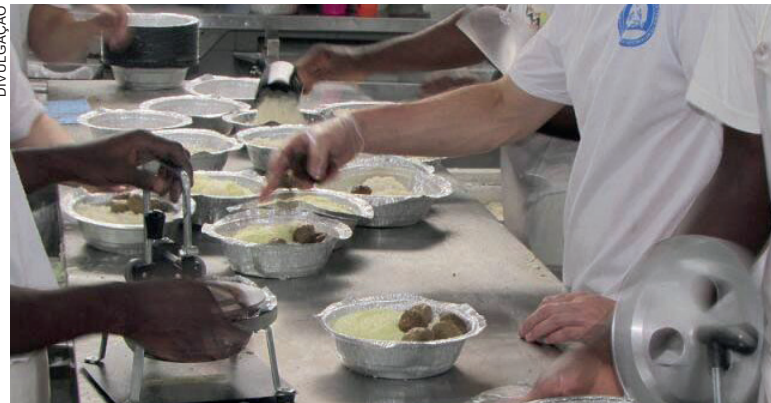
Medidas devem ser tomadas pela Sesp para garantir que a prestação do serviço de alimentação ao sistema penitenciário não seja interrompida