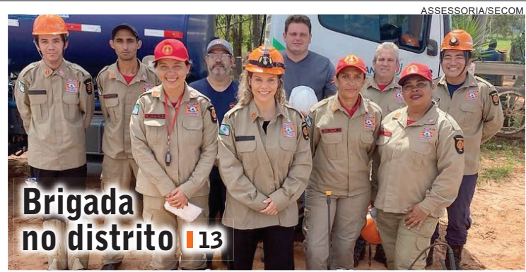
Brigada no distrito 13