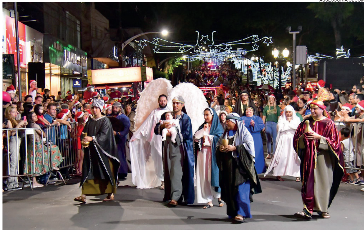
Milhares de pessoas prestigiaram o espetáculo artístico, que contou com 47 alas, show musical e queima de fogos