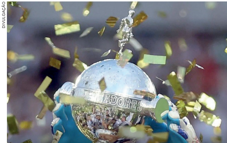
Times estreiam na 2ª fase, com jogos de 19 a 26 de fevereiro de 2025

A Pré-Libertadores compreende três fases: a primeira delas, sem times brasileiros e argentinos, será de 5 de fevereiro a 12 de março, com um total de seis times. Três se classificarão à segunda fase, se