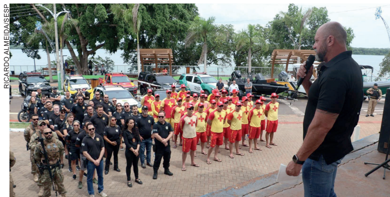
As polícias atuarão em conjunto para garantir a tranquilidade de moradores e turistas durante a temporada