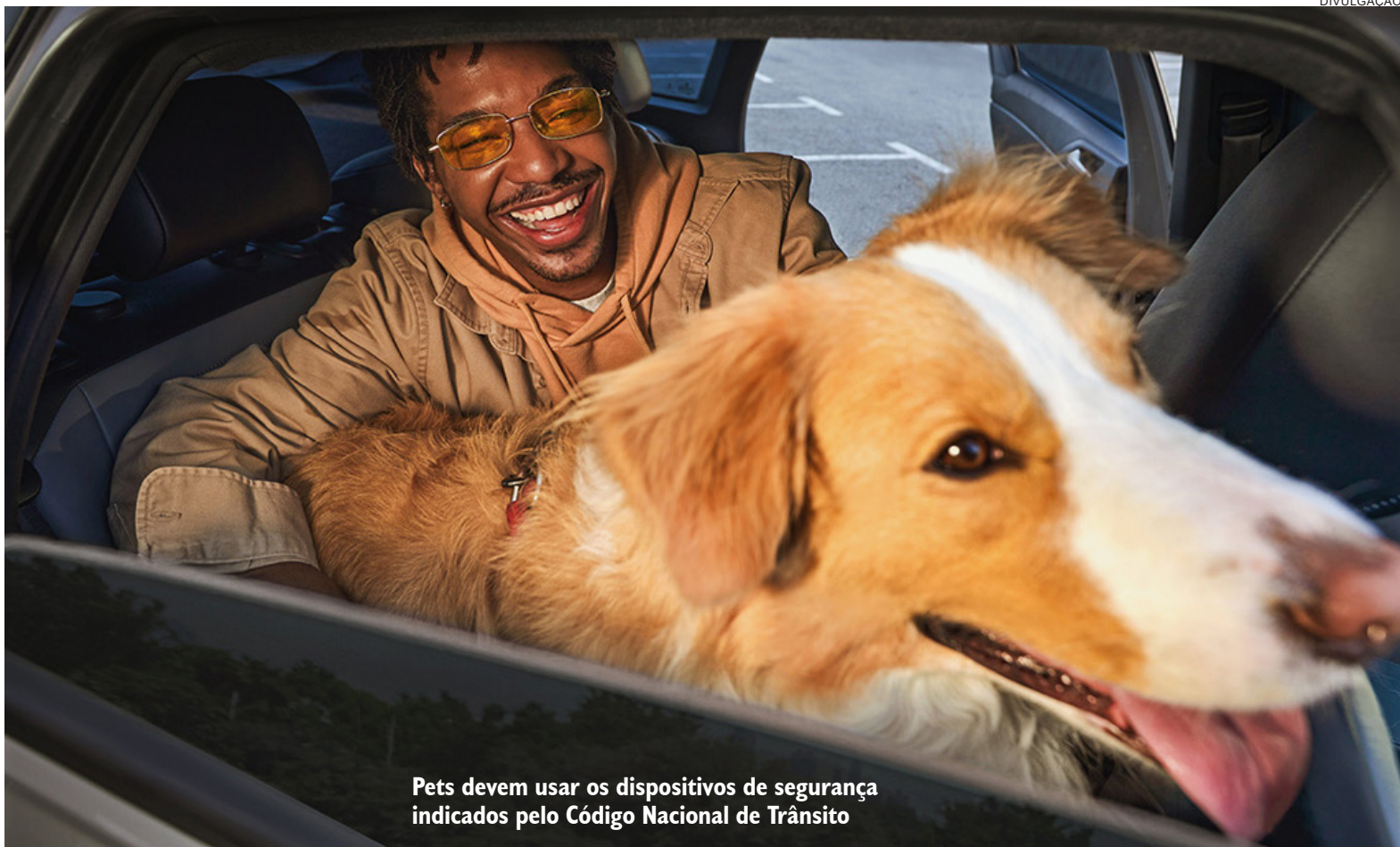
Pets devem usar os dispositivos de segurança indicados pelo Código Nacional de Trânsito

Certifique-se de levar toda a documentação necessária, incluindo o Certificado de Registro e Licenciamento do Veículo (CRLV), o seguro DPVAT, sua carteira de motorista e os documentos pessoais. Não deixe nada para última hora.