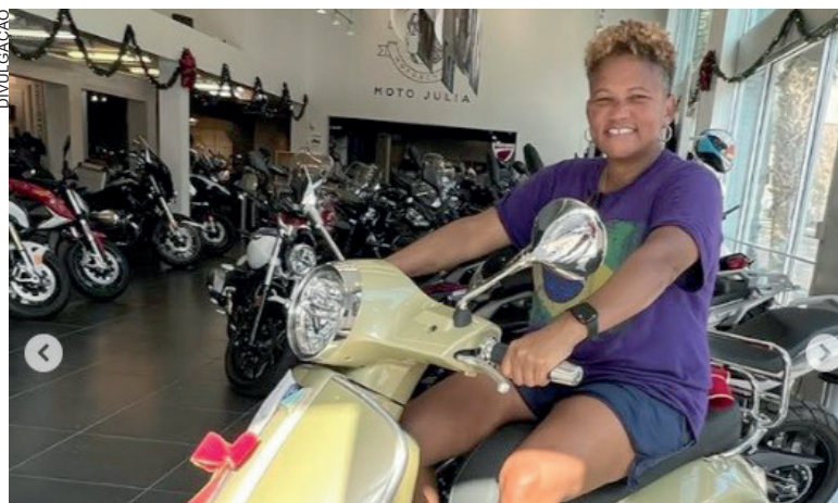
Conectada com o Brasil, nova técnica da seleção brasileira feminina deu entrevista coletiva

derados mais fortes e tradicionais, a seleção feminina ficou de fora das duas últimas edições da Copa do Mundo e também dos Jogos Olímpicos. A última competição de primeiro nível mundial que contou com a seleção brasileira foi a Olimpíada do Rio, em 2016.