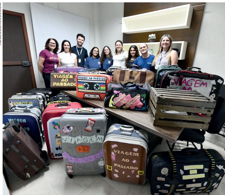
Cada mala possui entre 20 e 50 itens catalogados e identificados, facilitando seu manuseio e reconhecimento

"Os objetos e documentos, cuidadosamente preservados até agora por famílias que os guardavam com grande es-