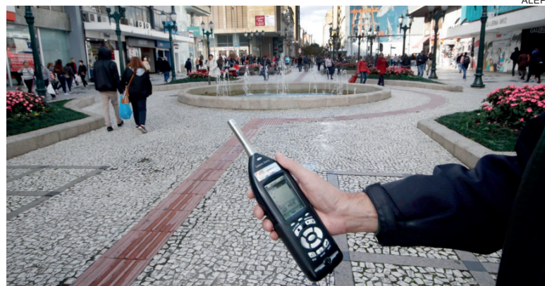
Texto observa limites, definida o equilíbrio entre a emissão de ruídos, a saúde humana e a qualidade ambiental e o desenvolvimento sustentável

Os planos e programas, conforme o projeto de lei, para gestão da poluição sonora serão, prioritariamente,