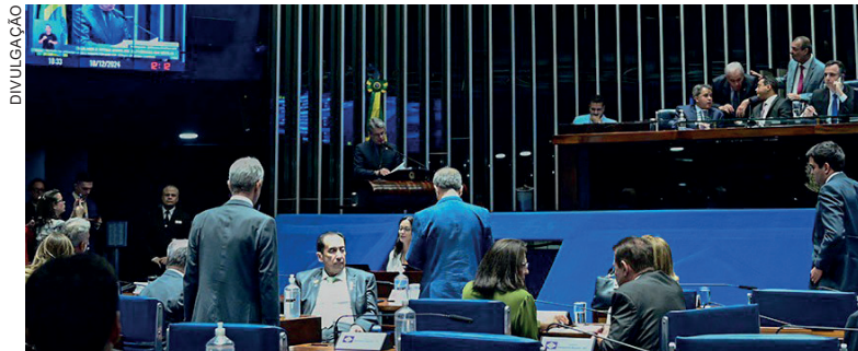
Segundo Alessandro Vieira, a restrição de celulares em escolas melhorou o desempenho nos países onde foi aplicada

Alessandro defendeu a proposta. De acordo com ele, com pleno conhecimento dos impactos que o uso do celular tem na vida das pessoas, mais ainda em adolescentes, a competição por